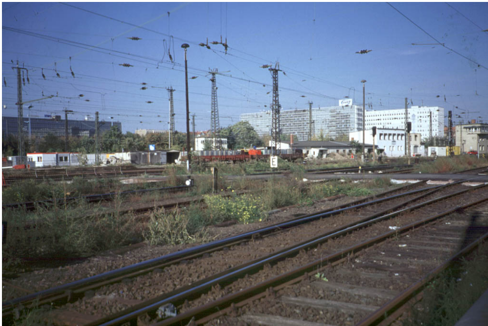
Abb. 4: Einfahrt des Hauptbahnhofs Halle (2002) mit Bassia scoparia subsp. densiflora und Diplotaxis tenuifolia .