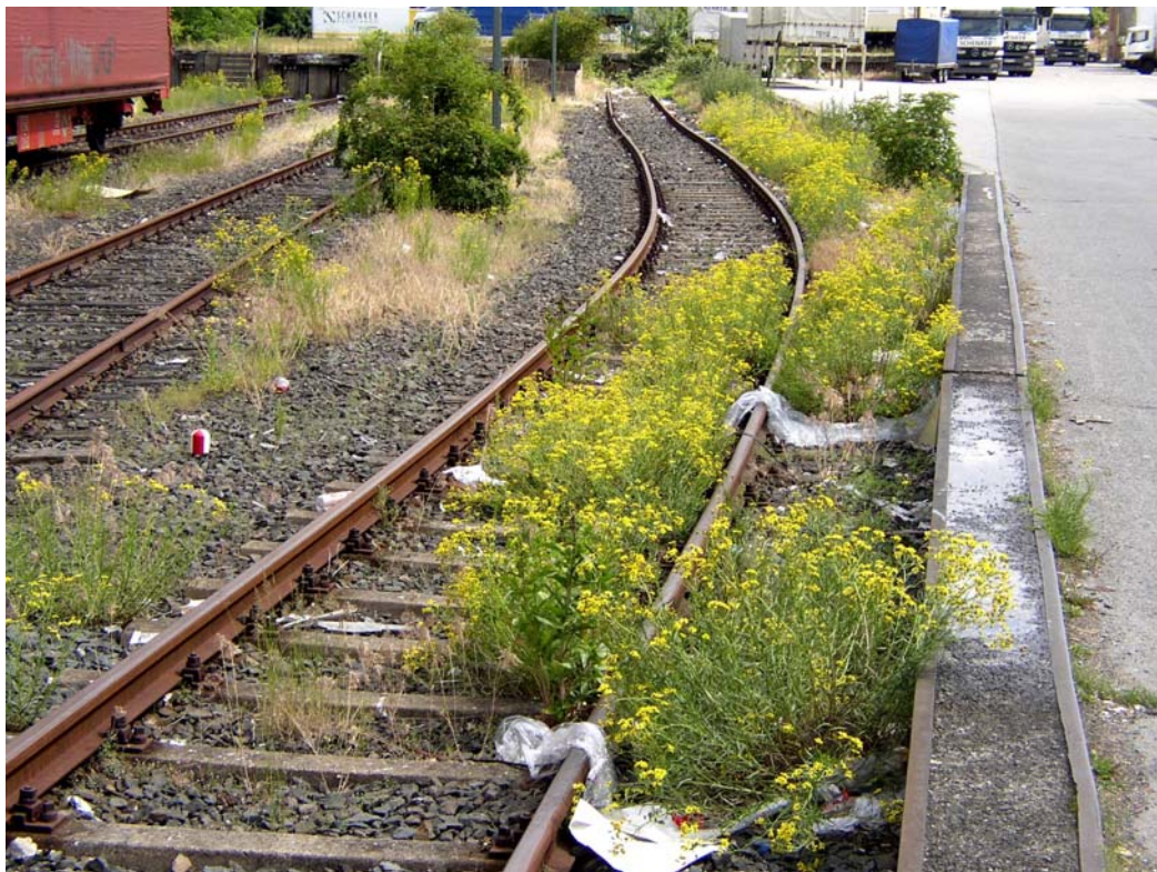
Abb. 5: Senecio inaequidens im ehemaligen Hauptgüterbahnhof Braunschweig (2005).

Bahnhöfen mehr als 1.000 Pflanzenarten wildwachsend angetroffen (BRANDES 2005). Gerade großstädtische Bahnhofssareale haben derzeit wichtige Refugialfunktionen, die sie jedoch vermutlich bald verlieren werden. Änderungen im Transportwesen führen zum Rückgang der geobotanischen Bedeutung, im Verhältnis zu den Eisenbahnanlagen übernehmen Autobahnen zunehmend Funktionen in der Ausbreitung von Pflanzenarten sowie als Wuchsort von Adventiv- und Ruderalpflanzen. Hauptquelle für Neophyten auf innerstädtischen Eisenbahnflächen sind heute angrenzende Gärten und Anlagen sowie insbesondere wild abgelagerter Gartenabfall, nicht jedoch der schienengebundene Transport.