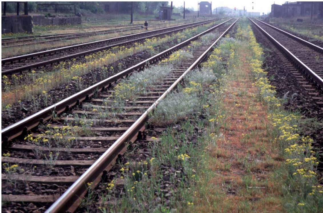
Abb. 2: Bandförmige Verbreitung (als Ergebnis von Linienmigration!) auf dem Bahnhof Perleberg (Brandenburg): Senecio vernalis (gelb), Bromus tectorum (silbrig grün), Saxifraga tridactylites (rotbraun).

Zahlreiche Pflanzenarten wurden in Mitteleuropa über das Eisenbahnnetz ausgebreitet, so zum Beispiel