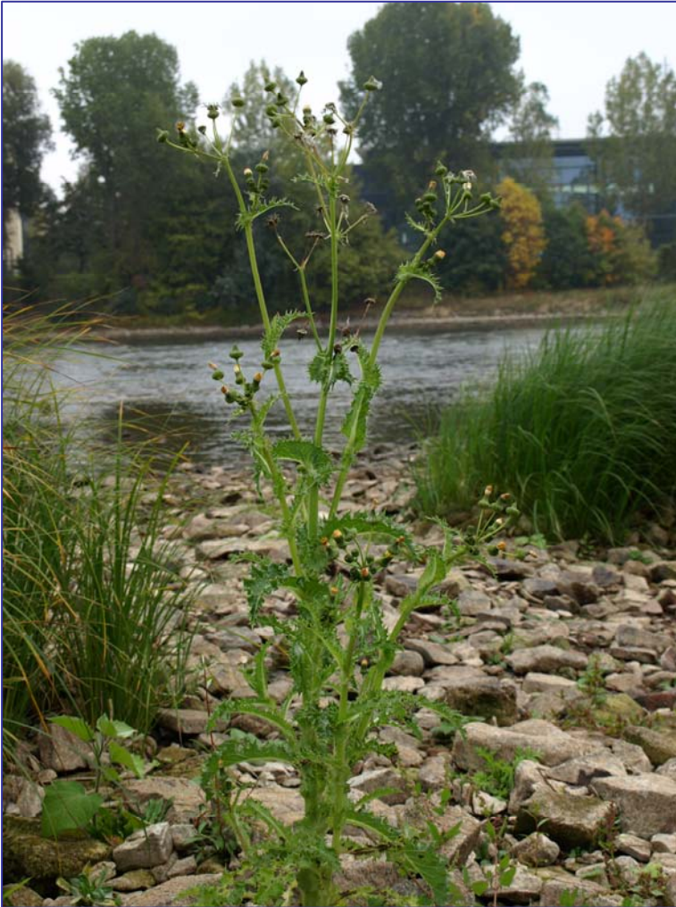
Sonchus asper (Rauhe Gänsedistel)