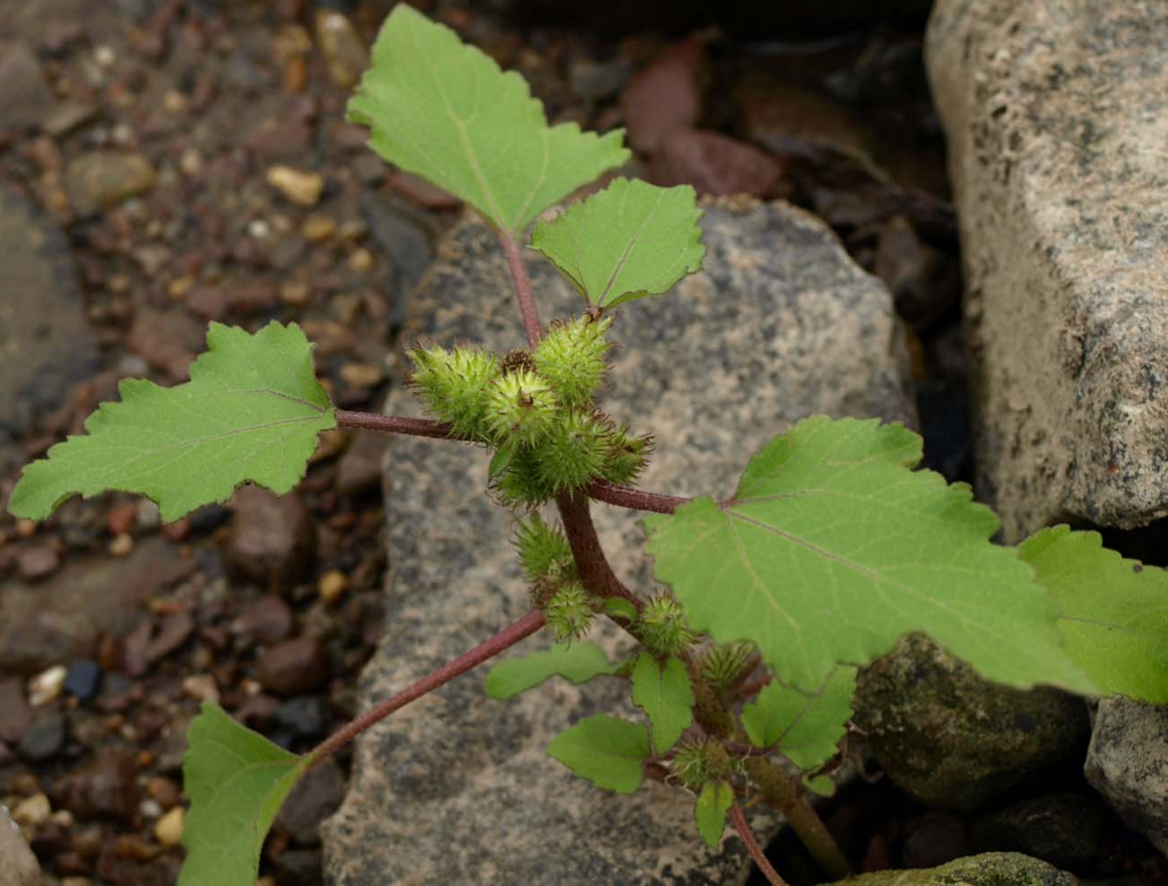
Xanthium albinum (Elbufer-Spitzkette)