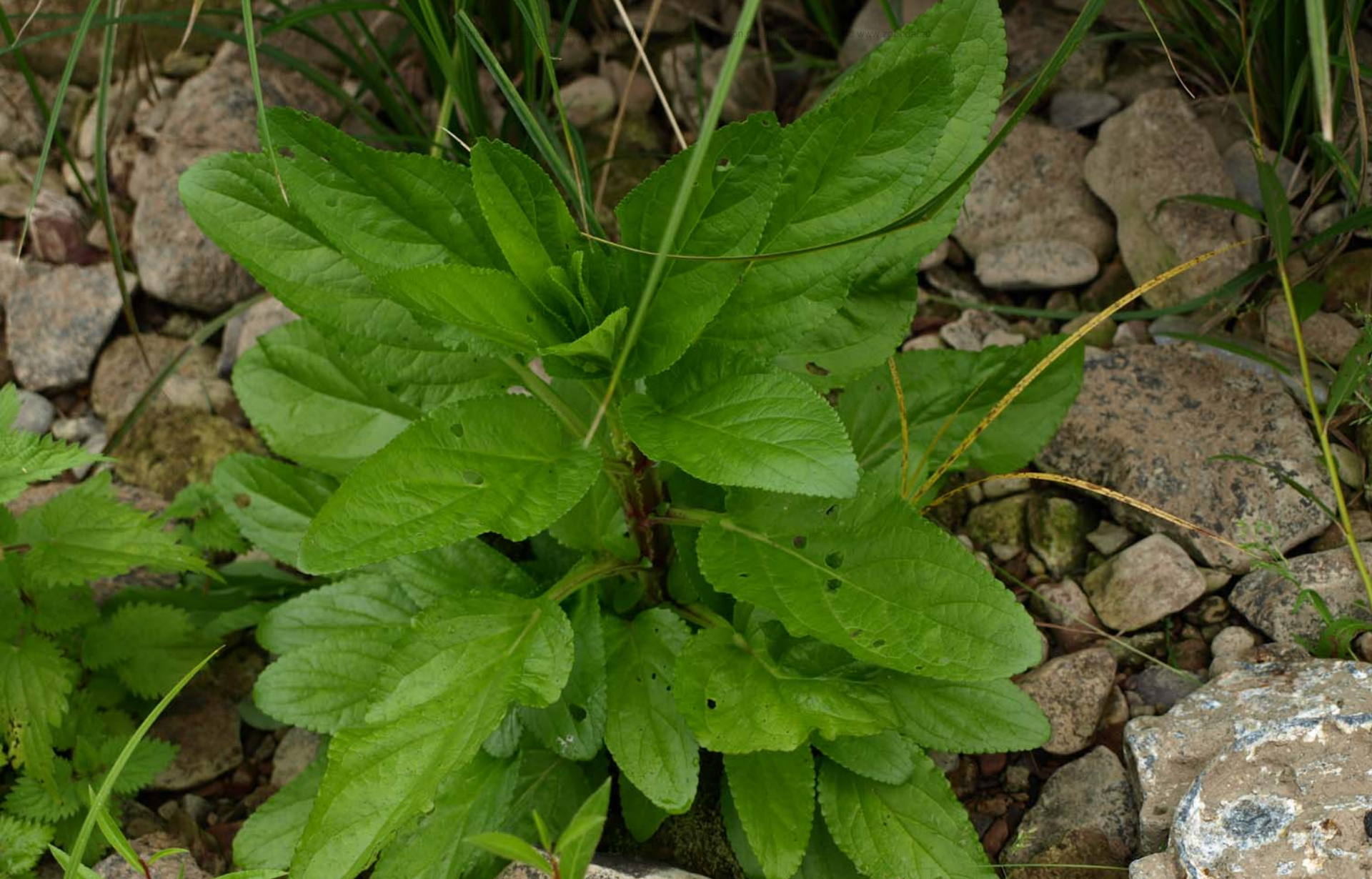
Scrophularia umbrosa (Geflügelte Braunwurz) eine typische Uferpflanze langsam fließender Gewässer