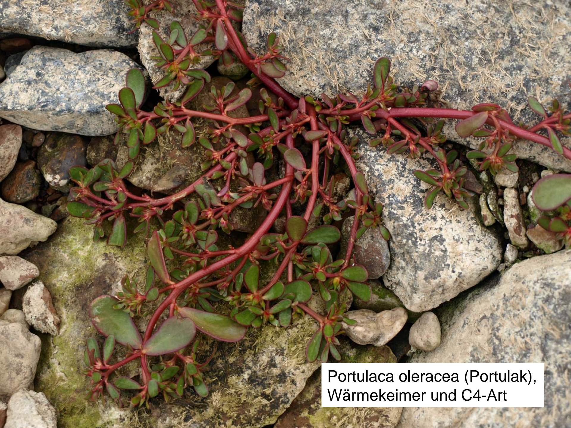
Portulaca oleracea (Portulak), Wärmekeimer und C4-Art