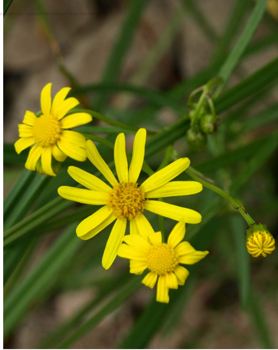
Senecio inaequidens (Schmalblättriges Greiskraut), ein Neophyt aus Südafrika, hat sich in den letzten Jahrzehnten entlang von Verkehrsanlagen rasant ausgebreitet und längst auch Flussufer erreicht.