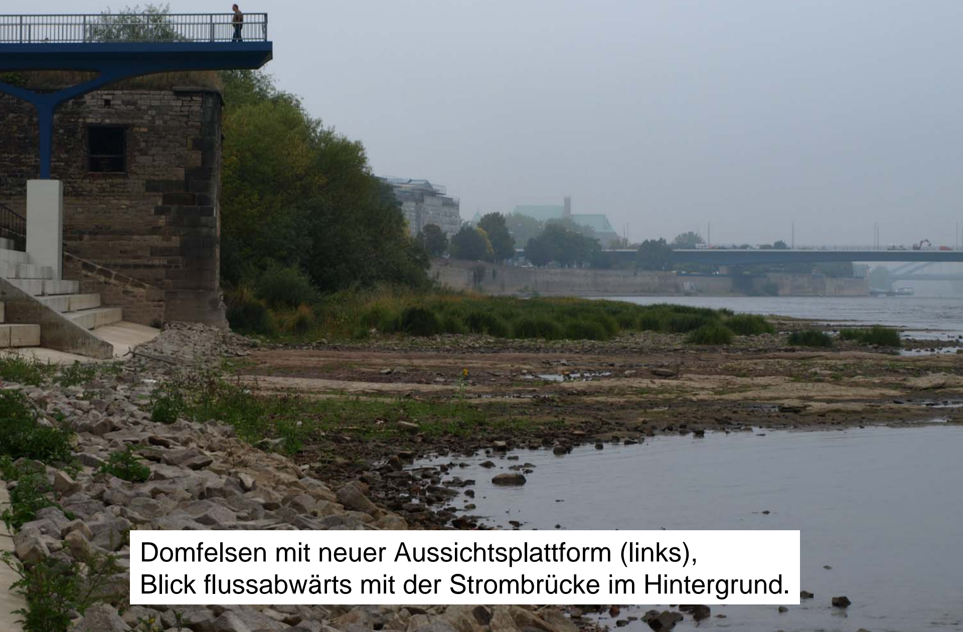
Domfelsen mit neuer Aussichtsplattform (links), Blick flussabwärts mit der Strombrücke im Hintergrund.