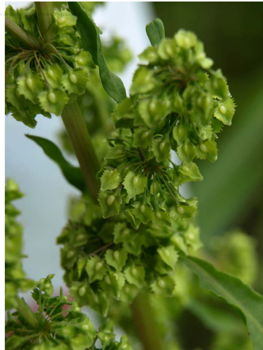
Rumex stenophyllus (Schmalblättriger Ampfer)