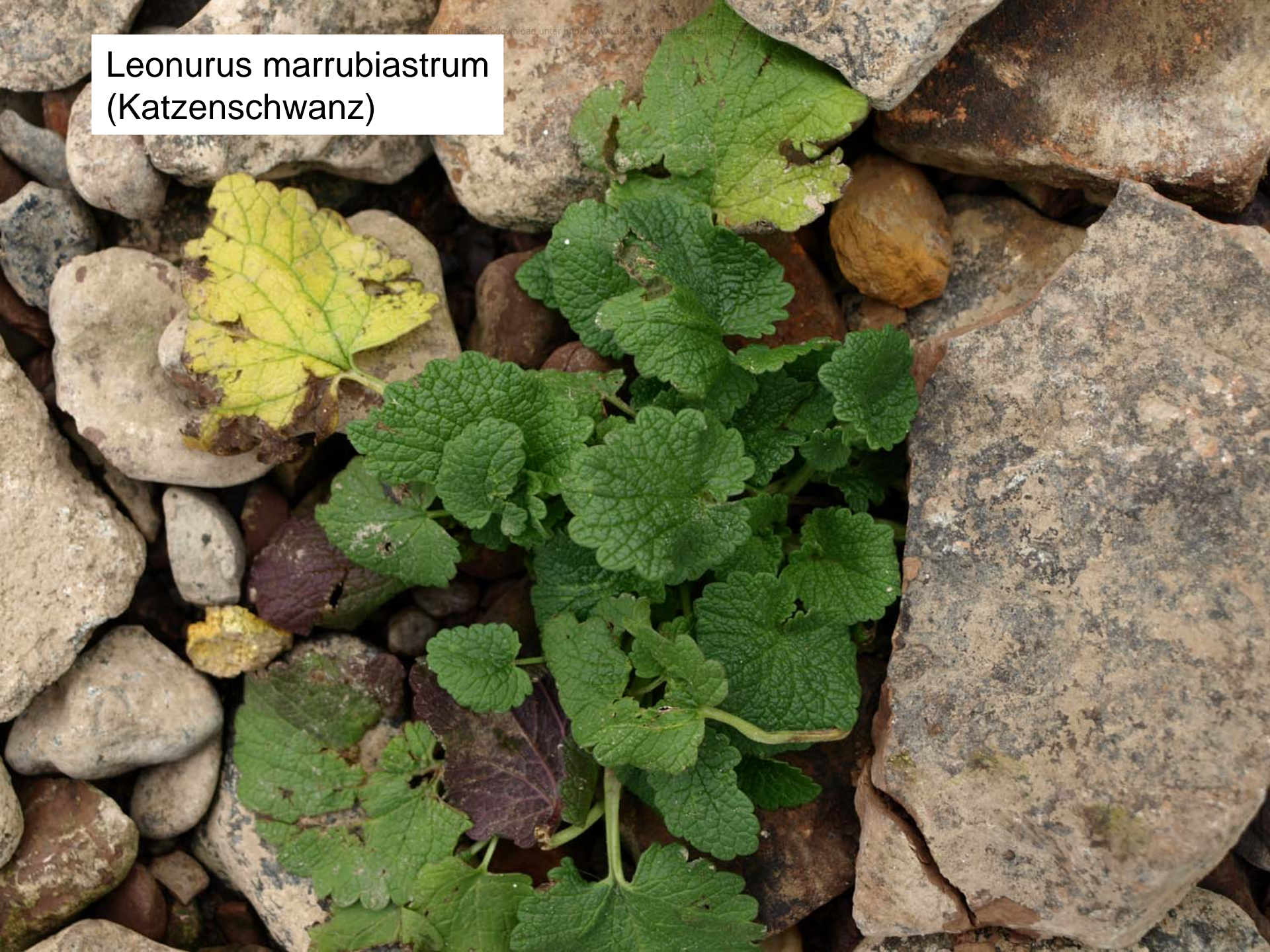
Leonurus marrubiastrum (Katzenschwanz)