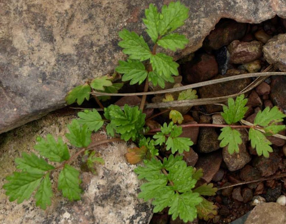
Potentilla supina (Niedriges Fingerkraut)