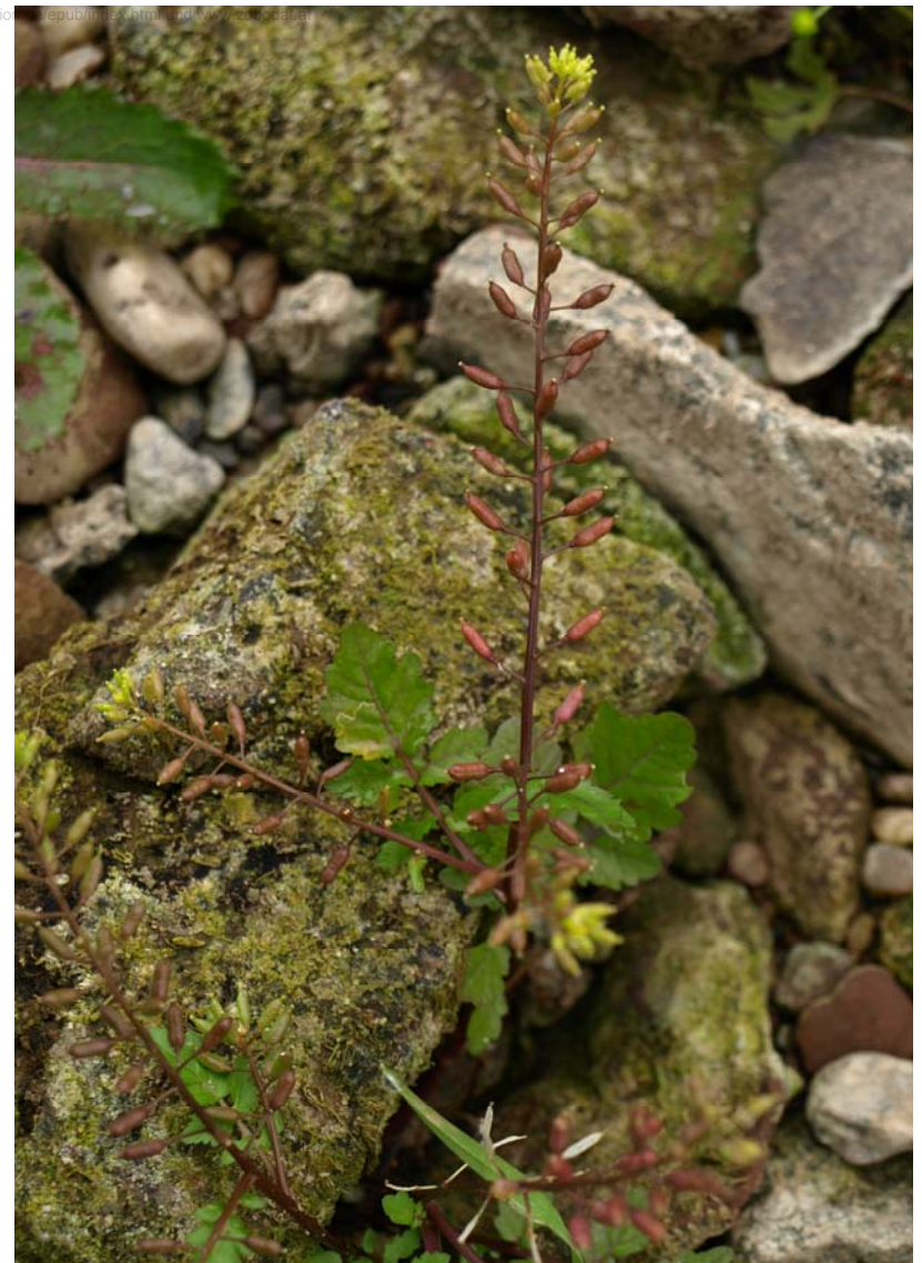
Chenopodium rubrum (links) und Rorippa palustris (rechts), zwei verbreitete Arten der Annuellenfluren an trockenfallenden Ufern.