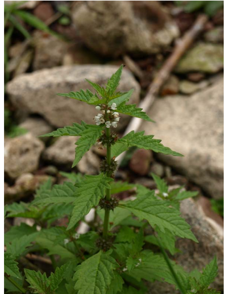
Lycopus europaeus (Ufer-Wolfstrapp)