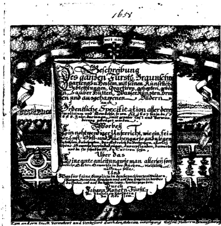
Abb. 3: Titelblatt von J. ROYER: Beschreibung des ganzen Fürstlich Braunschweigischen Gartens zu Hessem... 3. Aufl. 1658.

Dietmar Brandes (2010): Virtuelle botanisch-historische Exkursion zum Schloss Hessen am Fallstein. http://www.ruderal-vegetation.de/epub/hessen.pdf