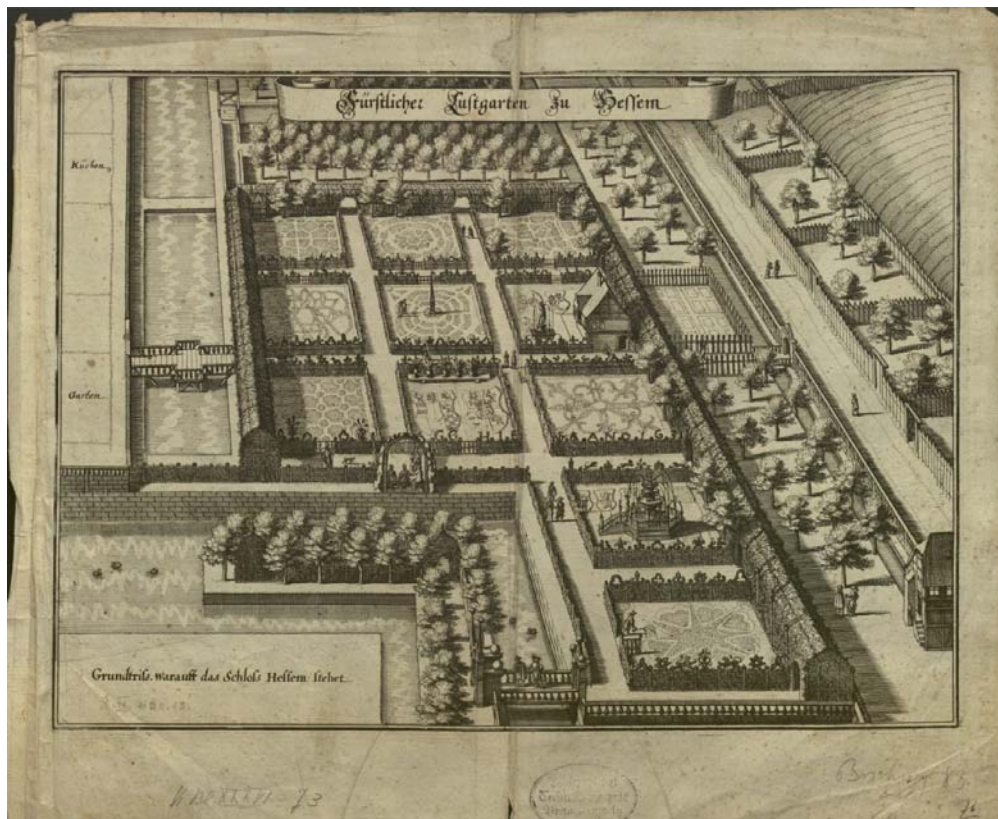
Abb. 2: Ansicht des Hessener Lustgartens von Süden (MERIAN 1654: Kupferstich nach einer Zeichnung von NORBERT BRANDT).