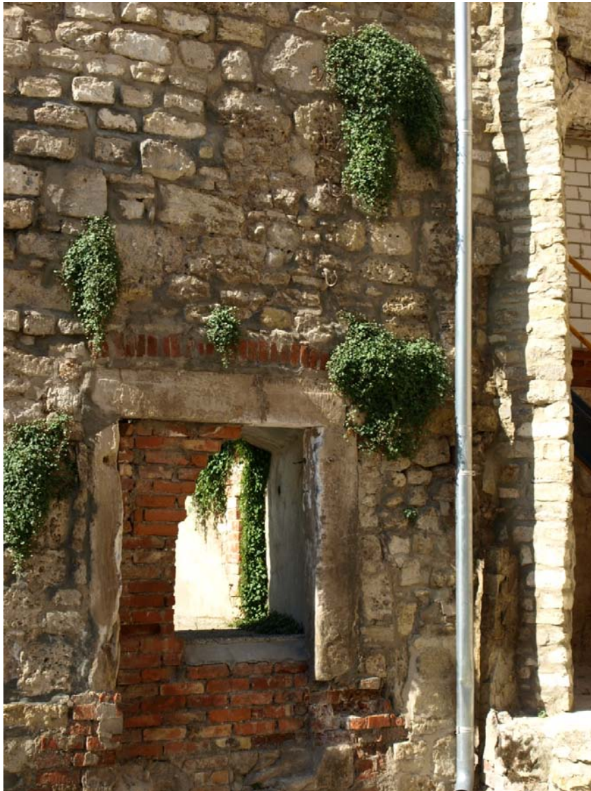
Abb. 8: Cymbalaria muralis in Ruinenbereichen der Oberburg (Juli 2010).