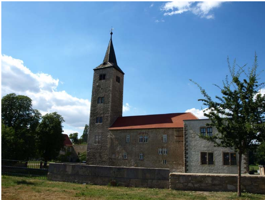
Abb. 5: Oberburg (Juli 2010).