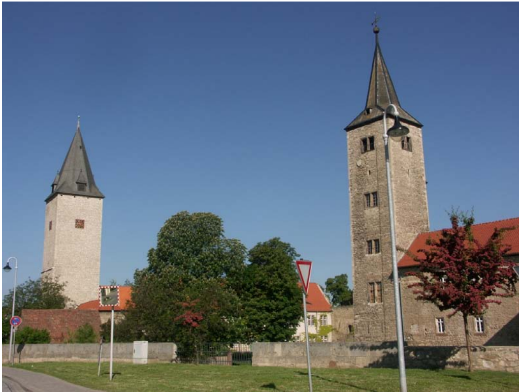
Abb. 4: Heutiger Zustand: links die Unterburg, rechts die Oberburg (Juni 2010).

Dietmar Brandes (2010): Virtuelle botanisch-historische Exkursion zum Schloss Hessen am Fallstein. http://www.ruderal-vegetation.de/epub/hessen.pdf