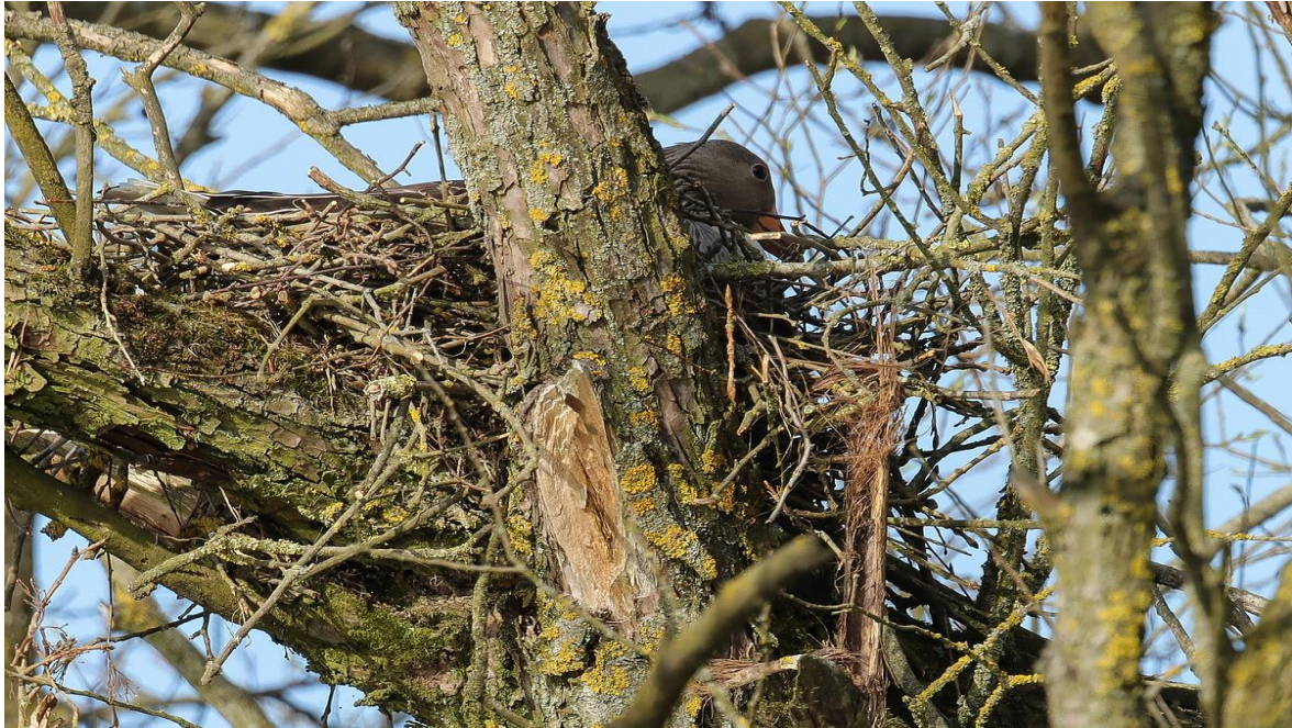
Bild 2: Ein gebrochener Ast, der sich in einer Astgabel verfangen hat, ergab die stabile Unterlage des Nestes. Die Gans brütet. Foto 05.April 2021, © Georg Stahlbauer