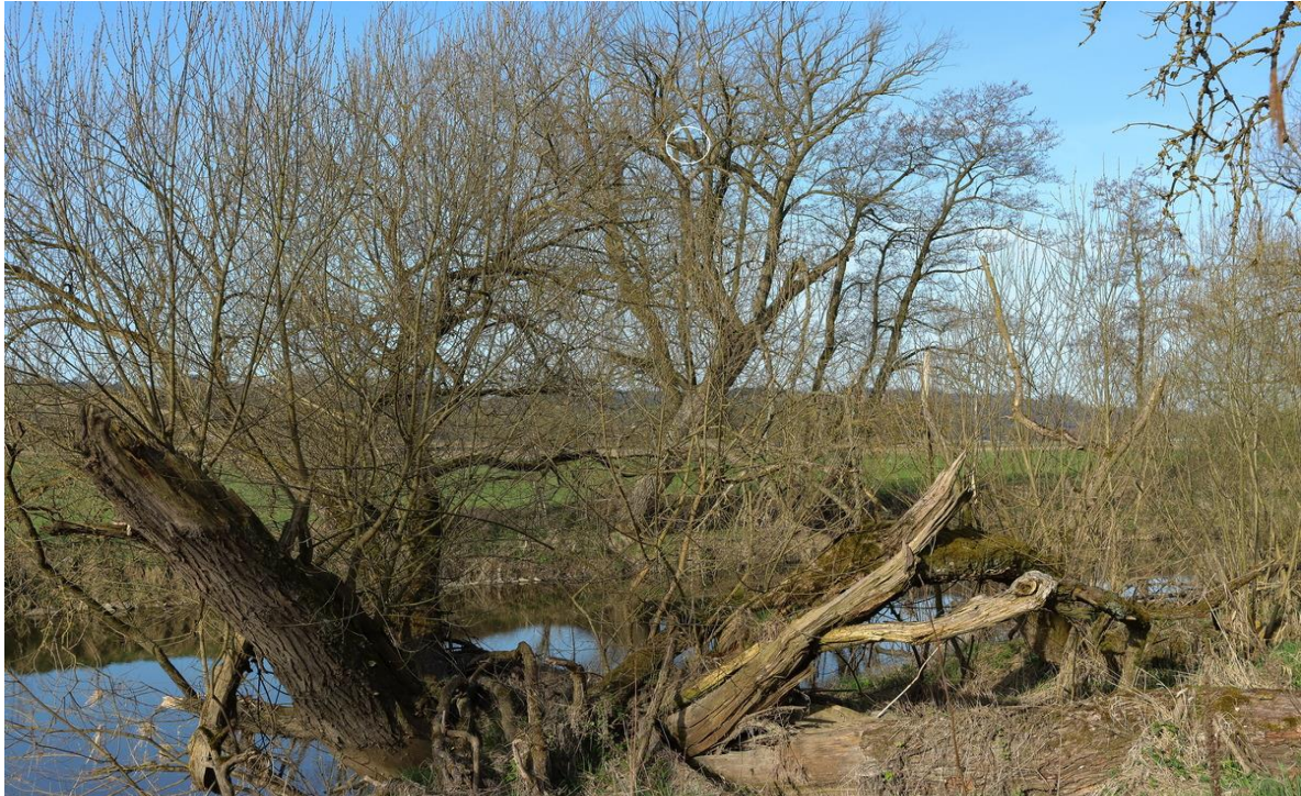
Bild 1: Der Kreis im Bild (oben Mitte) markiert die Lage des Nestes

Eine Graugans hatte sich hier ihren Brutplatz eingerichtet.