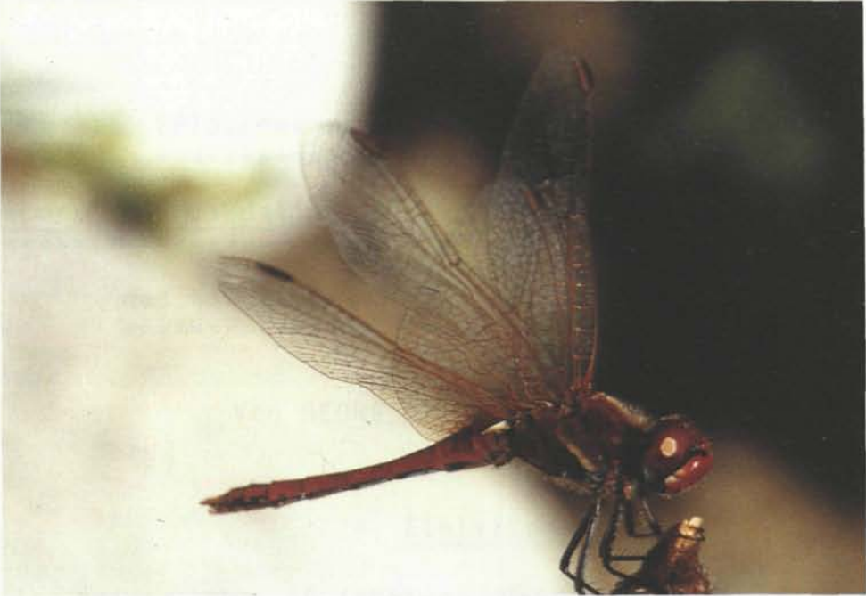
Frühe Heidelibelle ( Sympetrum fonscolombei ) (Bericht auf Seite 379 - 380)