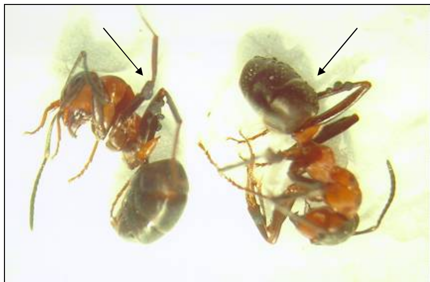
Formica polyctena, ca. 10-fache Vergrößerung.