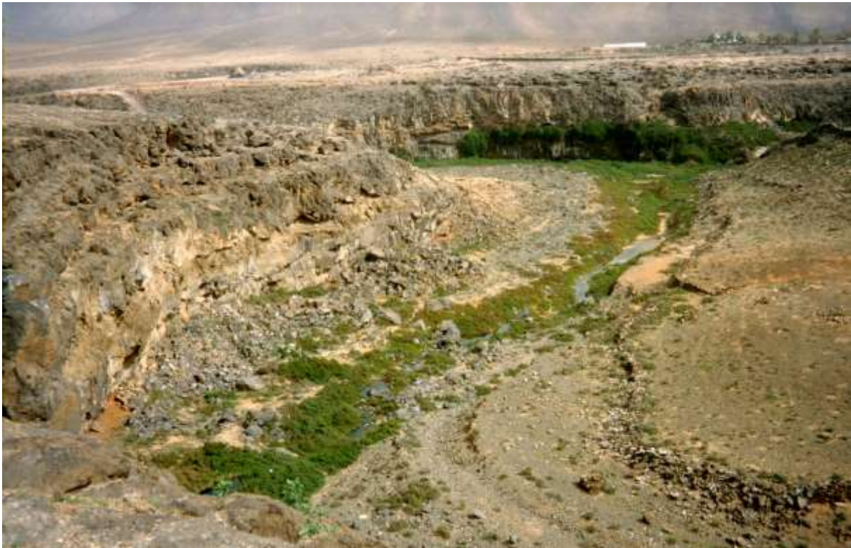
Abb. 1: Barranco de los Molinos (1998).