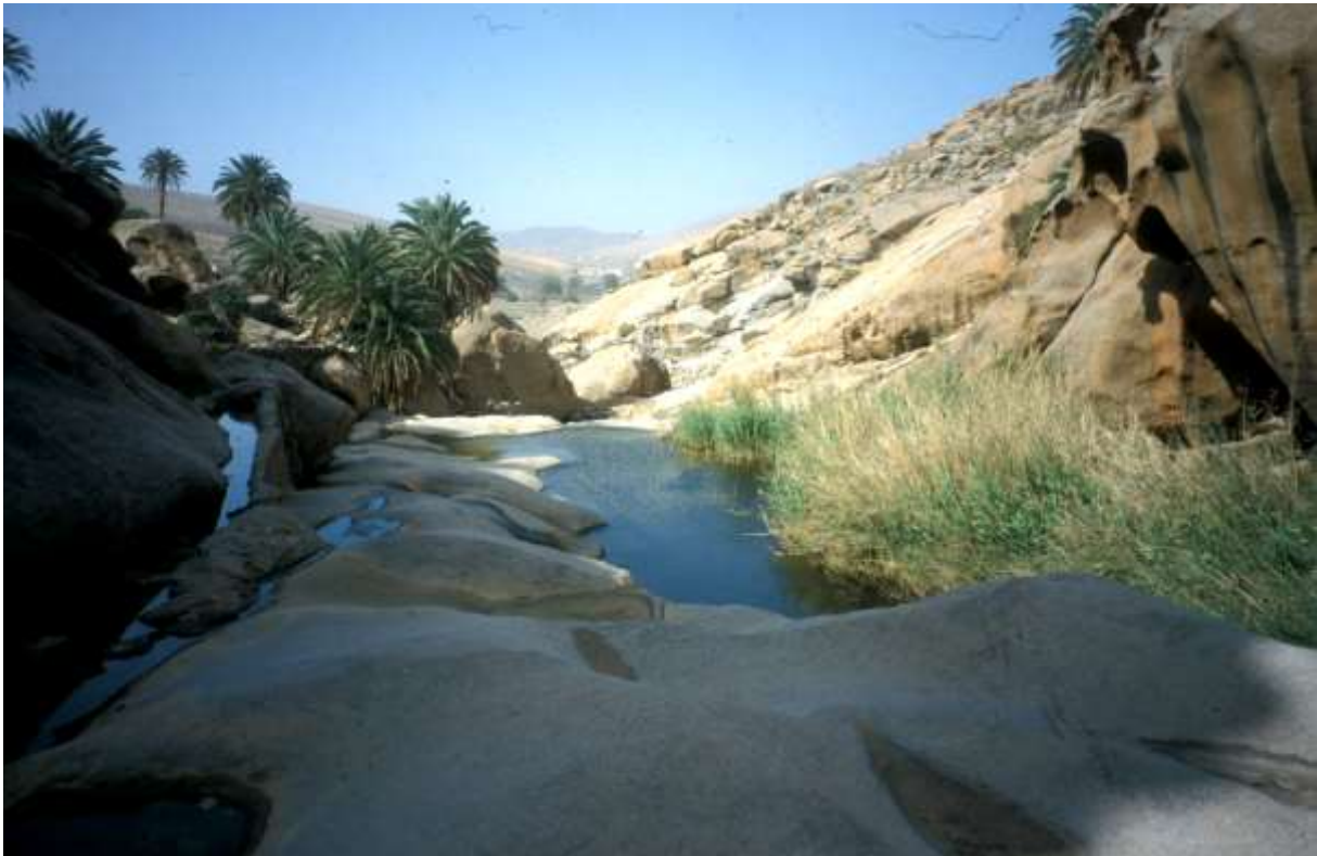
Barranco de Ajuy (1998).

Die mit einem Sternchen * gekennzeichneten Arten treten auch in den Abschnitten außerhalb der Ortschaften höchstens auf, zusätzlich Cenchrus ciliaris und Salsola vermiculata .