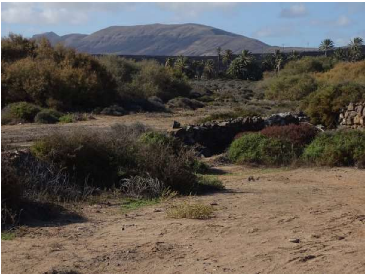
Barranco de la Torre (2018)

Die provisorische Verteilung der insgesamt gefundenen Arten auf pflanzensoziologische Klassen zeigt, dass die Klasse Stellarietea mit mindestens 125 Arten den wichtigsten Platz einnimmt. Weiterhin sind die Klassen Pegano-Salsoletea und Artemisietea zahlreich vertreten, so dass vermutlich mehr als die Hälfte der Arten, die zugeordnet werden konnten, im weitesten Sinn zur Ruderalvegetation gehören.