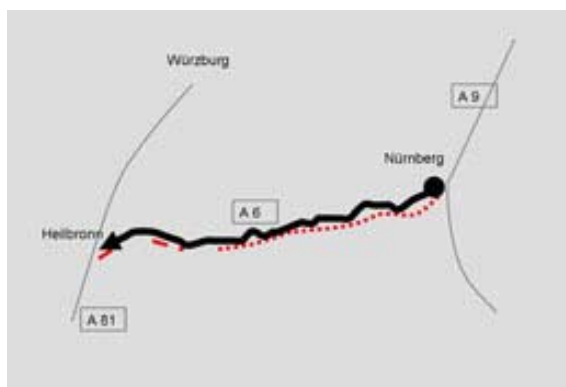
Abb. 4 (rechts): Beispielkartierung II. Senecio inaequidens am Mittelstreifen der Autobahn A 6 zwischen Nürnberg und Heilbronn. Balken neben der Straße: durchgezogener Balken: geschlossener linienförmiger Bestand; unterbrochen: vereinzelte Pflanzen; kein Balken: kein Senecio gesehen.

Das zweite Beispiel zeigt, dass geeignete Objekte noch schnellere Kartierungen zulassen können. Es betrifft Senecio inaequidens , eine Art, die wohl ein besonders gutes Beispiel für die „fahrende Kartierung“ darstellt, da sie sich innerhalb weniger Jahrzehnte in Mitteleuropa von Westen aus sehr auffällig ausgebreitet hat (HEGER &