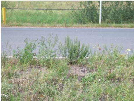
Abb. 1 (links): Ambrosia artemisiifolia am Straßenrand südlich Ogrosen, Niederlausitz, 23.9.07.

die gesamte Region in wenigen Tagen erstellen ließe. Der Detaillierungsgrad andererseits ist zumindest ausreichend für Fragestellungen, etwa die Populationsentwicklung über mehrere Jahre oder auch die Ausbreitung im Landschaftsmaßstab betreffend.