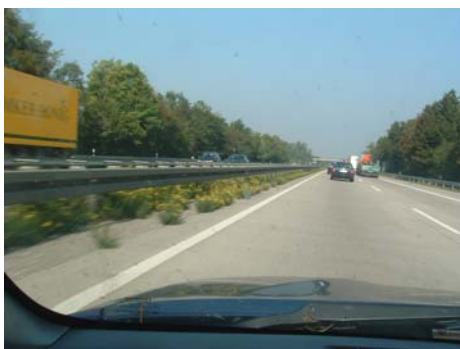
Abb. 3 (links): Senecio inaequidens an der Autobahn A 5 südlich Karlsruhe am 11.10.2005. Der Habitus macht die Pflanze auch bei hoher Geschwindigkeit gut erkennbar, insbesondere anhand der charakteristischen Blütenfarbe.

Abb. 4 (rechts): Beispielkartierung II. Senecio inaequidens am Mittelstreifen der Autobahn A 6 zwischen Nürnberg und Heilbronn. Balken neben der Straße: durchgezogener Balken: geschlossener linienförmiger Bestand; unterbrochen: vereinzelte Pflanzen; kein Balken: kein Senecio gesehen.