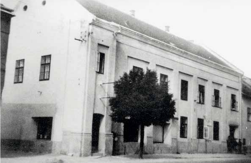
Das Gebäude des ehemaligen Paulinerklosters in Neusiedl am See um 1950.