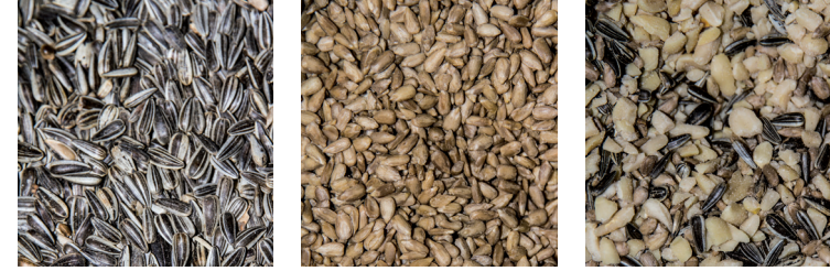
oben: Thomas Ranner (1 - 3); unten: Wolfgang Trimmel (1 - 3)