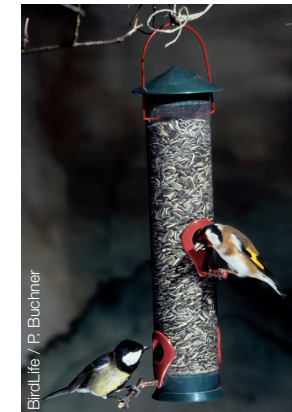
BirdLife / P. Buchner

Herausgeber: Amt der Bgld. Landesregierung, HR Natur- und Umweltschutz; Redaktion und Text: Andreas Ranner; Fotos: BirdLife/Peter Buchner, Leander Khil, Andreas Ranner, Thomas Ranner, Wolfgang Schweighofer, Wolfgang Trimmel; Grafik und Produktion: www.schreibmeister.info Eisenstadt, Dezember 2015