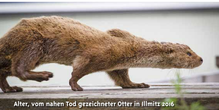
Alter, vom nahen Tod gezeichneter Otter in Illmitz 2016

Der Otterbestand wird durch das Nahrungsangebot und seine Territorialität begrenzt.