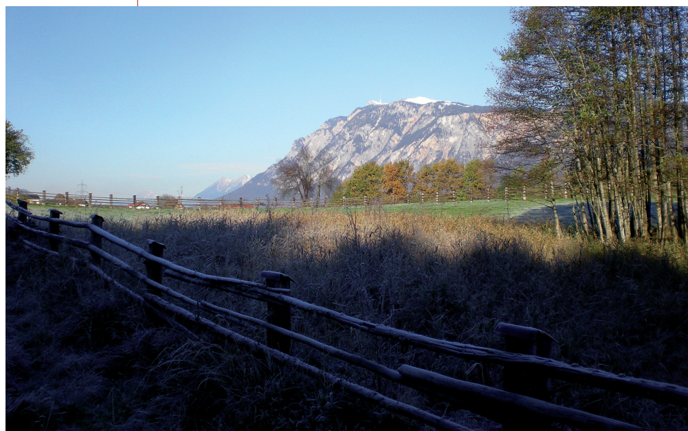
Abb. 157: Blick von der Karawanken-Schattseite auf die Schütter Sonnseite/den Dobratsch.

Die Schütt ist – sonnenteknisch gesehen – eindeutig die Sonnseite des Unteren Gailtales. Dies wird vor allem in den Wintermonaten sichtbar, wenn sich die Silhouette der gegenüberliegenden Karawanken als dunkles Abbild bis weit in die Talmitte legt. Doch pünktlich zur Wintersonnenwende verschafft sich das Licht wieder mehr Raum und drängt den Schatten – sehr zur Freude der südseitigen Talbewohner – weit in Richtung der Karawanken zurück. Täglich und ohne Ausnahme wird die Grenzziehung zwischen Licht und Schatten neu definiert, halbjährlich ändern sich die Erfolgsaussichten für beide Teile grundlegend. Sonne und Schatten, das kann hell und dunkel,