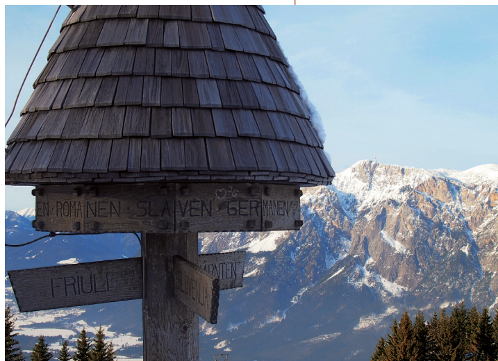
Abb. 158: Blick vom Dreiländereck, Schnittpunkt der drei großen europäischen Kulturen, auf die gegenüberliegende Schütt- seite des Tales mit dem Dobratsch.

Befragt man heute, rund 660 Jahre danach, einen Wissenschaftler über die Schütt, so sind Begeisterungstürme nicht ganz ausgeschlossen. Wie Hans Bach in JUNGMEIER & SCHNEIDERGRUBER (1998) zitiert, bezeichnete er die Schütt bereits 1963 als „... Naturschöpfung, wie sie in diesem grandiosen Ausmaß in Mitteleuropa kaum ein zweites Mal anzutreffen ist“. Viele sehen in der Schütt ein herausragendes, einzigartiges Stück Natur, das seine Entstehung dem Schnittpunkt großer tektonischer Platten (Periadriatische Naht) und klimatischer Einflussregionen verdankt. Die einst zerstörerische Kraft der Natur kann also – oft zeitversetzt – auch als eine zutiefst schöpferische Quelle für „Naturveredelungen“ mit anschließender menschlicher Bewunderung gesehen werden.