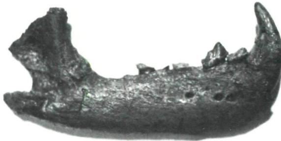
Abb. 2: Potamotherium miocenicum (PETERS, 1868) Mandibel dext. von außen

In der Steiermark (Funde von Feistritz bei Eibiswald, Wies, Kalkgrub bei Steieregg, Voitsberg u. a.) ist Potamotherium nur aus dem Eggenburgien bis Karpatien (= Burdigal bis Helvet) bekannt.