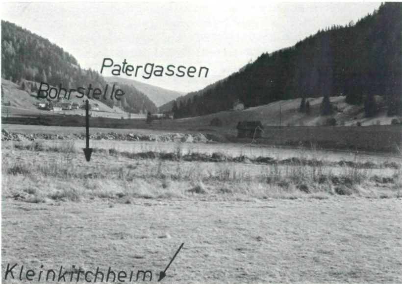
Abb. 1: Das Niedermoor bei Bad Kleinkirchheim.