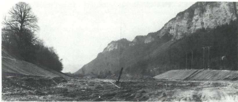
Abb. 3: 6. April 1979 Fundstelle des Edelkastanienstammes am Nordscheitel der Linsendorfer Halbinsel. Der eigentliche Fundpunkt lag etwa in der Mitte des Bildes (→) in jungen Draukiesen in ungefähr 3,5 m Tiefe unter GOK. Blick gegen W; im Hintergrund die aus Sattnitzkonglomerat bestehenden Südabstürze des Sattnitzhöhenzuges, links die Steilkante der höheren Terrasse.

Von dem geborgenen, etwa 7,5–8 m langen Stamm, an welchem noch der Wurzelstock vorhanden war, wurden vom Landesmuseum für Kärnten am 6. April 1979 routinemäßig Holzproben genommen (Abb. 4). Die von G. H. LEUTE durchgeführte holzanatomische Bestimmung ergab überraschend Castanea sativa MILL., also Edelkastanie. Da dieser Baum in Kärnten erst ab dem 19. Jahrhundert in größerem Ausmaß kultiviert bekannt ist (wobei es schon damals einige ältere Bäume gab), wurde eine absolute Altersbestimmung des Holzes angestrebt, weil der Stamm zwar sehr frisch aussah und sich beim Abschneiden der Proben als recht hart erwies, aber dennoch äußerlich eine mm-dünne, braunschwarz inkohlte Schichte aufwies. Die vom Landesmuseum in Auftrag gegebene ^{14}\text{C} -Datierung wurde innerhalb weniger Monate am Institut für Radiumforschung und Kernphysik der Österreichischen Akademie der Wissenschaften durch H. FELBER durchgeführt, wobei die Bestimmung der Probe Linsendorf III (VRI – 667) das überraschende Alter von 2530 \pm 100 Jahren, bezogen auf 1950, ergab. Die Folgerungen daraus sind sowohl für die jüngste Talgeschichte als auch für die Vegetationsgeschichte des Landes bedeutsam (siehe folgenden Abschnitt).