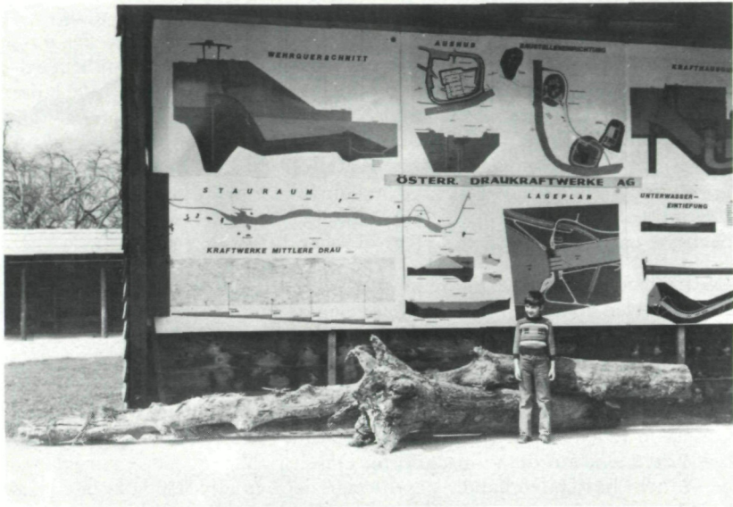
Abb. 4: Foto: F. H. UČIK, 6. April 1979 Der in zwei Teile zerschnittene Stamm der Edelkastanie nach seiner Bergung vor der Schauwand in der Bausiedlung in Linsendorf. Länge der beiden Teile: etwa 2,20 bzw. 5,50 m.