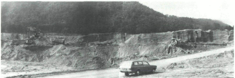
Abb. 1: Foto: F. H. UČIK, 14. Juli 1978 Ansicht der Fundstelle des Lärchenstammes ( \rightarrow 1) und des Kohlenflözes ( \rightarrow \leftarrow 2) am Ostende des Linsendorfer Durchstiches. Bei Punkt 3 wurden Pollenproben sowie die Kohle für Altersdatierung und holzanatomische Untersuchung entnommen; der Lärchenstamm lag etwa 4 m tiefer (405 m Seehöhe). Das Kohlenflöz war vom Punkt 3 etwa bis zum Bagger am linken Bildrand zu beobachten (Längenerstreckung mindestens etwa 60–80 m). Im Hintergrund oberhalb des Kohlenflözes sind die horizontal geschichteten älteren Drauterrassenschotter zu erkennen. Blickrichtung etwa gegen WSW.

Der Baumstamm (Fundpunkt 1) wurde am Ostende des Durchstiches etwa in der Durchstichmitte in 405 m Seehöhe gefunden, und zwar in Kiesen innerhalb des Feinsand-Schluff-Komplexes, etwa 17 m unterhalb der früheren Geländeoberfläche. Rund 4 m höher, also in etwa 409 m Seehöhe, wurde bei den Aushubarbeiten in den Feinkornsedimenten ein ganz dünnes (etwa 1–3 cm starkes) Kohlenflözchen aus zusammengeschwemmten Holzresten freigelegt, aus dessen Liegendem die Pollenproben entnommen wurden (Abb. 1 und 2). Diese Stelle liegt also topogra-