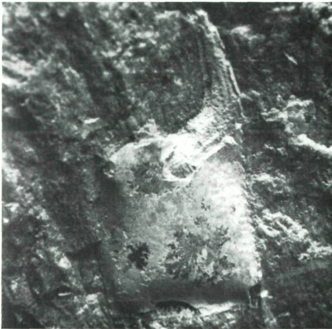
Abb. 3: Vorderstes linkes Scherenglied eines Maulwurfskrebsses der Gattung Callianassa aus dem Nummulitenkalk. Länge 26 mm. Sammlung: Prof. V. VAVROVSKY

In diesem Zusammenhang ein paar wichtige Hinweise für Sammler: Wegen verschiedener unliebsamer Vorfälle sieht sich die Werksleitung veranlaßt, den Besuch ihrer Steinbrüche nur mit besonderer Genehmigung zu gestatten. Vor dem Betreten der Brüche muß sich also jeder Sammler unbedingt bei der Betriebsleitung melden und sich diese Genehmigung holen. Sie