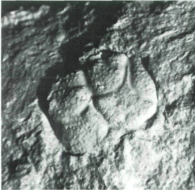
Abb. 1: Rückenpanzer von Titanocarcinus cf. raulinianus MILNE-EDWARDS aus dem Nummulitenkalk (Kalksteinbruch der Wietersdorfer Zementwerke). Breite des sichtbaren Panzers: 25 mm.

Im Sommer des Jahres 1980 hatte ich den Auftrag, eine Gruppe von Mineralien- und Fossiliensammlern aus der Gegend von Göttingen in die Wietersdorfer Steinbrüche zu führen. Eine der Teilnehmerinnen übergab mir im Kalksteinbruch ein ungewöhnlich aussehendes Fundstück zur Bestimmung. Leider konnte ich in diesem Falle keine Auskunft geben, weil ich derartiges in diesem Gestein noch nie gesehen hatte. Die leicht körnige Struktur der wenige Quadratzentimeter großen Fläche, die da aus dem Stein herausschaute, ließ zwar vermuten, daß es sich um den Rest eines Krabstieres handelt. Da aber solche Funde bisher nicht bekannt waren, war ich mir keinesfalls sicher. Die Dame überließ mir deshalb freundlicherweise das Fundstück, damit es einer genaueren Bestimmung durch einen Fachmann zugeführt werden könne. In einer deutschen Zeitschrift („Mineralien-Magazin“, Stuttgart) hatte ich einmal einen Artikel über Minerale und Fossilien unseres Gebietes geschrieben und auch das Bild einer in den kreidezeitlichen Kalken des Bruches III in Wietersdorf gefundenen Krab-