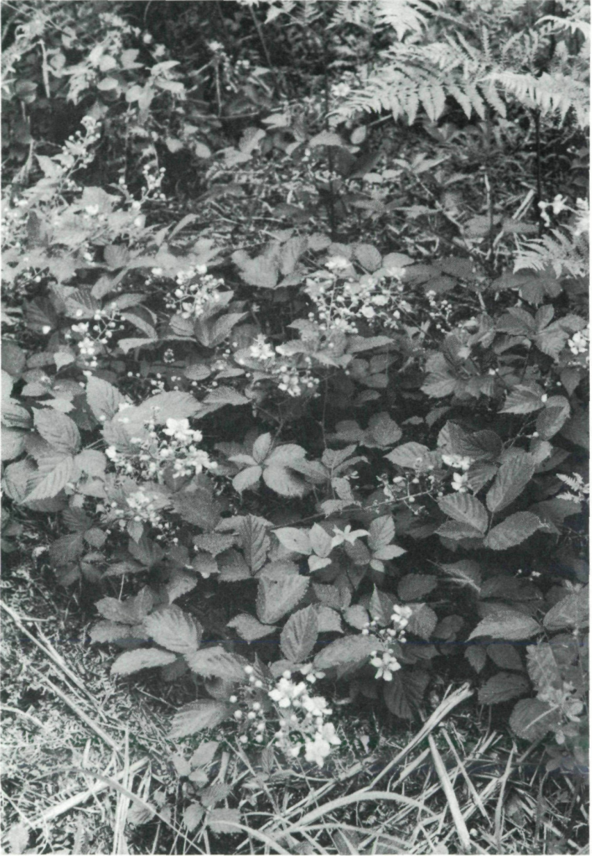
Abb. 3: Waldsaum-Vergesellschaftung mit Rubus juennensis LEUTE & MAURER. Herkunft: Typus-Lokalität.