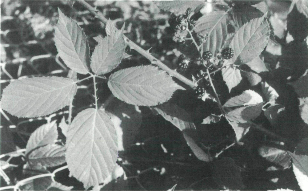
Abb. 4: Fruchtendes Exemplar von Rubus juennensis LEUTE & MAURER in einem Grazer Garten. Kultiviert aus Samen der Umgebung von Rückersdorf in Kärnten.

Rubus juennensis fällt insbesondere durch die großen, kräftig rosenroten Blüten und durch die länglich-verkehrt eiförmigen Schöblingsendblättchen auf. Er unterscheidet sich von Rubus villicaulis KOEHLER ex WEIHE & NEES vor allem durch den nur zerstreut behaarten Schöbbling und die länglich-verkehrt eiförmigen Schöblingsendblättchen sowie durch die geraden dünnen Stacheln im Blütenstand und die Farbe der Blüten; von dem aus Frankreich beschriebenen Rubus macrophyloides GENEVIER durch breitere Schöblingsendblättchen, größeren Blütenstand und behaarte Fruchtknoten.