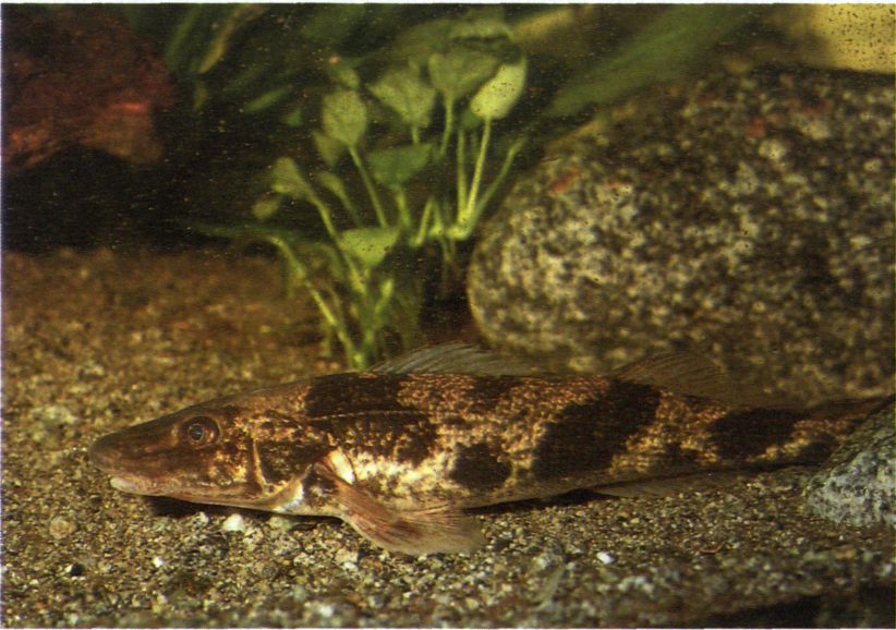
Abb. 1: Zingel ( Zingel zingel L.)

Fast drehrunder Körper; dünner Schwanzstiel, kürzer als der Ansatz der 2. Rückenflosse. Kiemendeckel am Hinterrand mit starkem Dorn; kleine Kammschuppen, 82–95 in einer Längsreihe. Zwei weit getrennte Rückenflossen, die erste mit 11–14 Stachelstrahlen, die zweite mit 1–2 Stachelstrahlen und 16–18 Gliederstrahlen. 6–7 unregelmäßige, verwachsene, dunkle Querbinden. Die Schwimmblase ist völlig rückgebildet; mittlere Länge: 20–30 cm (Abb. 1).