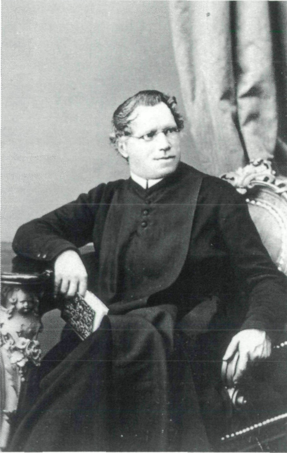
Abb. 1: Meinrad THAURER von GALLENSTEIN (1811–1872) im Ornat des Benediktinerordens.

Zusammenziehung zu stark, so hätten wir fast keinen andern Ausweg, als alle solche an Einem und demselben Orte beisammen stehende Formen, als lauter selbstständige, gute Arten anzusehen, was vielleicht noch gewagter seyn dürfte“ GALLENSTEIN (1852:116). In derselben Publikation erfährt man auch, wie beschwerlich man damals Bivalven sammeln mußte; es gab ja im 19. Jahrhundert noch keinerlei Möglichkeit, die Welt unter Wasser, beispielsweise mit einer Tauchausrüstung, zu erforschen. „Zum Sammeln der Muscheln bediene ich mich eines Rechens aus starkem Eisenblech, mit etwa 5 bis 6 breiten Zähnen; derselbe ist