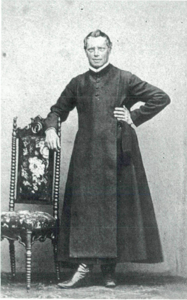
Abb. 3: Meinrad THAURER VON GALLENSTEIN (1811–1872).

geführt. In jedem Fall aber muß man ihn als den Pionier faunistischer Tätigkeit in Kärnten ansehen.