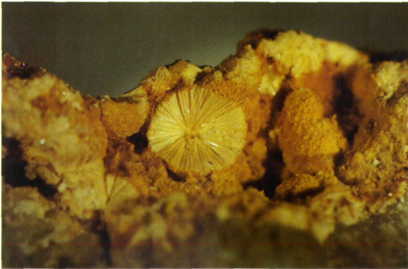
Abb. 4: Oxidationsprodukt in der Arsenopyrit-Paragenese; Durchmesser des offenen Aggregats: 3 mm.

Abschließend zu einigen Mineralarten, die nicht zur Arsenopyrit-Paragenese gehören, die aber im Gangquarz vorkommen: Einzelne Rutil sind darin eingewachsen und in Klüften aus metallglänzenden nadeligen Kristallen Sagenitgitter entstanden. – Schwarze, fettglänzende Blättchen im Quarz sind laut Röntgenbefund Graphit. – In Quarzklüftchen kam es zur Ausscheidung von milchigen Quarz- und klaren Bergkristallen. – Der Calcit in den Zwickeln des Quarzes ist durch Schwefelsäureeinwirkung stark angelöst. – Erwähnenswert sind noch Gruppen