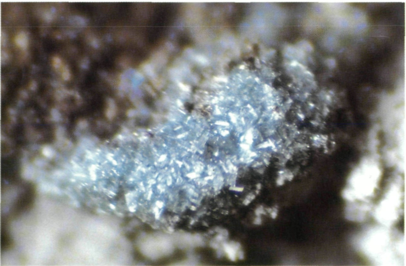
Abb. 2: Ansammlung von Parasymphesit auf Arsenopyrit-Resten; Größe ~ 4 mm.

In Arsenopyrit-Höhlungen sind unzählige himmelblaue Parasymphesite – das ist eine neue Färbung für dieses Mineral – ungeordnet angehäuft. Sie sehen langtafeligen Gips-xx ähnlich. Die ebenfalls bis zu 2 Millimeter großen Kristalle glänzen glasig auf den Prismenflächen, und an den Kristallenden zeichnet sich deutlich die monokline Symmetrie ab. Aus winzigen Nadeln zusammengesetzte Schichten (Spaltenfüllungen) wirken schaumig und schimmern seidig (Abb. 2). Die Arsenopyrite befin-