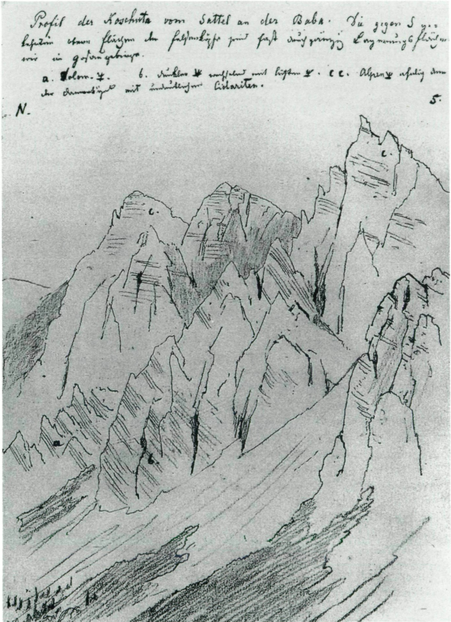
Abb. 4: Bleistiftskizze von SIMONY, aus dem Tagebuch SIMONY (Zentralarchiv des Naturhistorischen Museums, Nr. 1755, 1848)