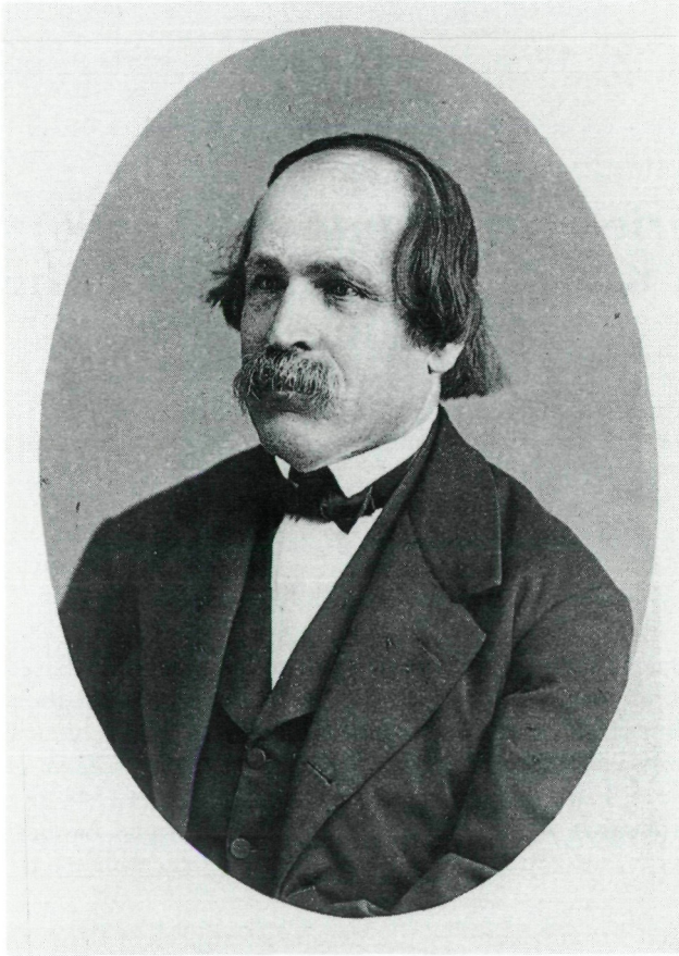
Abb. 1: Friedrich SIMONY

Landesgouverneur Illyriens ernannt worden war, setzte er sich sonach in Laibach für ein Museum ein, was ihm tatsächlich auch gelingen sollte, während das Klagenfurter Museumsprojekt aufgeschoben blieb.