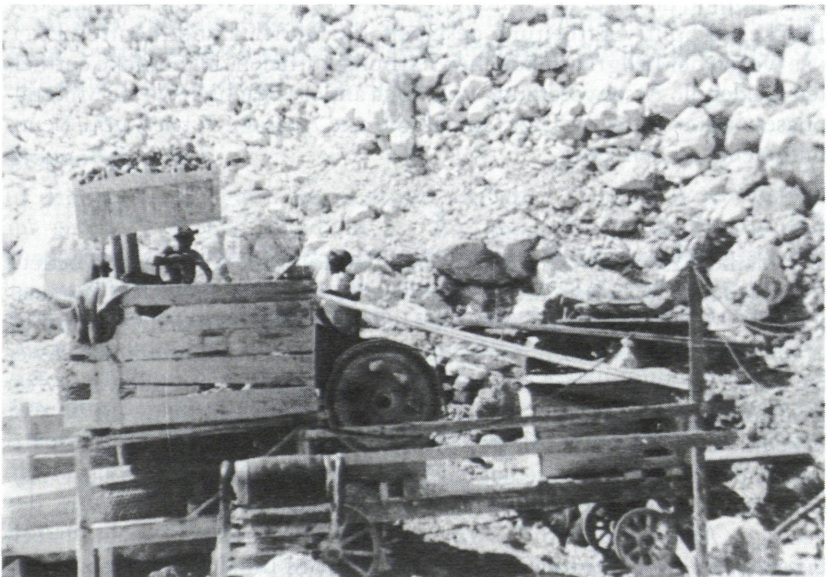
Abb. 4: Fahrer Steinbrecher mit Elektroantrieb, aufgenommen anno 1960.