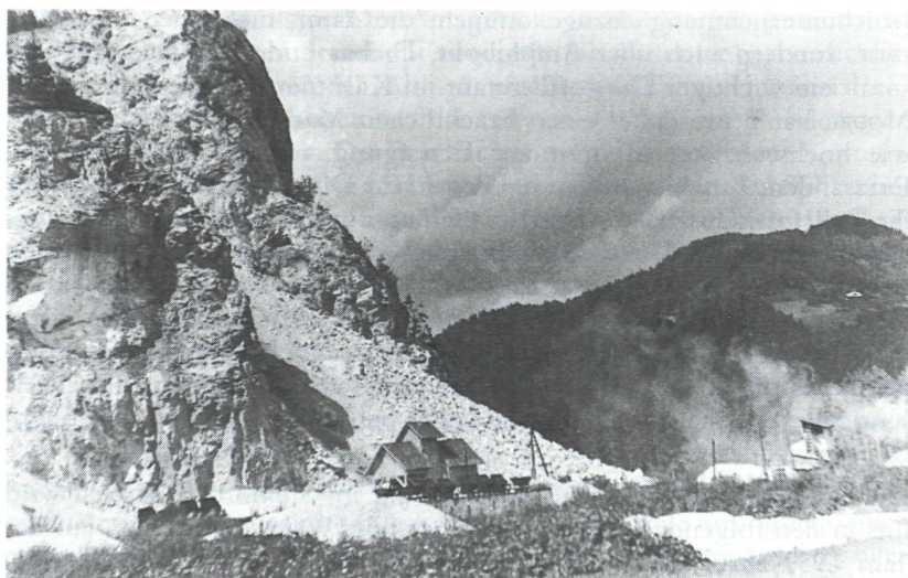
Abb. 2: Steinbruch Bergstein-Drögnersfels, Aufnahme um 1959.