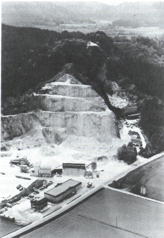
Abb. 3: Terrassenförmiger Abbau im Steinbruch Bergstein-Dragoner- fels, Stand 1991.

Die bauliche und technische Entwicklung im Steinbruchsbereich wird uns in den folgenden Abbildungen bewußt: Während die alte, auf das Jahr 1959 zurückgehende Aufnahme den Bruch mit dem Betriebsgebäude und die starke Staubentwicklung wiedergibt (Abb. 2), zeigt die Abb. 3 den stufenförmigen Abbau des Dragonerfelsens und die neue