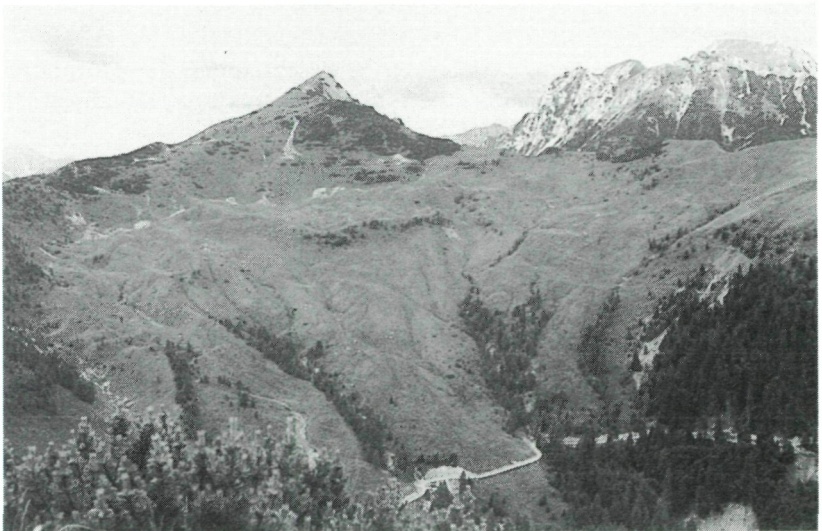
Abb. 2: Übersichtsaufnahme der Roschitzalm, Blick von Osten. Man erkennt deutlich die steileren Flanken und die davon gut abgrenzbaren Lockermassen, die weite Teile der Alm einnehmen. Die Bergspitze im Hintergrund ist der Frauenkogel, rechts davon ist der Mittagkogel zu erkennen.