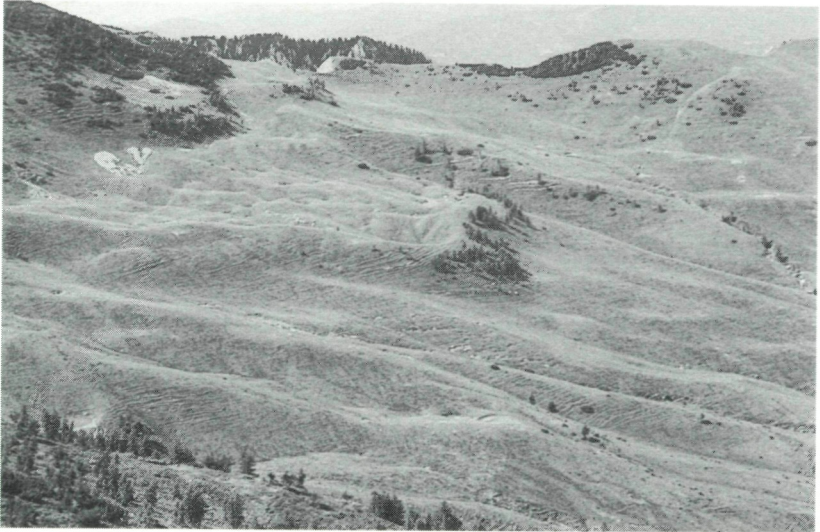
Abb. 3: Blick von Süden auf die Endmoräne.

Der gesamte Bereich des flachen Almbodens der Roschitza wird von Lockermaterial eingenommen, das bis zu 15 m mächtig wird. Diese Schuttmassen sind von den umgebenden steileren Flanken gut abzugrenzen (Abb. 2). Das Lockermaterial besteht ausschließlich aus ungerundeten Kalkkomponenten.