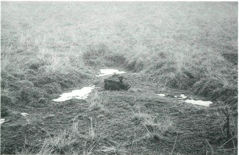
Abb. 7: Zerrungsstrukturen in der Bodenkrume, die durch gravitative Massenbewegungen entstehen. Sie zeigen mit der konkaven Seite hangabwärts.