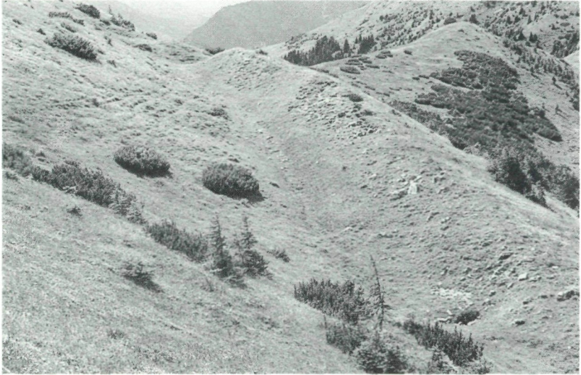
Abb. 6: Doppelgratbildung im Südteil der Roschitza im Bereich des Rosenkogels.

Während des Abschmelzvorganges sind dann große Gesteinsmassen von den steilen Flanken der Alm (sie waren zur letzten Eiszeit vegetationsfrei) auf den Eiskörper gelangt. Dieser wurde unter Lockermaterial begraben. Als dann diese verschütteten Eismassen geschmolzen sind, sackte das darüberliegende Lockermaterial trichterförmig ein und hinterließ Toteislöcher.