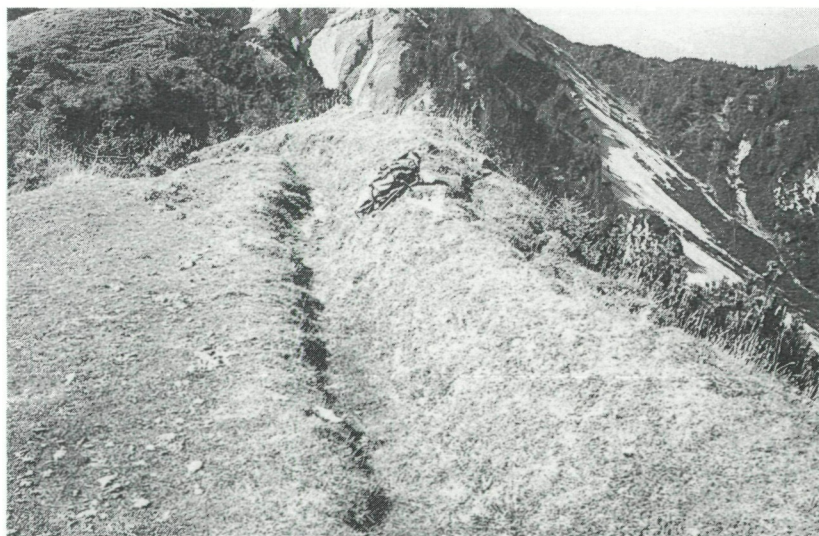
Abb. 5: Doppelgratbildung im Nordwestteil der Roschitzaalm. Die steilen Felswände rechts gehören zur Schwalbenwand.

Der Verfasser vermutet, daß die gesamte Roschitzaalm während der letzten Eiszeit vergletschert war. Nach Abschmelzen dieser großen Eismassen dürfte es zu einem neuerlichen Vorstoß des verbliebenen Gletschers gekommen sein. Dieser erneute Vorstoß des Eises hat im Zuge seiner hangabwärtsgerichteten Fließrichtung den halbkreisförmigen Wall aufgeworfen. Dieser Wall ist somit als Endmoräne zu interpretieren.