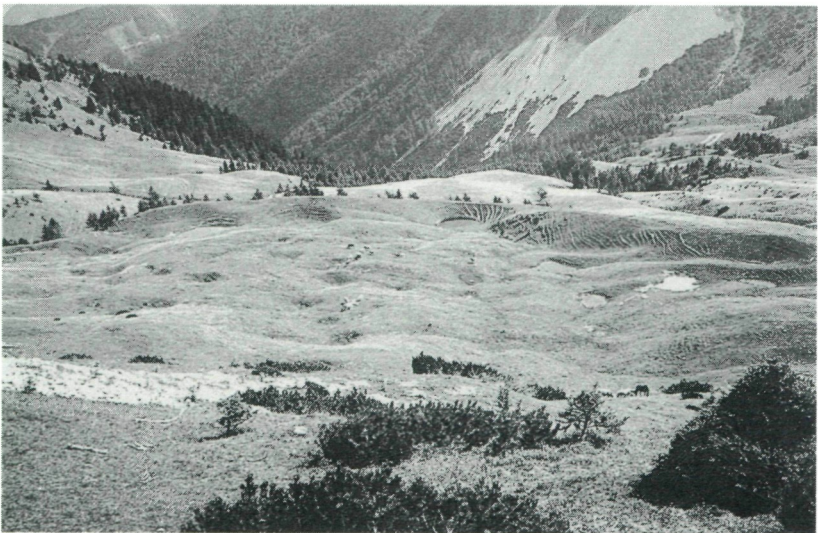
Abb. 4: Mit Wasser gefüllte Toteislöcher hinter der Endmoräne.