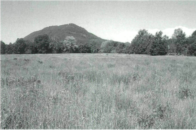
Abb.2: Übersicht über das Untersuchungsge- biet: nördliche Teilfläche - vormals als Maisacker genutzt.

Das Maximum an Arten in den ersten beiden Brachejahren ist das Ergebnis des enormen Wandels an Lebensformen, wie er für progressive Sekundärsukzessionen typisch ist. Die Entwicklung der Artenzahlen ist zudem sehr stark von der Lage der Probefläche im Untersuchungsgebiet bestimmt. Während in den ersten zwei Brachejahren die randlichen Bereiche von besonderer Artenvielfalt bestimmt sind (Randeffekte, Einwanderungsmöglichkeiten aus angrenzenden Bereichen), kehrt sich dieser Effekt im Laufe der Entwicklung um. Die randlichen Bereiche - stark geprägt durch den Nährstoffeintrag aus angrenzenden Flächen bzw. den eutrophierten Entwässerungsgräben - sind in weiterer Folge vor allem von eutraphenten Hochstaudenfluren dominiert und daher sehr artenarm.