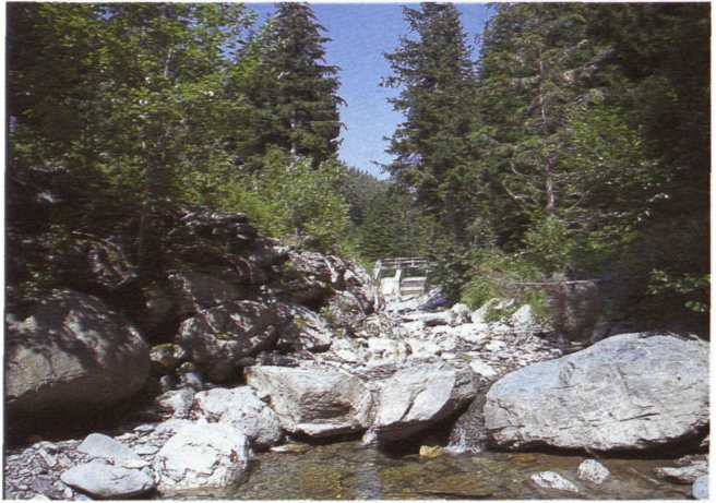
Abb. 4: Blick auf das Wehr (KW Winklbach) und Bachbett mit Restwassermenge

diese Fließstrecke trotz geringer Wasserführung wieder als Brutrevier zu nutzen.