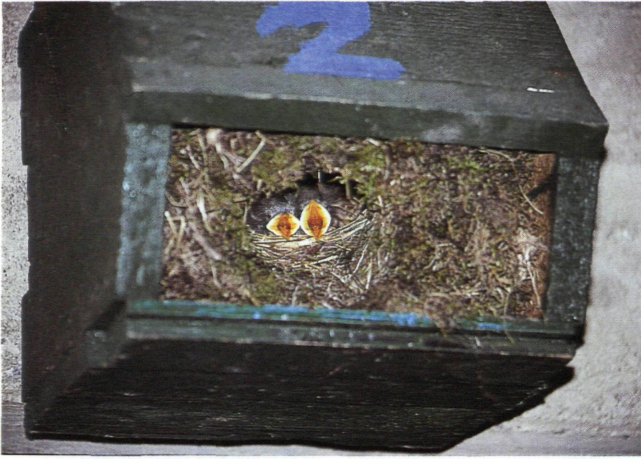
Abb. 8: Besetzter Nistkasten mit fünf ca. 10 Tage alten Wasseramseln

kam zu mehreren Nachgelegen, die jedoch auch wieder vernichtet wurden. Danach erfolgten in diesem Bereich meist keine Ersatzbruten mehr, zumindest wurden keine Nester mehr gefunden.