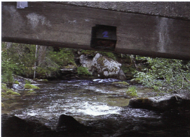
Abb. 3: Nistkästen für die Wasseramsel sollten immer über fließendem Wasser angebracht sein