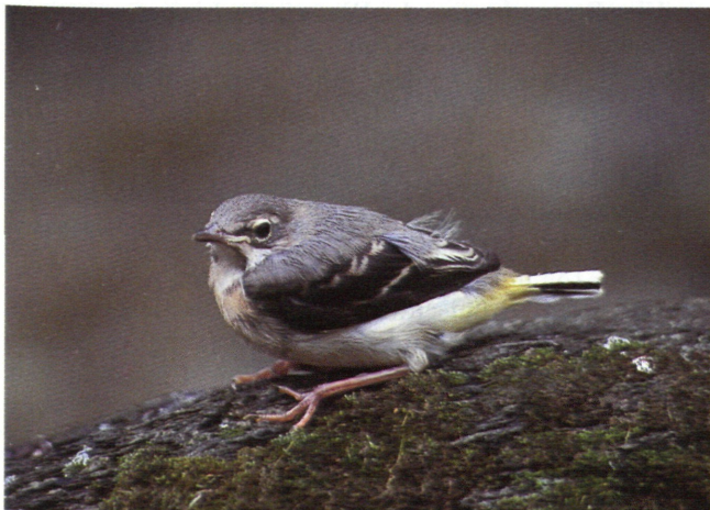
Abb. 6: Juvenile Gebirgsstelze einige Tage nach dem Verlassen des Nestes

Bei der Bestandsaufnahme im Bereich Abschnitt 1 (Seehöhe 1.222 m - 1.325 m, 103 m Höhenunterschied) konnten von der Wasseramsel ( Cinclus cinclus ) 16 Brutnachweise erbracht werden. Mit dem Nestbau wurde im gesamten Abschnitt ab Ende März/Anfang April begonnen. Zehn Bruten waren in den angefertigten Spezialnistkästen. Neun Bruten konnten erfolgreich beendet werden, sieben fielen den Freßfeinden oder dem Hochwasser zum Opfer. Sechs Bruten waren an natürlichen Niststandorten gebaut, fünf in Felswänden, die sechste in einer Uferhöhlung direkt am Wasser, wobei nicht bei allen beobachtet werden konnte, ob diese auch erfolgreich beendet wurden. Von der Gebirgsstelze ( Motacilla cinerea ) wurden im Abschnitt 1 siebzehn Brutnachweise, wovon neun in Nistkästen waren, erbracht. Mehrere Bruten wurden bereits im Eistadium durch Freßfeinde vernichtet. Es erfolgten aber jeweils Nachgelege.