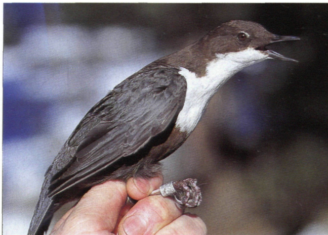
Abb. 10: Wiederfang einer beringten Wasseramsel

Von der Wasseramsel gelangen 11 Wiederfänge selbstberingter Tiere, davon 5 juvenile und 6 adulte Vögel. Bei der Gebirgsstelze waren es 2 juvenile und 1 adulter Vogel. Diese hohe Anzahl an Wiederfängen ist abgesehen von der kurzen Beringungszeit und Individuenanzahl bemerkenswert.