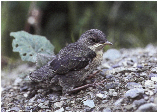
Abb. 5: Bereits flügger Jungvogel der Wasseramsel