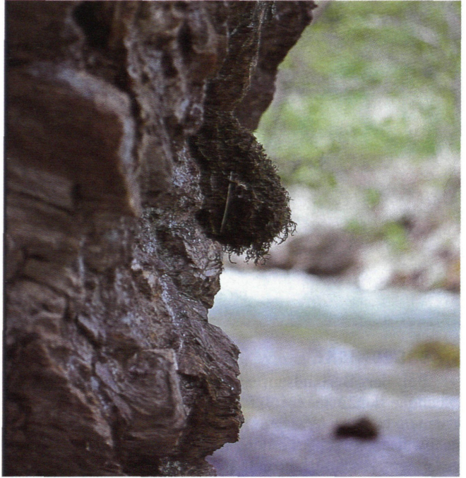
Abb. 7: Ein frei aufgesetztes Nest der Wasseramsel zählt zu den absoluten Raritäten

Im Bereich Abschnitt 2 (Seehöhe 1.126 m - 1.222 m, 96 m Höhenunterschied) wurden elf Brutnachweise von der Wasseramsel erbracht: sechs Bruten befanden sich in Nistkästen. Die übrigen fünf Nachweise konnten auf einem Eisenträger unter einer Holzbrücke sowie im freigespülten Wurzelgeflecht in Uferhöhlungen sowie in Nischen oder was sehr selten zu beobachten ist, hängend am Felsen gemacht werden. Von der Gebirgsstelze wurden in diesem Abschnitt neun Brutnachweise erbracht, wobei zwei Bruten vermutlich durch Freßfeinde (Hermelin, Eichelhäher) vernichtet wurden. Zwei Nachgelege konnten erfolgreich beendet werden.