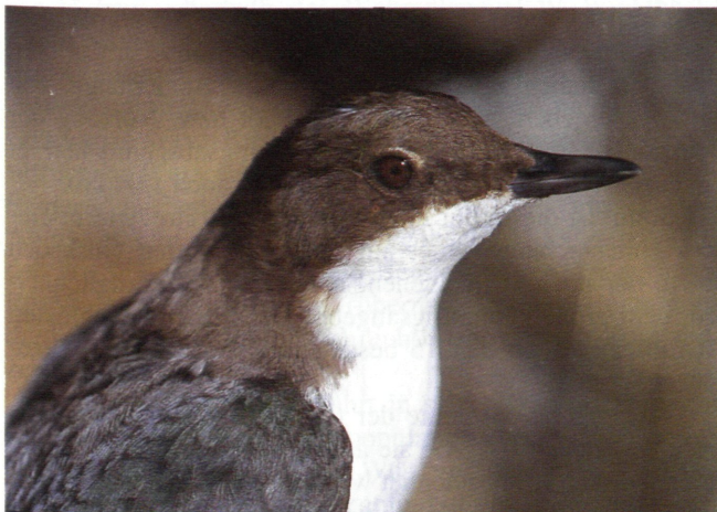
Abb. 11: Porträt einer Wasseramsel

Um diesen Umstand entgegenzuwirken, wurde seitens des Amtes der Kärntner Landesregierung, Abt. 20-Landesplanung, eine dreijährige Untersuchung in Auftrag gegeben.