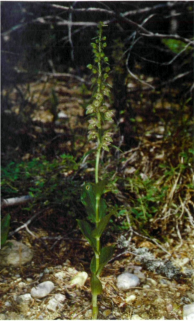
Abb. 4: Epipactis helleborine subsp. orbicularis, Habitus, südexponierte Böschung, halbschattig durch vereinzelte Rotföhren, Sittersdorf, 27. 6. 1998

Bereich des Blütenstands, kräftig und dick und ebenfalls hell gelbgrün bis graugrün gefärbt.