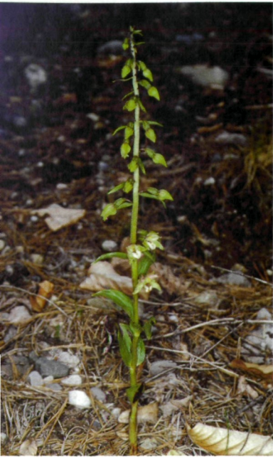
Abb. 2: Epipactis helleborine subsp. orbicularis, Habitus in einem süd-exponierten Rotföhren - Pionierwald, halbschattig, Mieger, 28. 6. 1998