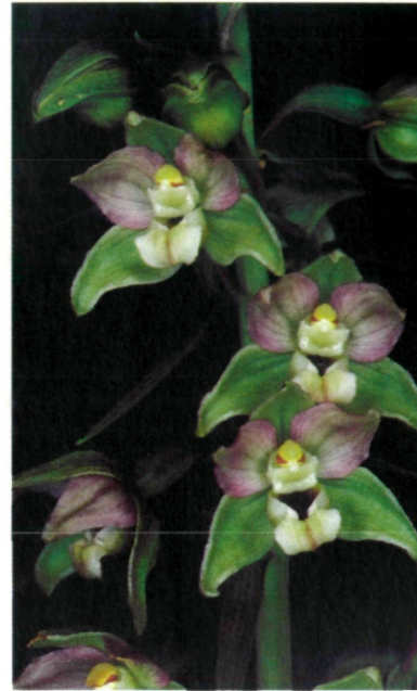
Abb. 5: Epipactis helleborine subsp. orbicularis, Blütenbau einer Pflanze an halbschattigem Standort, Sittersdorf, 27. 6. 1998

Ebriach – Hochobir, Südhänge des Obirmassivs, mehrere Fundstellen auf südexponierten Böschungen, Kalk, 950 – 1150 m, Quadanten 9552/2 und 9553/1, mehrere Einzelpflanzen und kleine Gruppen, 30. 6. 1998 in Knospe,