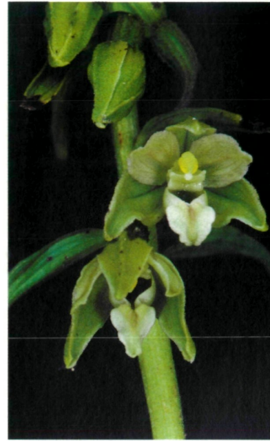
Abb. 3: Epipactis helleborine subsp. orbicularis, Blütenbau einer Pflanze mit vollsonnigem Standort, Mieger, 28. 6. 1998

Der Stengel von Epipactis helleborine subsp. orbicularis ist gerade und meist, auffallend besonders auch im