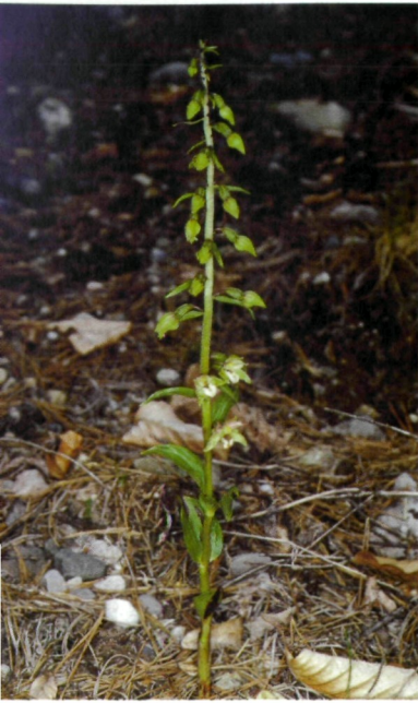
Abb. 2: Epipactis helleborine subsp. orbicularis, Habitus in einem süd-exponierten Rotföhren - Pionierwald, halbschattig, Mieger, 28. 6. 1998