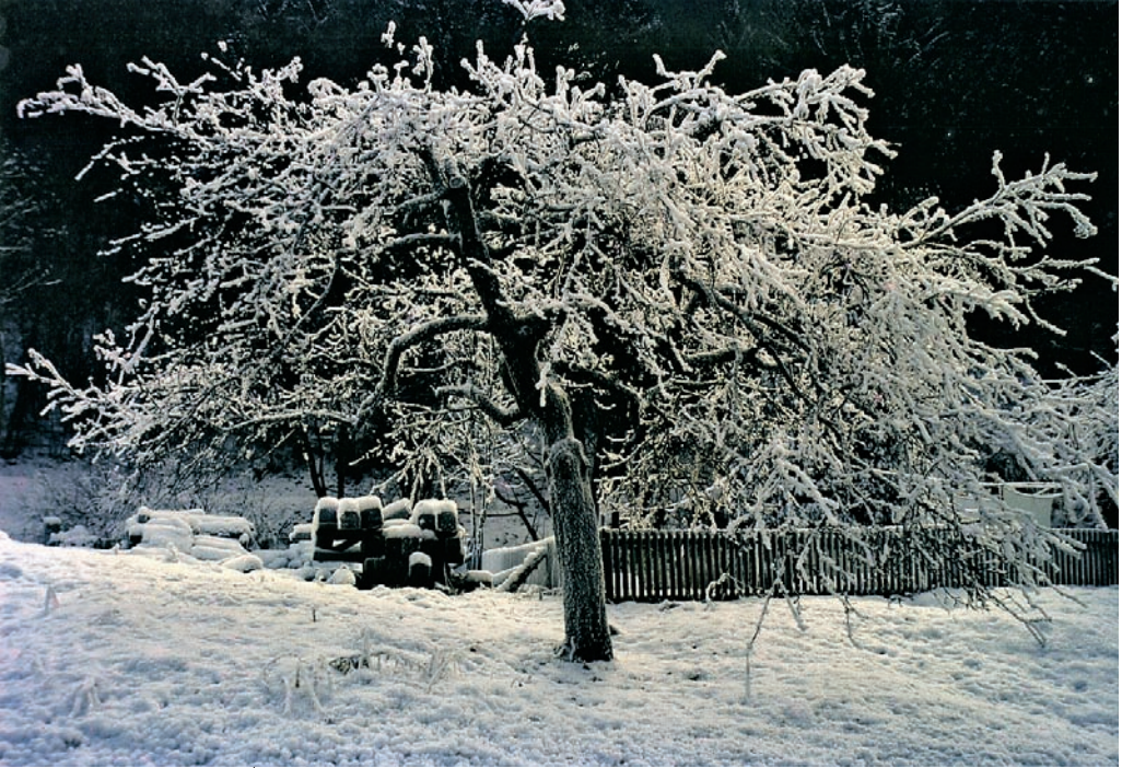
5. Platz: Daria Gutleb „Ossiacher Obstbaum“