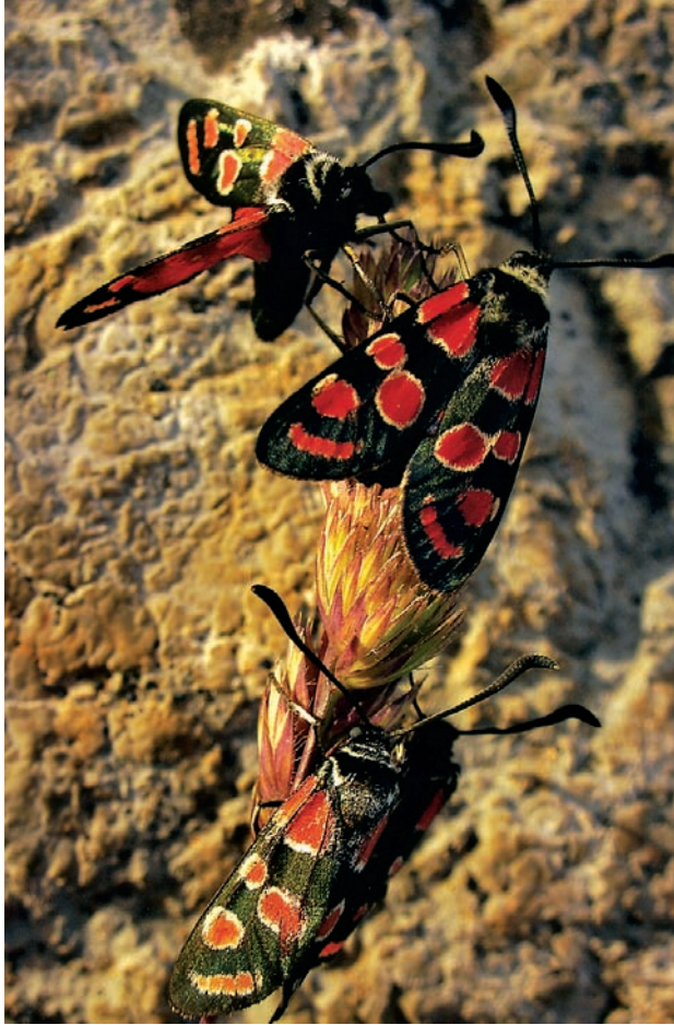
1. Platz: Axel Gauer „Blutströpfchen“