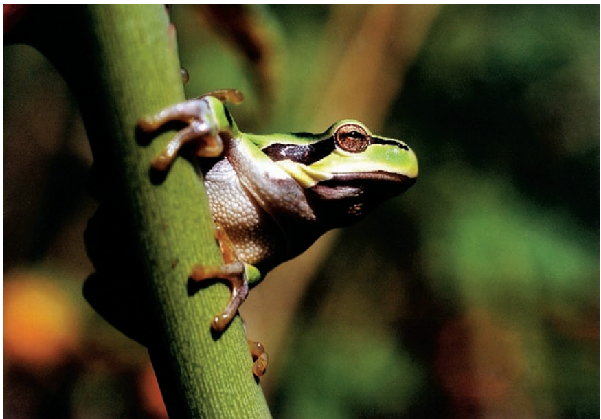
2. Platz: David Petutschnig „Laubfrosch“