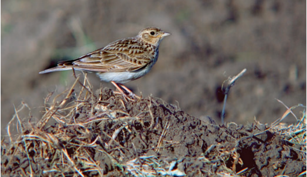
Abb. 1: Die Feldlerche – ein Charaktervogel der offenen Feldflur.

gebietsweise ebenfalls leichte Bestandsrückgänge bemerkt wurden (MAUMARY et al. 2007).