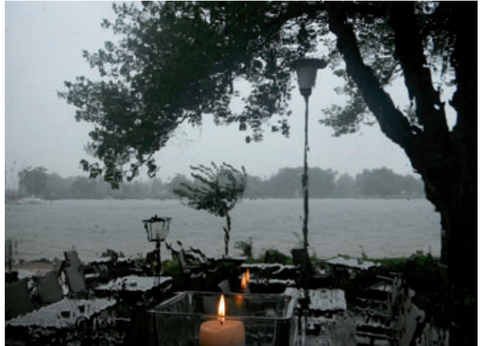
4. Platz: Hannelore Tragatschnig – „einsam“