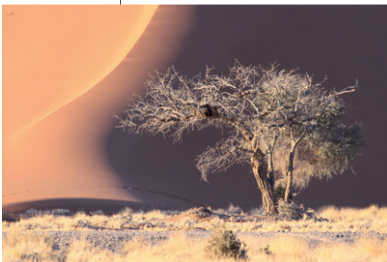
9. Platz: Alfred Celedin – „Baum“