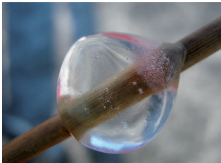
3. Platz: Verena Reumüller – „Eis am Stiel“