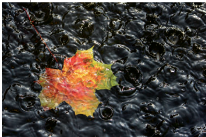
3. Platz: Markus Laßnig – „Oktoberregen“