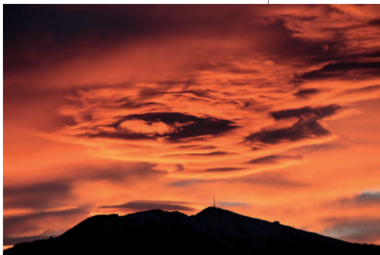
12. Platz: Manfred Dossi – „Das Gold-Eck“