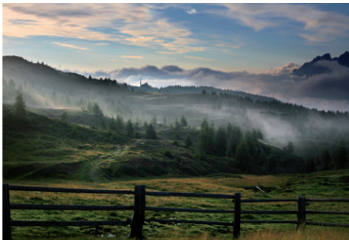
7. Platz: Siegfried Gutzelnig – „Am Hochstein“