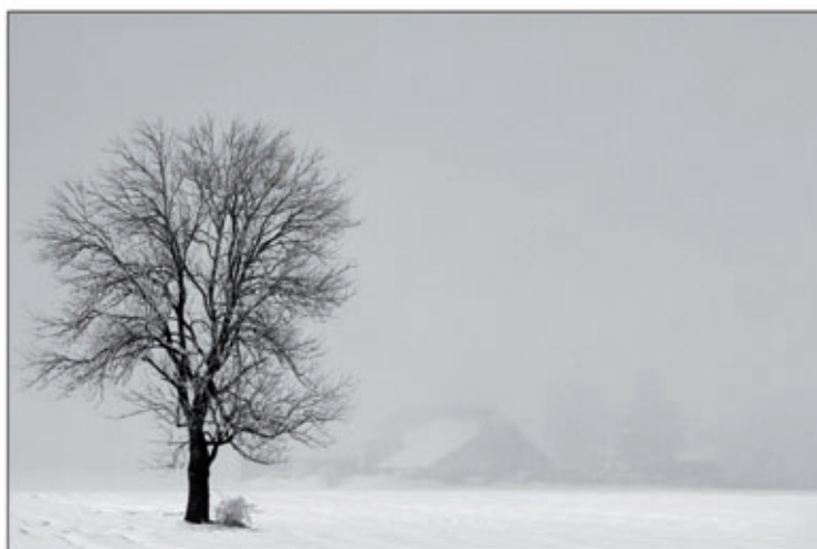
2. Platz: Wolfgang Raunigg – „Der Bauernhof“