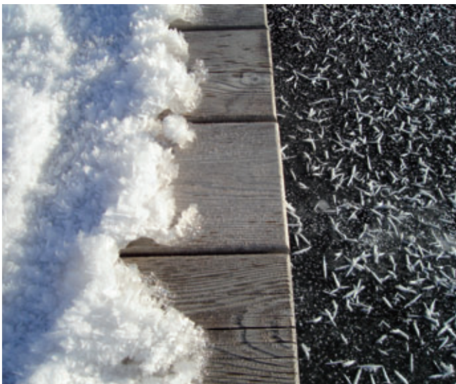
5. Platz: Judith Gratzer – „Steg am Keutschacher See“