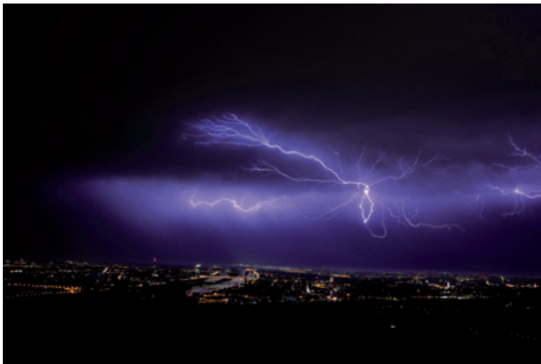
1. Platz: Bernhard Gubier – „Ein Sommer- nachtstraum“