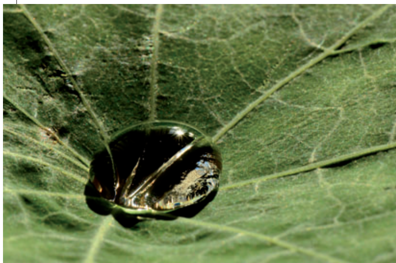
8. Platz: Roland Schiegl – „5 Regentropfen, 1 Sonnenstrahl und 1 Blatt = 1 Wasser- perle“