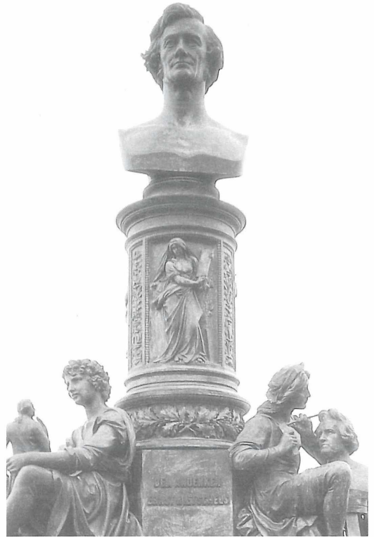
Denkmal des Professors ERNST RIETSCHEL auf der Brühlischen Terrasse in Dresden.

Doch ist eine Schausammlung letztendlich ein steriles Designprodukt, wenn keine lebendige Beziehung zur Forschung und zu deren wissenschaftlichen Ergebnissen besteht. Zwar sollte man Fachwissenschaftler wegen ihrer speziellen Denk- und Darstellungsweise, für die Allgemeinverständlichkeit nicht zu den wichtigsten Kriterien zählt, im allgemeinen von der praktischen Gestaltung einer Ausstellung fernhalten, aber deren Forschungsergebnisse und ihre Denkgebäude sind