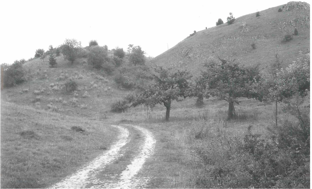
Abbildung 2. Imaginalhabitat von A. agestis . Auf der kleinen Obstwiese sowie im dahinterliegenden ruderalisierten Bereich sind hohe Falterkonzentrationen zu beobachten. Die erste Generation saugt hier vor allem an Gänseblümchen, die zweite an Dost und Gewöhnlichem Zahntrost. Das Larvalhabitat liegt in den angrenzenden Magerrasenhängen. Herbrechtingen, Eselsburger Tal, Juli 1998.

chen Lichtverhältnissen (im Juni inklusive Dämmerung gut 17 h) gezüchtet wurden. Die Beleuchtung der Gruppen 1 und 2 wurde mittels Leuchtstoffröhre (keine Erwärmung) und Zeitschaltuhr durchgeführt, die der Gruppe 3 am Fenster ohne direkte Sonneneinstrahlung. Die leicht unterschiedlichen Temperaturen ergeben sich aus unterschiedlichen Zuchträumen und sind durchschnittliche Zimmertemperaturen, die nachts nur geringfügig absanken. Futterpflanze war Geranium palustre .