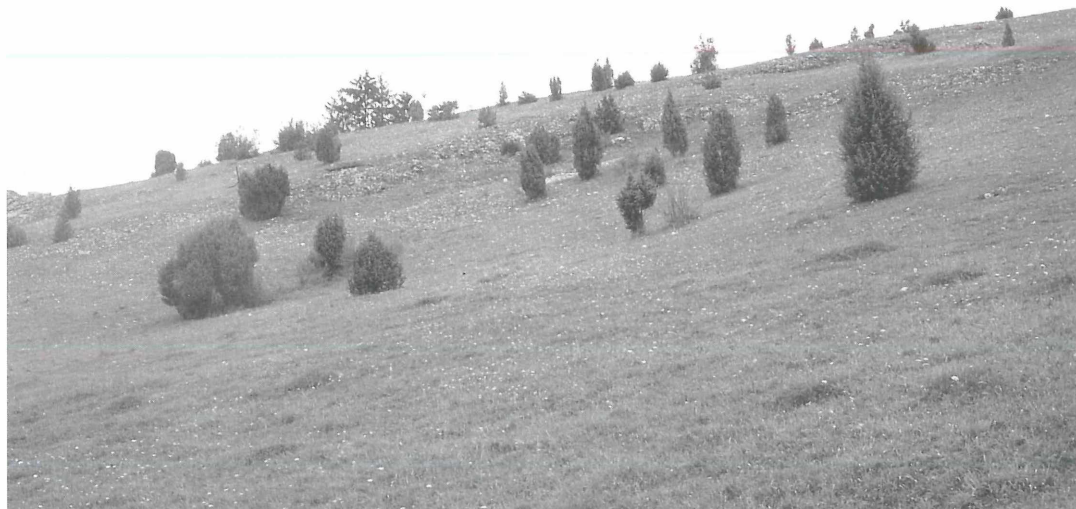
Abbildung 1. Habitat von A. agestis , ein südexponierter, schafbeweideter Südhang mit viel Sonnenröschen. Herbrechtingen, Eselsburger Tal, August 1998.

Dazu wurde 1999 mit einem Weibchen aus dem Eselsburger Tal vom 1./2. Juni 1999 eine Nachzucht unter verschiedener Tageslänge durchgeführt. Nach dem Schlupf wurden drei Gruppen von jeweils 20 Larven gebildet, von denen die erste Gruppe bei 14 h, die zweite bei 16,25 h Kunstlicht und die dritte bei natürli-