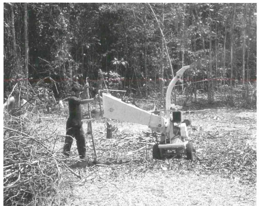
Abbildung 4. Im SHIFT-Projekt (Management pflanzlicher Bestandesabfälle und seine Auswirkungen auf Streuabbau und Boden-Makrofauna in zentralamazonischen Agrar-Ökosystemen) ist das SMNK in einem Verbundprojekt deutscher und brasilianischer Arbeitsgruppen in Brasilien engagiert. Das Ziel besteht darin, Empfehlungen für landwirtschaftliche Nutzungssysteme in Amazonien zur Verbesserung der Bodenfruchtbarkeit durch ein Management der Pflanzenabfälle in Kombination mit Düngergaben zu entwickeln.