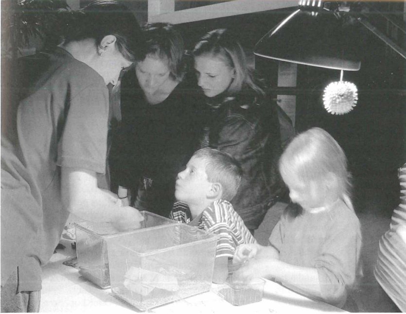
Abbildung 2. Anhand von Originalen lassen sich naturkundliche Themen von den Museumspädagogen am besten erläutern. Hier im Bild festgehalten sind Aktivitäten während der KAMUNA.