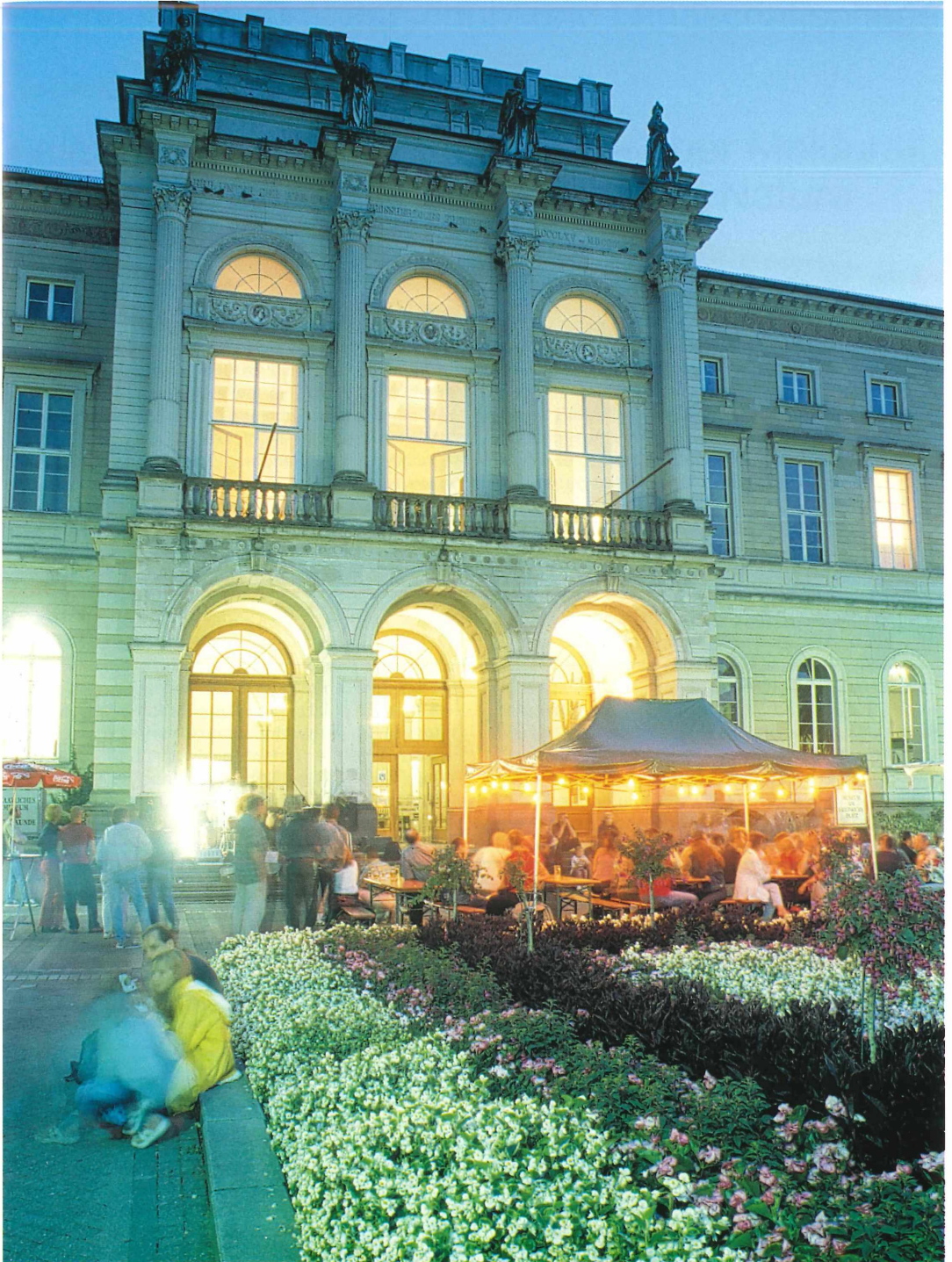
Tafel 1. Die festlich illuminierte Fassade des Karlsruher Naturkundemuseums zur Museumsnacht "KAMUNA" am 4. August 2001.