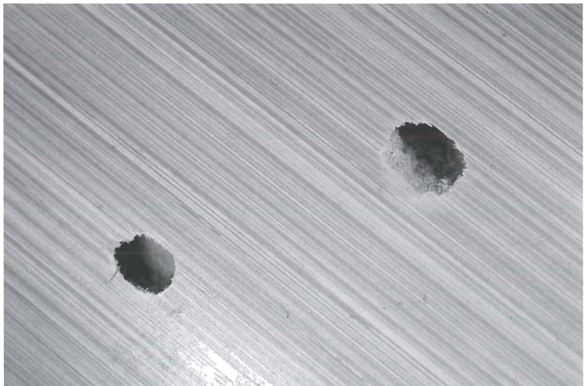
Abbildung 3. Aus schlupf-Öffnungen der hier gezeigten Exemplare von Chlorophorus annularis (F), an verarbeitetem Bambus-Holm.

Da es sich bei C. annularis um eine recht auffällige Käfer-Art handelt, wird das weitere Auftreten in Deutschland sicher von Koleopterologen weiter im Auge behalten werden.