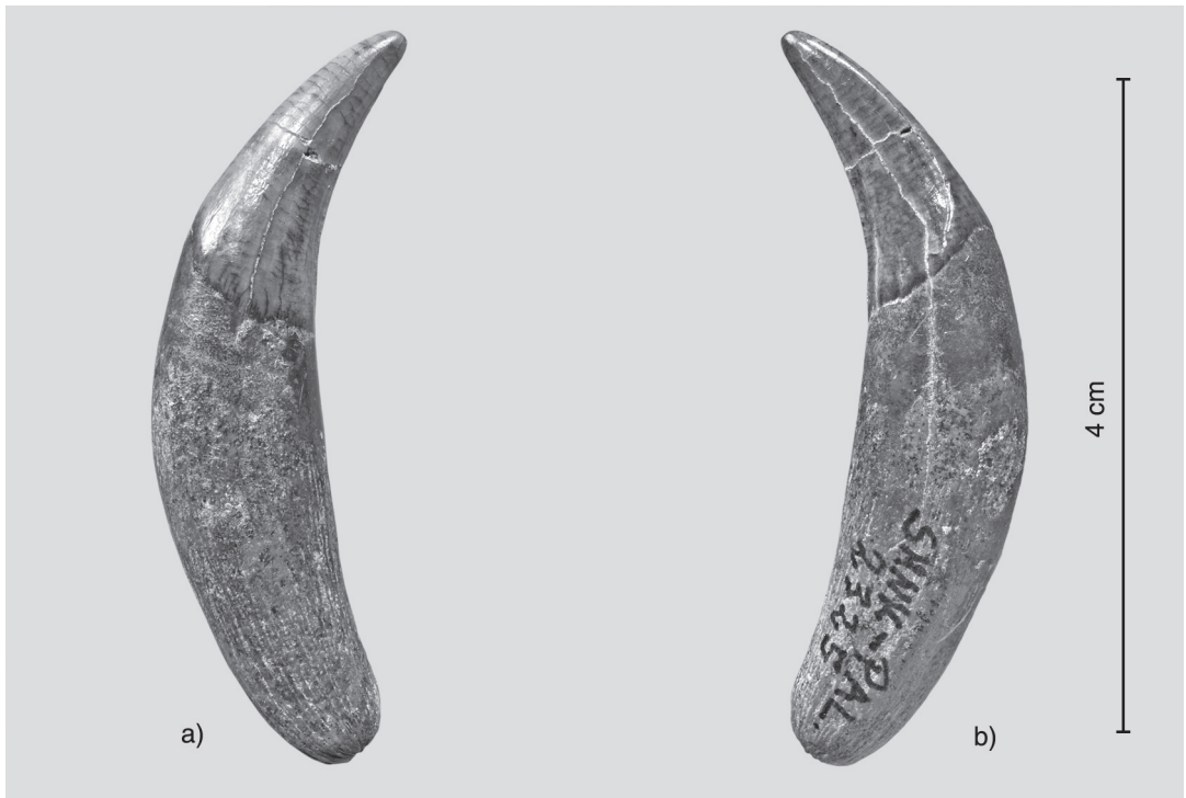
Abbildung 1. Sansanosmilus jourdani (FILHOL, 1881). Linker, unterer Caninus. Geowissenschaftliche Sammlungen, Staatliches Museum für Naturkunde Karlsruhe (SMNK-PAL. 2325). a) Außenansicht; b) Innenansicht.