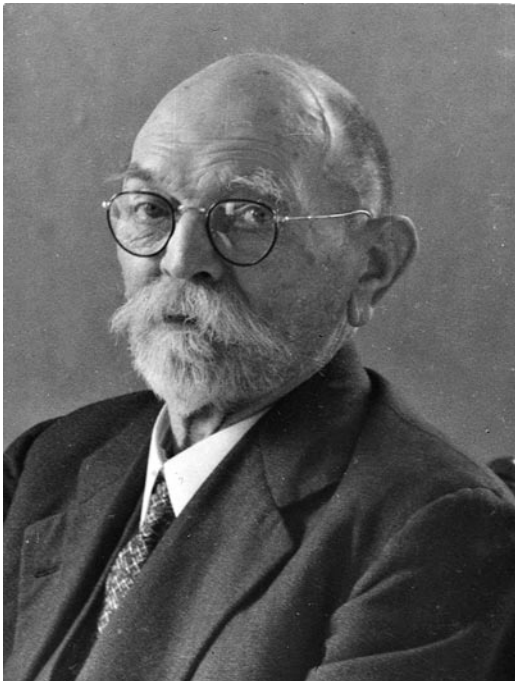
Abbildung 2. Foto ALFRED Lösch in den 1940er Jahren.

und machte ihn mit Flechten vertraut. Er legte damit den Keim für LÖSCHS erstes Spezialgebiet. Sicherlich war es auch GOLL, der LÖSCH veranlasste, bereits 1884 in den Badischen Botanischen Verein einzutreten, dessen erster Präsident GOLL war. GOLL publizierte in diesen Jahren eine Arbeit über die Moose und Flechten des Kaiserstuhls und einige Zeit später auch der Gegend um Schiltach, seinem Geburtsort, in den er 1892, nach seiner Zuruhesetzung, zog und wo er 1894 starb (GOLL 1892-1893, LEUTZ 1894). Er war damit in jener Zeit einer der ganz wenigen Flechtenkenner Südwestdeutschlands.