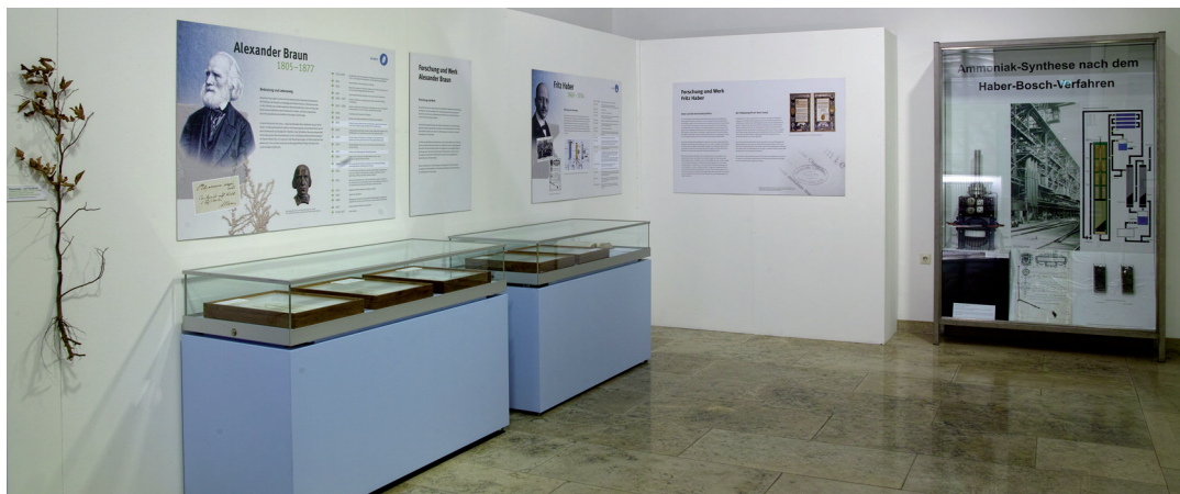
Abbildung 4. ALEXANDER BRAUN, links im Bild, war der Begründer des Naturwissenschaftlichen Vereins Karlsruhe. Rechts im Bild die Vitrine zu FRITZ HABER, dem Erfinder der Ammoniaksynthese aus den Elementen und einzigem Nobelpreisträger des NWV. Sie wurde vom KIT, Fakultät für Chemie und Biowissenschaften, Institut für technische Chemie und Polymerchemie entliehen und enthält ein Modell der von HABER verwendeten Versuchsanlage zur Ammoniaksynthese. Ferner zeigt sie zwei Glasbehälter mit Katalysatorkörnern (frisch und verbraucht), eine Abbildung der Ammoniak-Produktionsanlage der BASF (um 1920), die Reproduktion der Patent-Urkunde von Dr. FRITZ HABER und das Schema eines Synthesekreislaufs für die Ammoniaksynthese.

Während der Vegetationszeit führte die Arbeitsgemeinschaft seitdem im Abstand von 2-3 Wochen Kartierexkursionen in der Umgebung von Karlsruhe durch und etablierte die wöchentlichen „Karlsruher Montagsexkursionen“, bei denen die Flora von Karlsruhe und der näheren Umgebung der Stadt erfasst wurden.