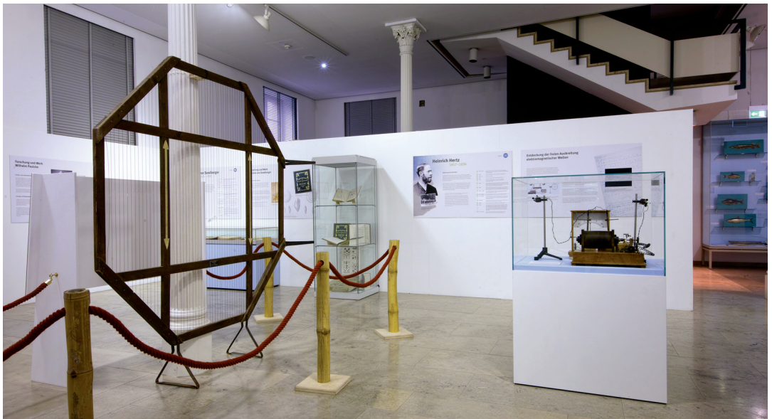
Abbildung 7. Im Vordergrund Versuchsapparaturen zu HEINRICH HERTZ, die vom Karlsruher Institut für Technologie (KIT), Fakultät für Physik, zur Verfügung gestellt wurden. Links das HERTZ'sche Gitter (in einem Nachbau von 1957), rechts Sender und Empfänger bestehend aus Funkeninduktor, zwei Antennen, Anzeigegerät und Akku. Die Originalgeräte befinden sich im Deutschen Museum in München. Am 13. November 1886 gelang HERTZ erstmals die Übertragung elektromagnetischer Wellen von einem Sender zu einem Empfänger. Der Drahtgitterpolarisator für elektromagnetische Wellen ist für Wellen durchlässig, deren elektrisches Feld senkrecht zu den Drähten schwingt. Bei Parallelität reflektiert das Gitter wie eine leitende Fläche.