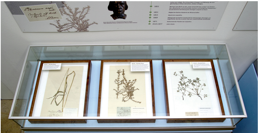
Abbildung 3. Hier zu sehen sind Originale, die ALEXANDER BRAUN selbst in den Händen hielt: Isoetis lacustris (See-Brachsenkraut) und Elatine alsinastrum (Sechsmänniger Tännel) aus der Botanischen Staatssammlung München, gesammelt von A. BRAUN. Der mittlere Herbarbeleg aus dem SMNK, von CARL CHRISTIAN GMELIN auf dem Turmberg bei Karlsruhe-Durlach im August 1810 gesammelt, wurde von BRAUN 1841 als eigene Art beschrieben: Polycnemum majus (Großes Knorpelkraut). Es konnte dort nach 1900 nicht mehr gefunden werden.

Als lose Vereinigung entstand 1987 die Botanische Arbeitsgemeinschaft Nordbaden. In ihr fanden sich ehrenamtliche Mitarbeiter der Floristischen Kartierung Baden-Württembergs zusammen, um die Flora und Vegetation von Karlsruhe und seiner weiteren Umgebung zu erfassen. Eine erste Exkursion führte am 28. März 1987 nach Rheinau, um dort nach dem in Baden-Württemberg verschollenen Zwerggras ( Mibora minima ) zu suchen. Ein Wiederfund gelang zwar nicht, es wurden aber eine ganze Reihe seltener Arten der Mannheimer Sandflora und Ruderalvegetation festgestellt und in einer Artenliste protokolliert.