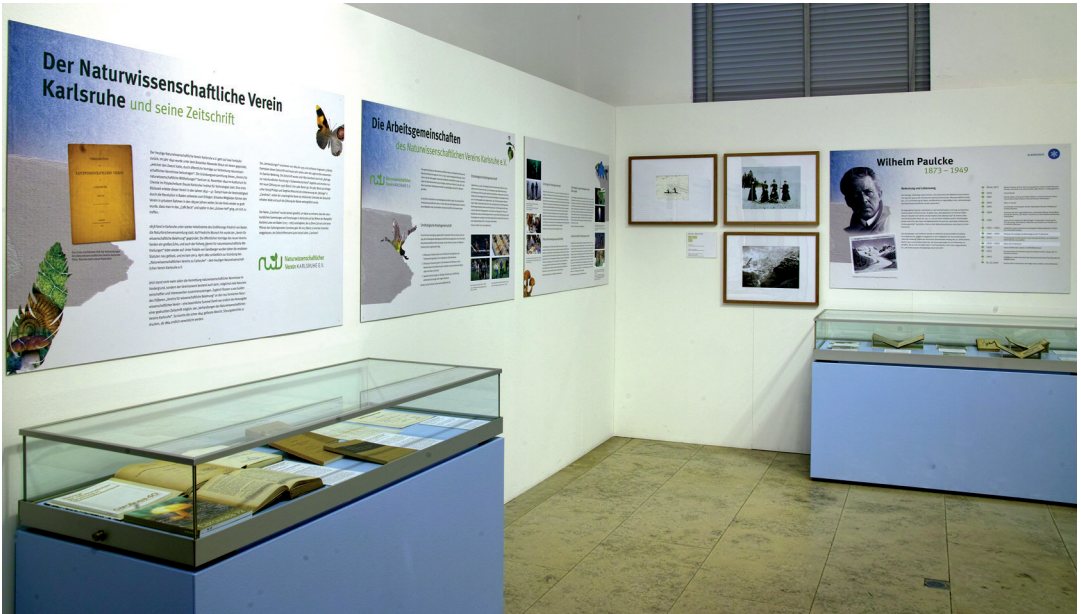
Abbildung 2. Blick in die kleine Sonderausstellung zum 175. Jubiläum des Naturwissenschaftlichen Vereins Karlsruhe. Rechts neben den Tafeln, auf denen sich die Arbeitsgemeinschaften des Vereins in der Ausstellung präsentierten, waren die historischen Fotografien des Glaziologen WILHELM PAULCKE ein Blickfang. Leihgeber waren das Generallandesarchiv Karlsruhe und das KIT-Archiv, beide Institutionen bewahren Teile des Nachlasses von WILHELM PAULCKE auf.

jährliches Vortragsprogramm mit speziellen entomologischen Themen und Reiseberichten, aber auch Kartierungsexkursionen in ganz Baden-Württemberg und im Studiengebiet der europäischen schmetterlingskundlichen Gesellschaft Societas Europaea Lepidopterologica (SEL) im Vinschgau in Norditalien.