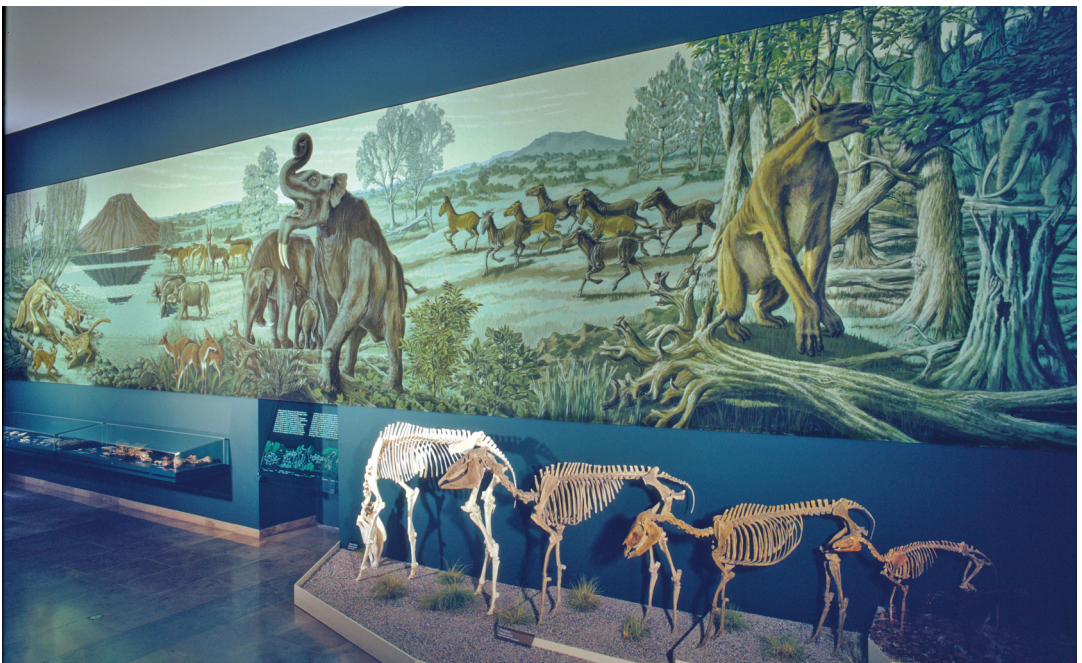
Abbildung 3. Das 13,5 m lange Lebensbild „Höwenegg zur Miozänzeit“ und die Entwicklungsreihe des Pferdeskeletts.