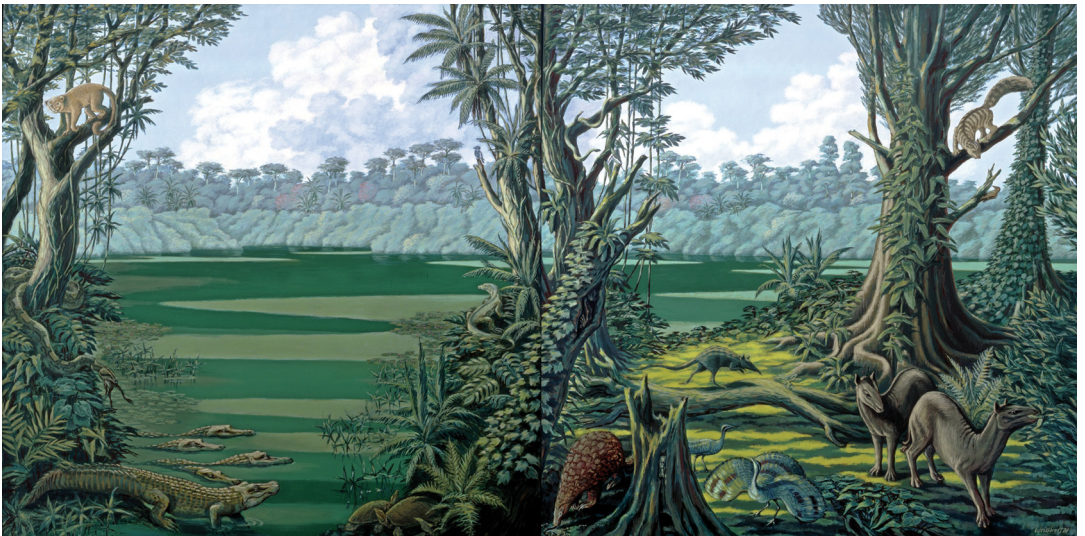
Abbildung 5. Lebensbild des eozänen Sees von Messel nach der Rekonstruktion von S. RIETSCHEL als Maar-See (1988).