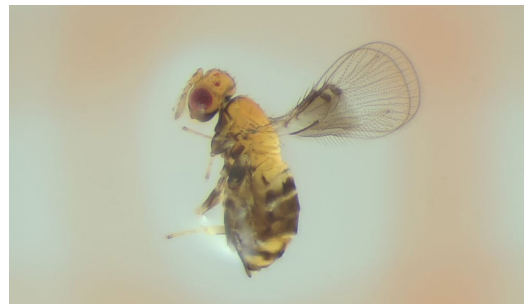
Abbildung 12. Trichogrammatidae Chaetostricha sp.