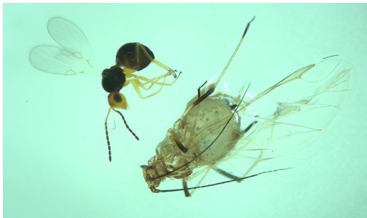
Abbildung 4. Figitidae Alloxysta victrix (Hyperparasitoid) mit Blattlausmumie.