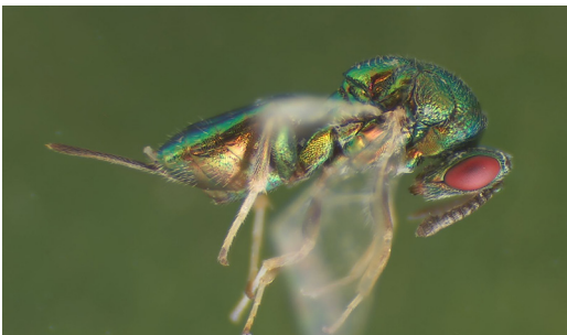
Abbildung 10. Torymidae Pseudotorymus brassicae .

1842) sp. und Aprostocetus epicharmus (Walker, 1839) aus der Familie Eulophidae (beide Hymenoptera: Chalcidoidea).