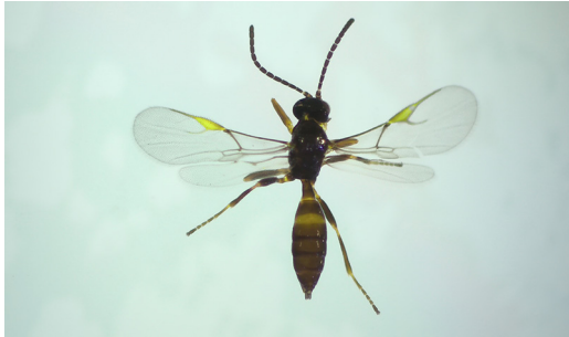
Abbildung 3. Braconidae Diaeretiella rapae .

noptera: Ichneumonoidea). Alle drei nachgewiesenen Schlupfwespenarten gelten als Gegenspieler des Rapsglanzkäfers. In vier von fünf untersuchten Rapsfeldern wurde bei Klopfproben die Schlupfwespenart P. brevis festgestellt. Auf dem fünften Rapsfeld wurden P. interstitialis (Abb. 6) und T. heterocerus ermittelt. Auf drei Feldern mit mehrjährigen Blütmischungen mit Anteil von Raps und Senf sowie im Kleingarten wurde ebenfalls P. brevis beobachtet. Diese Spezies wurde insgesamt am häufigsten registriert (siehe Tab. 2b).