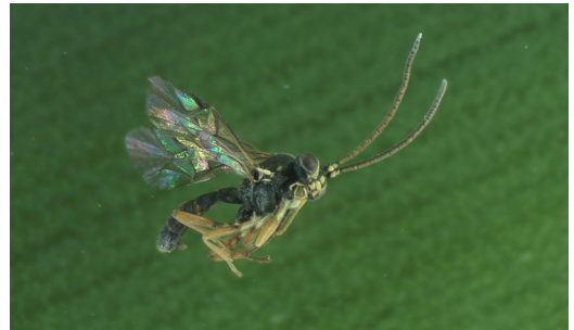
Abbildung 11. Ichneumonidae Syrphophilus bizonarius .

Nach dem Kältereiz im Klimaschrank sind im Fotoelektor mit je einem Individuum pro Art folgende, diapausierende Parasitoide geschlüpft: Syrphophilus bizonarius (Gravenhorst, 1829) (Abb. 11) aus der Familie Ichneumonidae (Hymenoptera: Ichneumonoidea) und Chaetostricha sp. Walker, 1851 (Abb. 12) aus der Familie Trichogrammatidae (Hymenoptera: Chalcidoidea). Die Art Syrphophilus bizonarius gilt als Parasitoid von Schwebfliegen (Fam. Syrphidae). Die Art Chaetostricha sp. ist ein sogenannter Eiparasitoid von Wanzen (Hemiptera). Beide Wirtsarten kommen in Rapsfeldern vor.