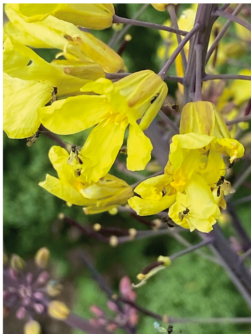
Abbildung 1. Ichneumonidae Phradis sp. auf Rapsblüte.

Die entsprechenden Erhebungen zur Antagonisten-Fauna dieser spezifischen Schädlinge wurden in Winterraps, Gelbem Senf und in mehrjährigen Blühmischungen mit Anteilen der beiden vorgenannten Pflanzenarten sowie an Brassica sp. sowohl in der Kleingartenanlage bei Karlsruhe wie auch auf Praxisflächen des LTZ Augstenberg und verschiedenen Ackerbaubetrieben durchgeführt.