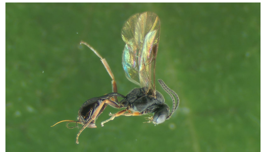
Abbildung 6. Ichneumonidae Phradis interstitialis .

Neben den Parasitoiden des Kohlschotenrüsslers sind in Fotoelektoren auch Gegenspieler der Kohlschotengallmücke ( Dasineura brassicae ) geschlüpft. Diese sind: Platygaster subuliphormis Kieffer, 1926, Platygaster sp. Latreille, 1809 aus der Familie Platygastriidae (Hymenoptera: Platygastroidea), Pseudotorymus brassicae Ruschka, 1923 (Abb. 10) aus der Familie Torymidae, Syntomosphyum (= Tetrastichus Walker,