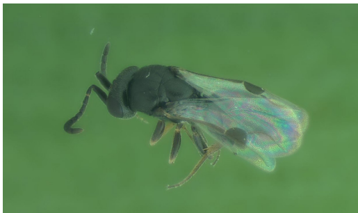
Abbildung 5. Megaspilidae Dendrocerus carpenteri .