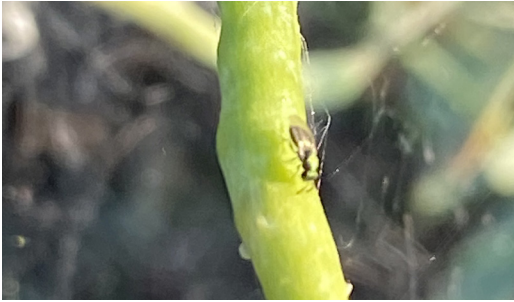
Abbildung 7. Pteromalidae Trichomalus perfectus auf Rapsschote.