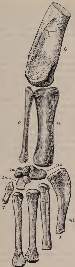
Fig. 1. Metriorhynchus Jackeli E. SCHM. Rechte Hinterextremität des neuen Tübinger Exemplares in \frac{1}{2} nat. Gr. (z. T. nach E. AUER, dieses Centralbl. 1907, p. 354). fe Femur, ti Tibia, fi Fibula, as Astragalus, ca Calcaneus, t3+4 die verschmolzenen beiden Tarsalia, mt Metatarsus. ( Fe ist mit der Unterseite nach rechts gedreht worden.)

Damit dies aber geschehen könne, müssen Tibia und Fibula anders zu einander stehen, als es auf p. 354 dargestellt ist 1 . Die Tibia muß um 180^{\circ} nach rechts und die Fibula um ca. 110^{\circ} ebenfalls nach rechts gedreht werden, so daß sie nicht mehr in einer Ebene liegen, sondern in einem spitzen Winkel gegen einander zu stehen kommen. Dann wendet die Tibia ihre stärker konkave Seite