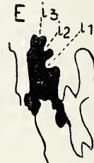
Fig. 2 b.

Fig. 1. Entstehung der Inzisionen am Innensattel von Perisphinctes rotundatus ROEMER. Museum Göttingen.