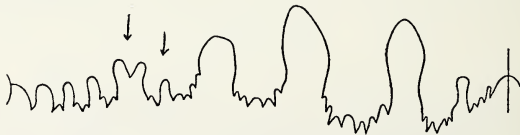
Fig. 4. Lobenlinie von Hedenstroemia Muthiana KRAFFT. (Nach DIENER und v. KRAFFT.)

Die Abnormitäten, die in der Nähe der Naht bei Aspidites Muthianus und Hedenstroemia Muthiana u. a. auftreten, bilden einen Fall für sich. Hier (Fig. 4), wo es ihm gerade paßt, deutet