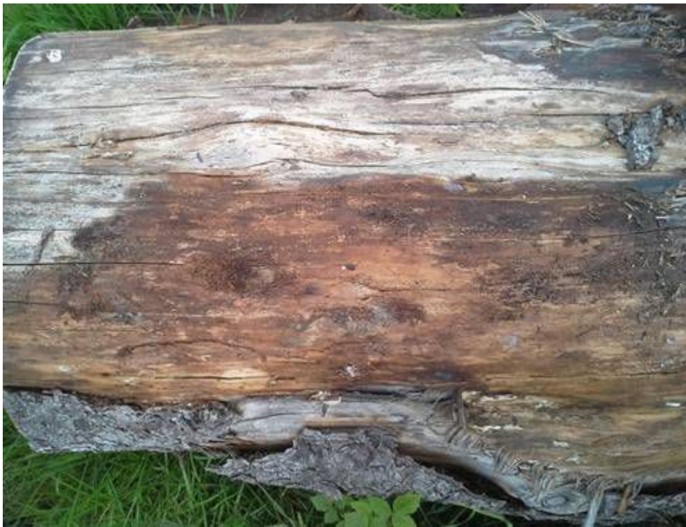
Abbildung 4: Stammstück einer Fichte mit einem Individuum (Revier Sankt Andreasberg)

Innerhalb vom Deutschland wurde die Art nur in Bayern (KAHLEN 1997, KÖHLER 1997), Baden-