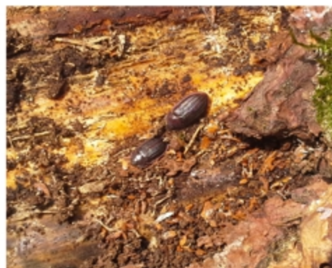
Abbildung 2: typisches Habitat von Ostoma ferruginea (Revier Sankt Andreasberg)