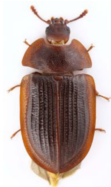
Abbildung 5: Ostoma ferruginea (LINNAEUS, 1758)

Somit handelt es sich um einen Wiederfund für die Region Hannover.