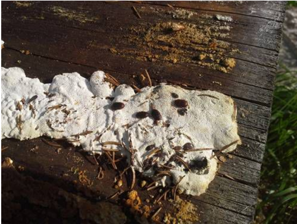
Abbildung 3: Fundstelle von Ostoma ferruginea mit Aradus betulinus im Nationalpark Harz (Revier Rehberg)