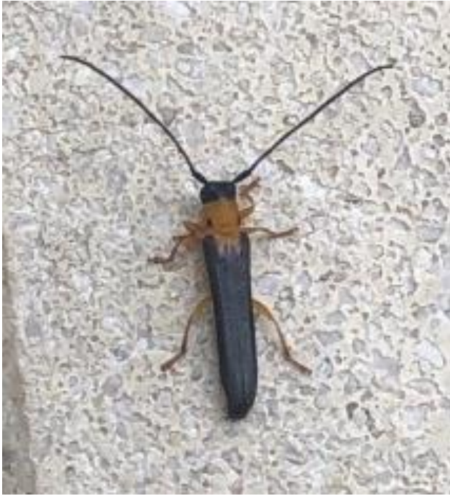
Abb. 2: Oberea pupillata in Urbar (bei Koblenz).