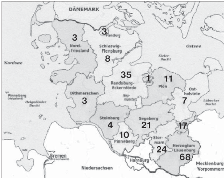
Abb. 2: Vorkommen des Wendehalses Jynx torquilla in Schleswig-Holstein aus regionaler Sicht. Zahl der Beobachtungsorte in den einzelnen Land- und Stadtkreisen aus allen Jahren.