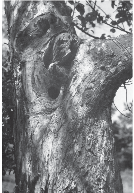
Abb. 3 und 4: Wendehals am Nistkasten. – Naturhöhle. Fig. 3 and 4: Wryneck at its nestbox – and in a natural nesting hole.

tersuchten Lübecker Raum liegen für die drei Zeiträume bis 1940, 1941–1965 und 1966–1990 Nachrichten von jeweils 5–6 Orten vor, was eine Tendenz nicht erkennen lässt. Auch die Datensammlung von HAGEN (1935) spricht für ein zeitweise regelmäßiges Auftreten im Südosten des Landes (Lübeck, Herzogtum Lauenburg). Dasselbe gilt für den Hamburger Raum (GARTHE 1996).