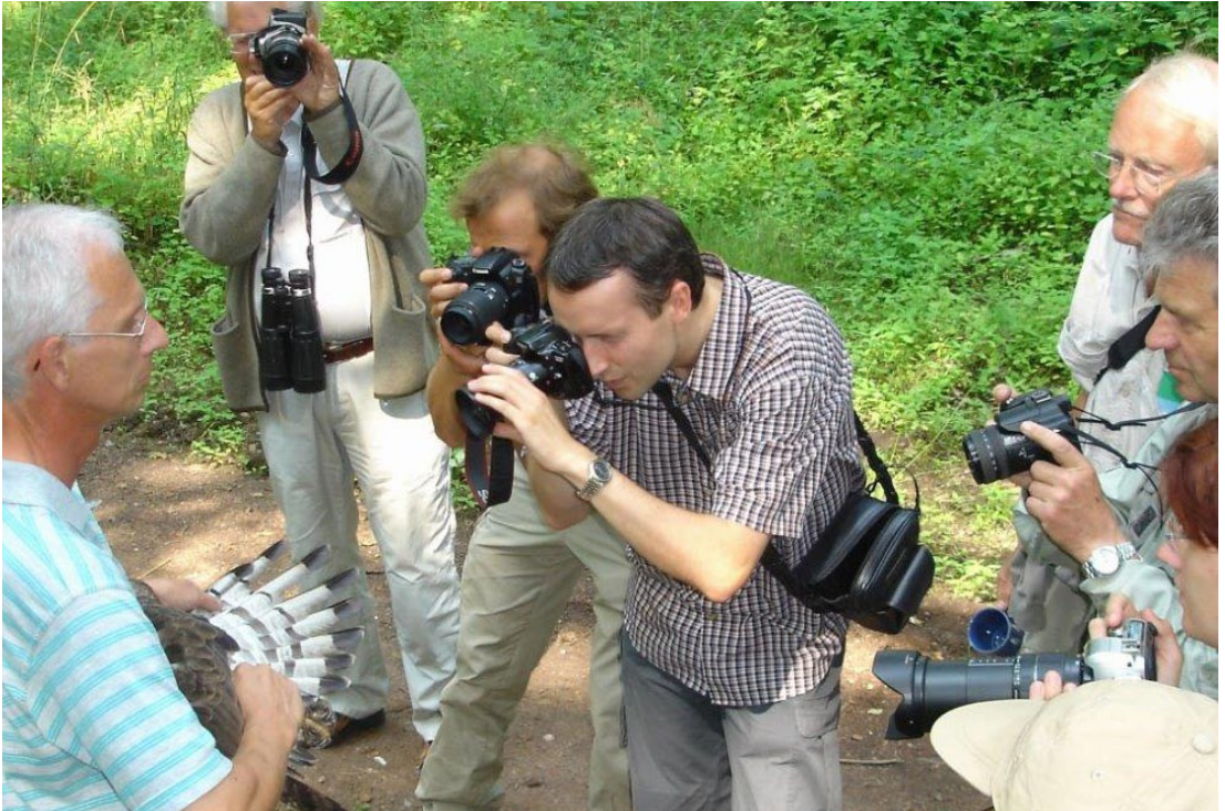
Wespenbussard-Beringung. Foto: U. Robitzky, 2006, Dänischer Wohld.

manche kreative Eigenart und macht das Wirken des Geehrten in manchen Teilen sichtbar.