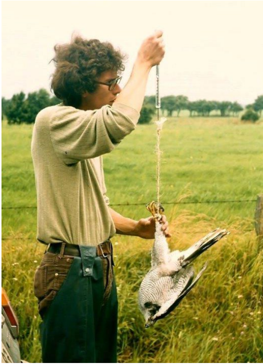
Habichtmännchen wird gewogen.

Es war gleichzeitig der Abschluss einer sehr intensiv geführten Arbeitszeit in der Landschaft, die ihn oft ganztägig zu seinen Freunden, den Habichten, führte. Die Kontrollfahrten gingen zu den verschiedenen Nistplätzen auf der 2000 km 2 großen Schleswiger Untersuchungsfläche, an denen er gefangene Habichte mit Ringen und Sendern markierte. Ein Schwerpunkt seiner intensiven Studien war das Gebiet um die Forschungsstation des Landesjagdverbandes in Grönwohld an der Eckernförder Bucht, in der insbesondere das so genannte Niederwild intensiv gehegt wurde. Ein weiterer Forschungsort lag im Gebiet um Börm/Barkhorn, an dem er sich während der Kontrollzeit einen Winter lang eingemietet hatte. An diesen beiden Standorten sollte der Einfluss des Habichts auf Fasanen, Rebhühner oder Hasen untersucht werden.