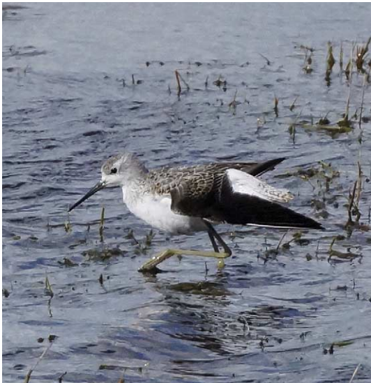
Abb. 2: Einer von zeitweise sieben Teichwasserläufern im Meldorfer Speicherkoog/HEI, 10.08.2016. // One of up to seven Marsh Sandpipers at Meldorfer Speicherkoog.

Ein weiteres Individuum wurde zwischen dem 23.08.2016 und dem 27.08.2016 an der Gräberkate (Mühlenteich), OD von diversen Beobachtern auf ornitho.de gemeldet. Die einzige eingereichte Meldung musste jedoch mangels Beschreibung abgelehnt wer-