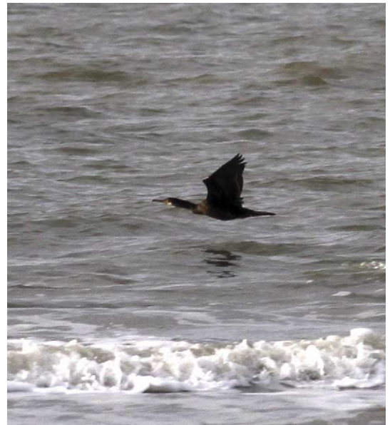
Abb. 3: Krähenscharbe, St. Peter/NF, 27.06.2016. // European Shag.