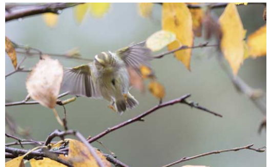
Abb. 8: Goldhähnchen-Laubsänger, St. Peter-Ording/NF, 05.11.2016. // Pallas's Leaf Warbler.

Der Goldhähnchen-Laubsänger wurde zum 01.01.2015 von der nationalen Meldeliste gestrichen und in die Zuständigkeit der Landeskommissionen übergeben (DAK 2014b). Er ist fortan bei der AK-SH/HH zu dokumentieren.