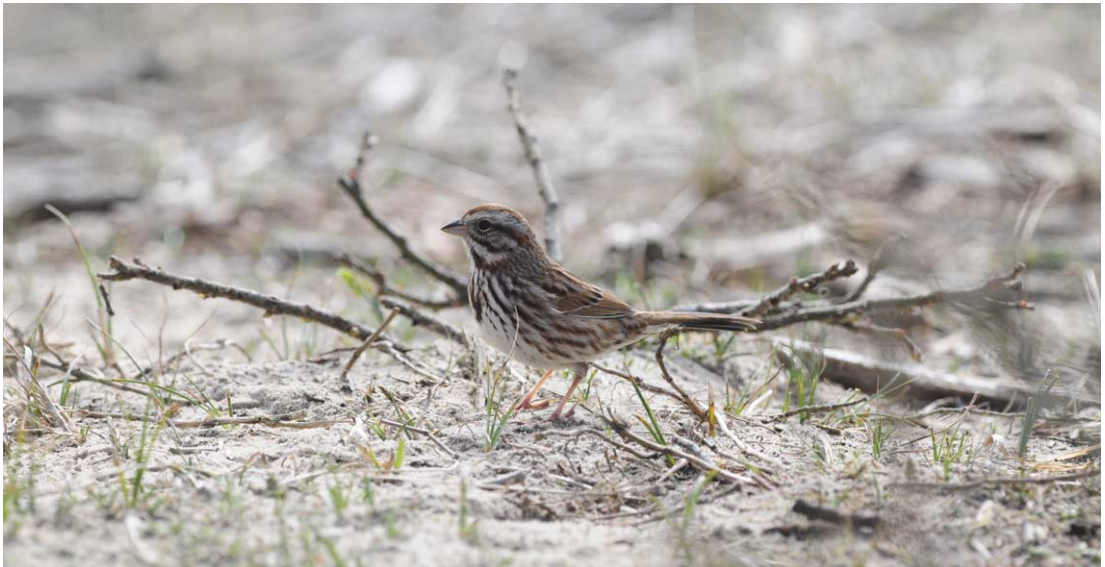
Abb. 11: Deutscher Erstnachweis der Singammer: Amrum/NF, 08.04.2016. // Germany's first Song Sparrow, on the island of Amrum.