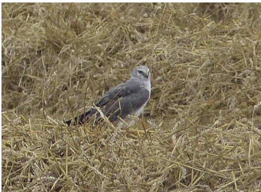
Abb. 6: Steppenweihe, K3 Männchen, Sönke-Nissen-Koog/NF, 18.08.2016. // Pallid Harrier, 3rd cy male.