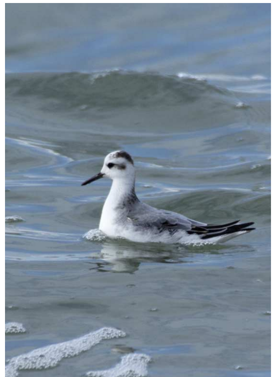
Abb. 1: Thorshühnchen // Red Phalarope. Sylt/NE, 02.10.2016.