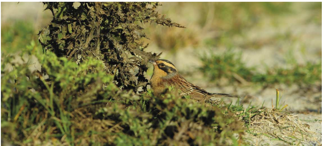
Abb. 9: Bergbraunelle auf Sylt/NF, 29.10.2016 – einer von acht Nachweisen dieser Art für Deutschland im Jahr 2016. // Siberian Accentor on Sylt—one of eight records of this species from Germany in 2016.