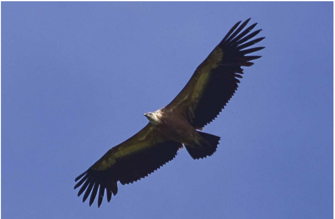
Abb. 5: Vom Gänsegeier gab es in diesem Jahr erstaunlich viele Beobachtungen. Hier eines der zeitweise drei Individuen aus Panten/RZ, 12.07.2016 // There have been an amazing number of Griffon Vulture observations this year. Here one of three individuals near Panten.