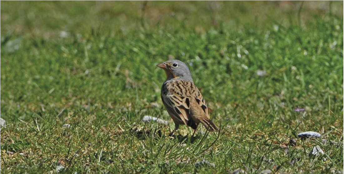
Abb. 10: Grauortolan – Erstnachweis für die Region und seit über 130 Jahren erstmals wieder in Deutschland: Sylt-Rantum/NF, 09.05.2016. // Cretzschmar's Bunting—first record for the recording area, and the first since more than 130 years in Germany.