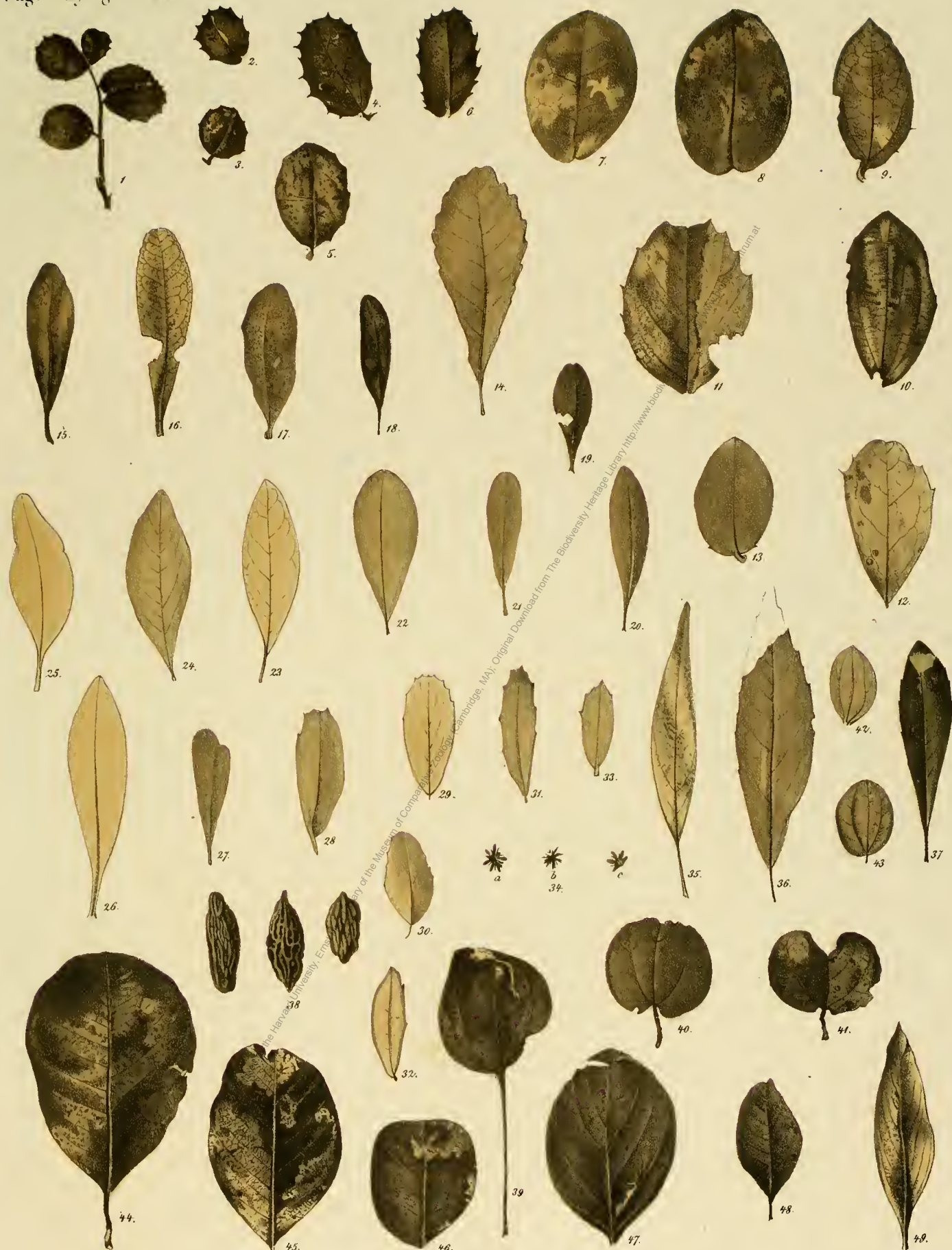
Fig. 1-6 Her. sphenophylla Ung. Fig. 7-8 Her. cyclophylla Ung. Fig. 9-13 Her. neoyena Ung. Fig. 14 Her. similaris Ung. Fig. 15-27 Her. stenophylla Ung. Fig. 28-33 Her. umbigua Ung. Fig. 34-35 Nemopanthus angustifolius Ung. Fig. 36 Prinos radobojanus U. Fig. 37 Prinos hyperboreus Ung. Fig. 38 Zizyphus pistaciina Ung. Fig. 39 Zizyphus tremula Ung. Fig. 40-41 Zizyphus renata U. Fig. 42-43 Zizyphus prototus Ung. Fig. 44-46 Rhamnus aizoon Ung. Fig. 47 Rhamnus aizoides U. Fig. 48 Rhamnus pygmaeus U. Fig. 49 Rhamnus degener Ung.