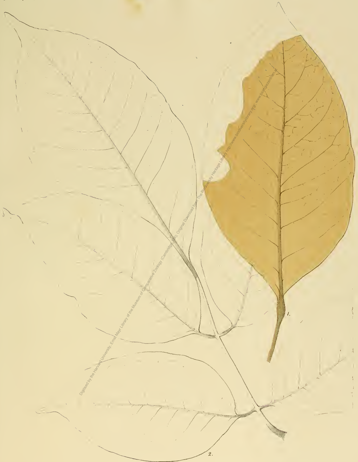
Fig. 1. Smutzia palaeodendron Unger.