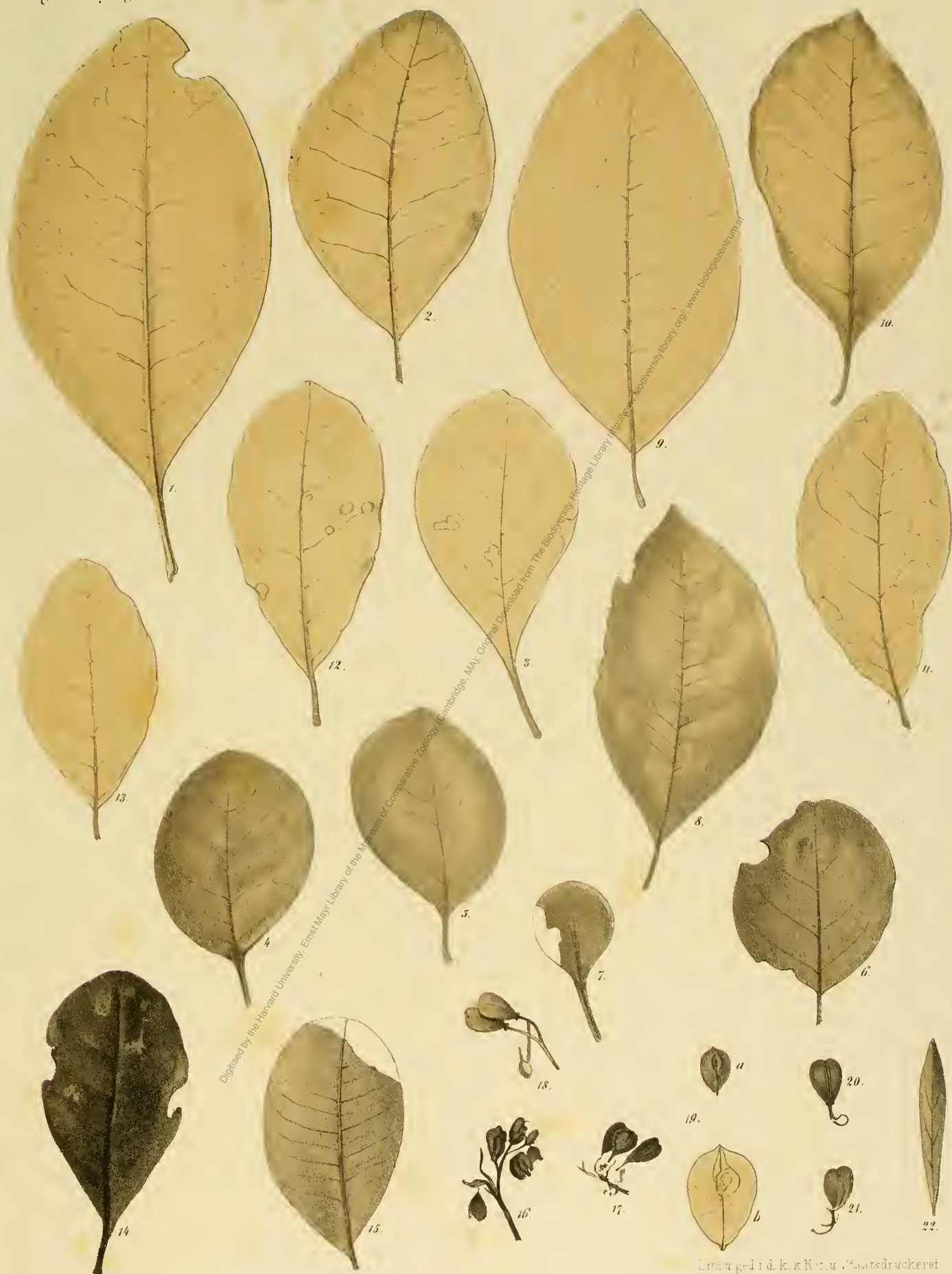
Fig. 1. Pittosporum Putterlicki Ung. Fig. 8. 13. Pittosporum pannonicum Ung. Fig. 14. 15. Pittosporum cuneifolium Ung. Fig. 16-22. Bursaria radobojana Ung.