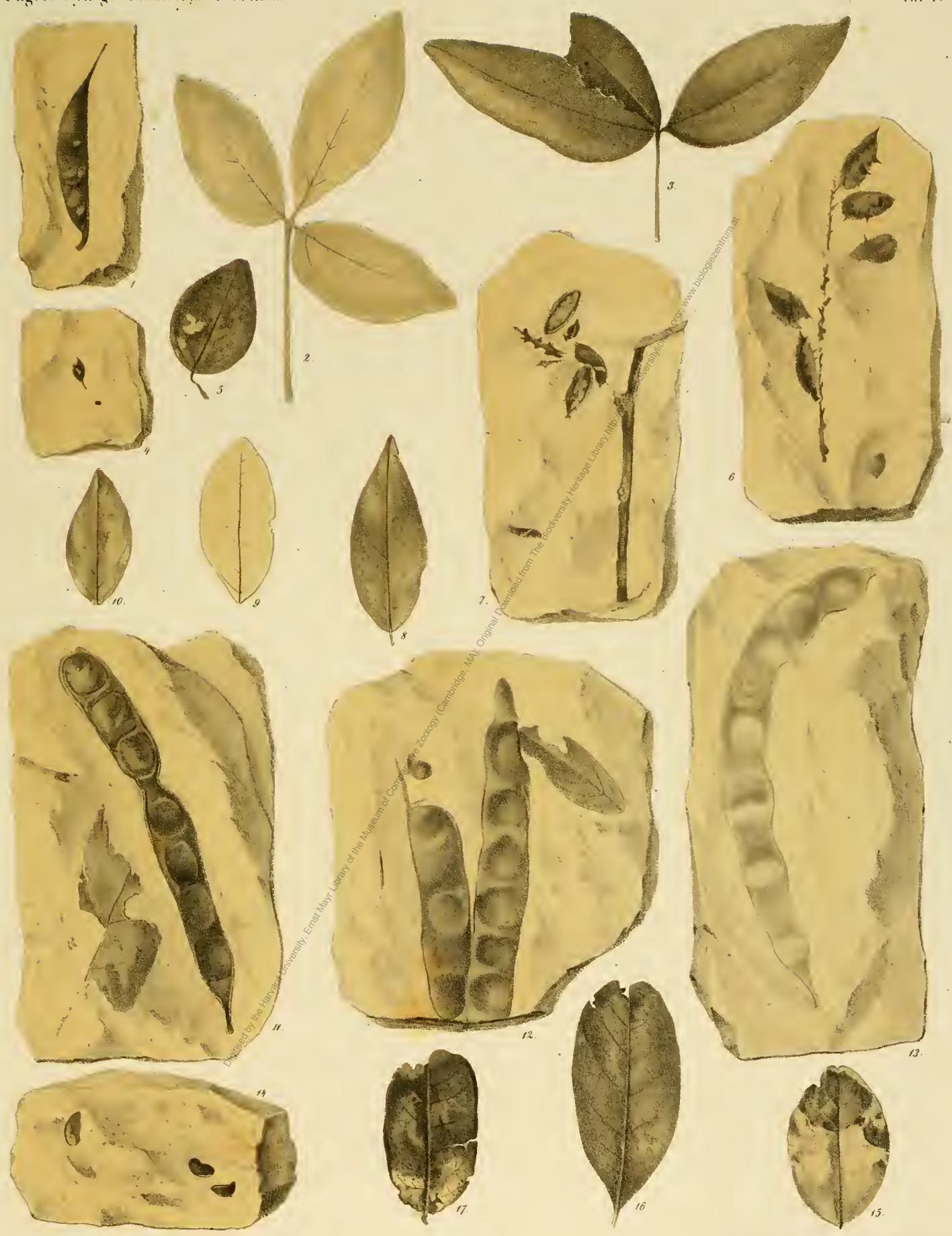
Fig. 1. Cytisus Dionysi U. Fig. 2. Cytisus Freyburgensis U. Fig. 3. Cytisus Rudabojensis U. Fig. 4. 5. Ameriphus stirpinii U. Fig. 6. 10. Glycyrrhiza Blandusii U. Fig. 11. 17. Robinia Hesperidum U.