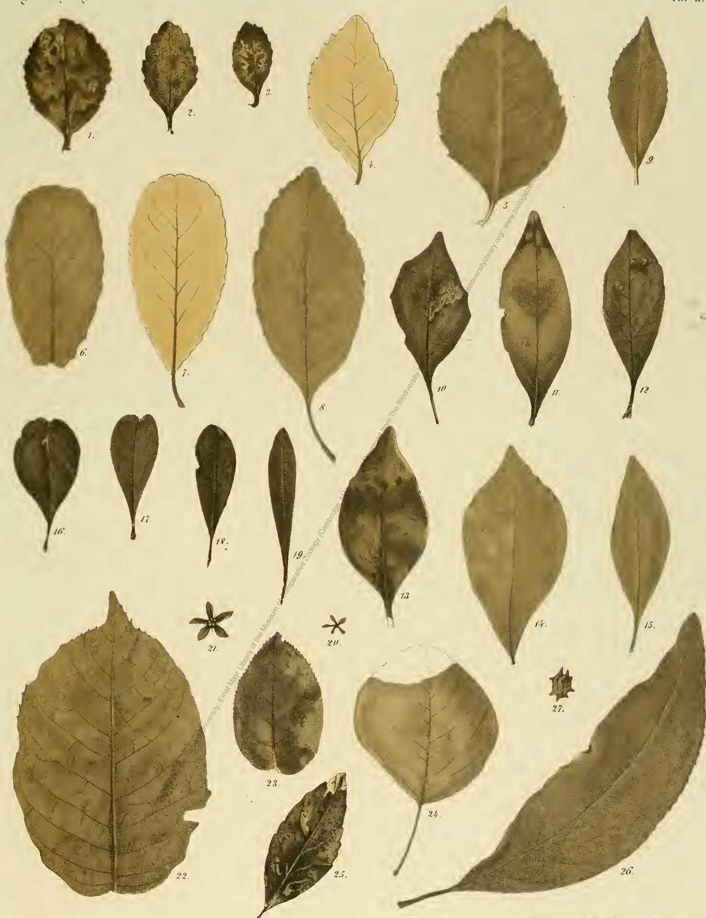
Fig. 1 Celastrus vulsmielii Ung.