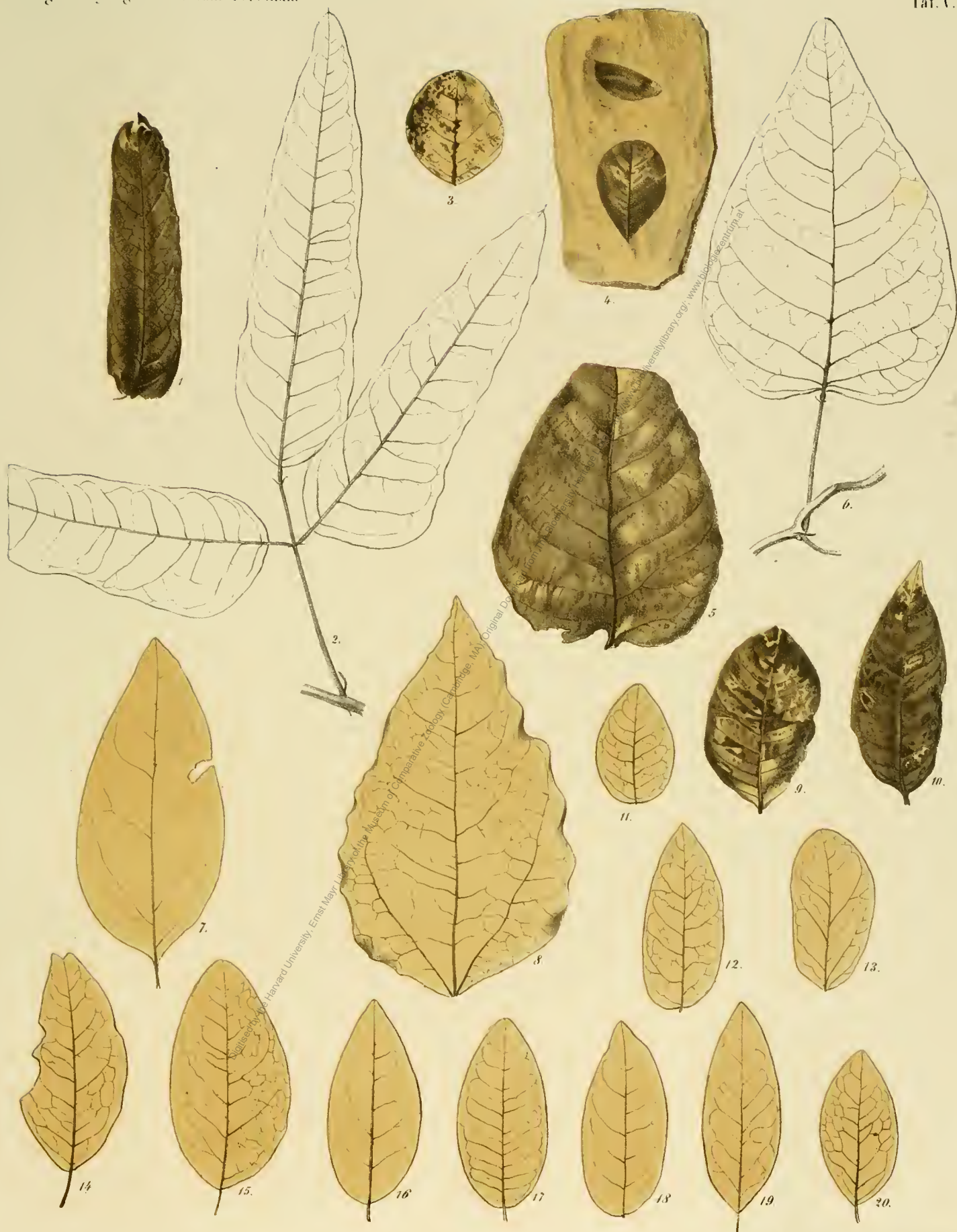
Fig. 1. Physolobium kinneyi U. Fig. 3. Physolobium orbiculare U. Fig. 4. Physolobium antiquum U. Fig. 5. Hurdenbergia orbis rotatus U. Fig. 7. Erythrina daphnoides U. Fig. 8. Erythrina Phaeolites U. Fig. 9-10. Phaeolites securiformis U. Fig. 11-20. Phaeolites entolus U.