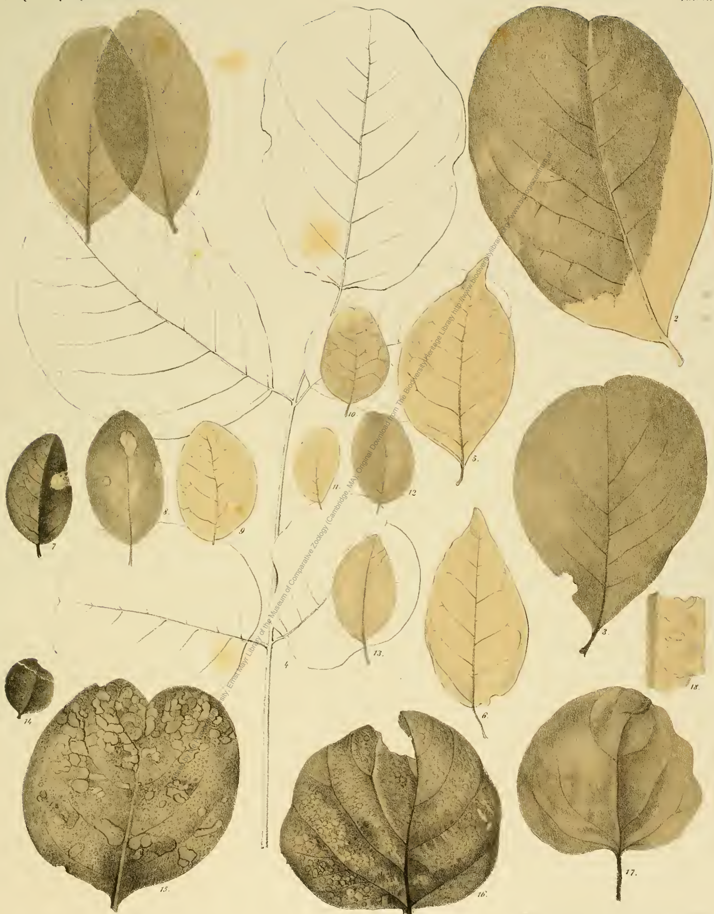
Fig. 1. Dalbergia sotzkiana V. Fig. 2, 3. Piscidia Bythrophyllum V. Fig. 5, 6. Piscidia antiqua V. Fig. 7-14. Sophora europaea V. Fig. 15-18. Cercis radobnjana V.