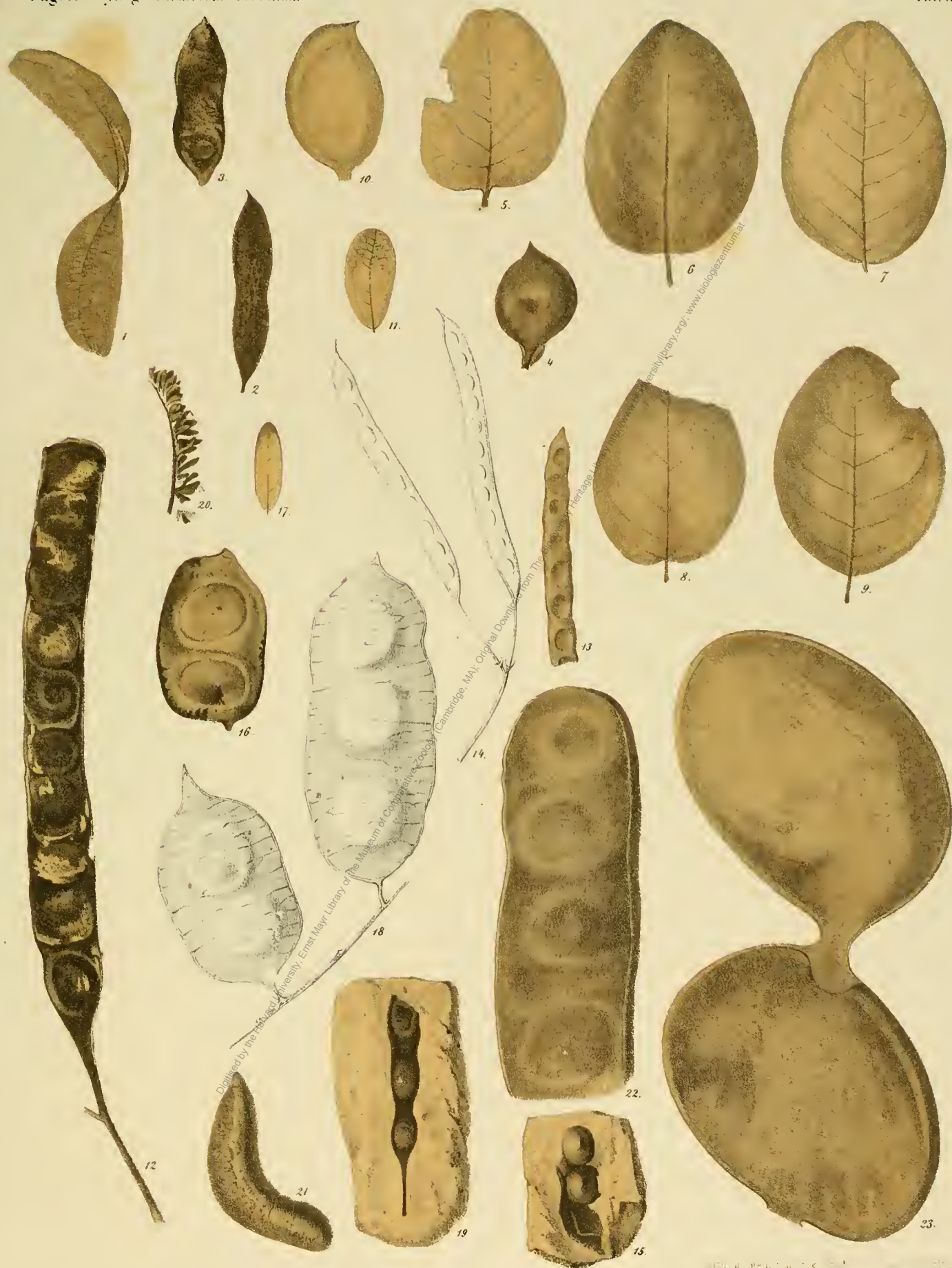
Fig. 1. Alnus curvum radobojanum U. Fig. 10. Copulifera kymeanum U. Fig. 15. Mimosa borealis U.