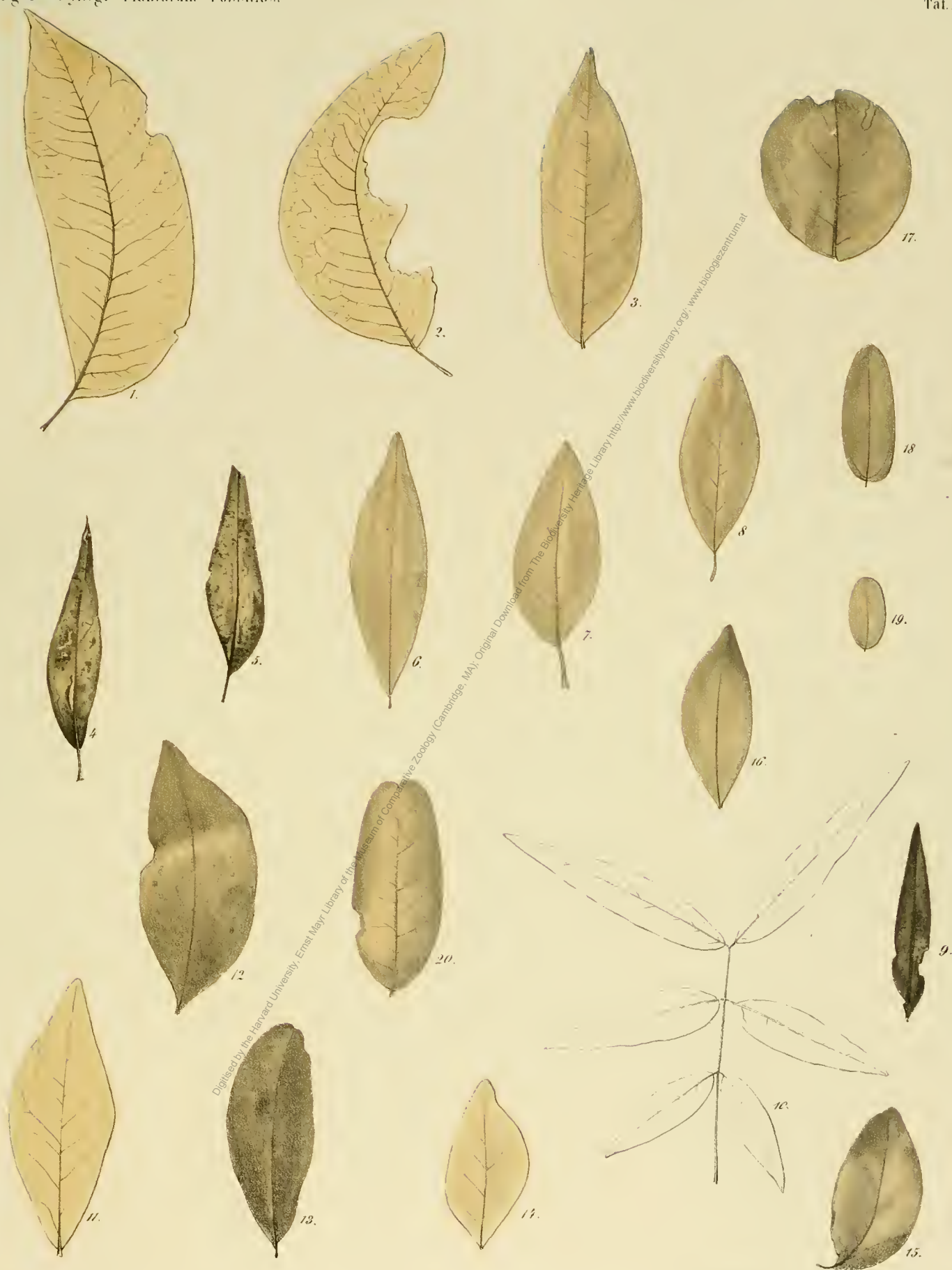
Fig. 1. Calisia Phaseolites U. Fig. 4-8. Calisia Memnonia U. Fig. 9. Calisia ambigua U. Fig. 11-16. Calisia lignitum U. Fig. 17. Calisia rotunda U. Fig. 18-19. Cesolpinia tamarindacea U. Fig. 20. Cesolpinia deleta U.