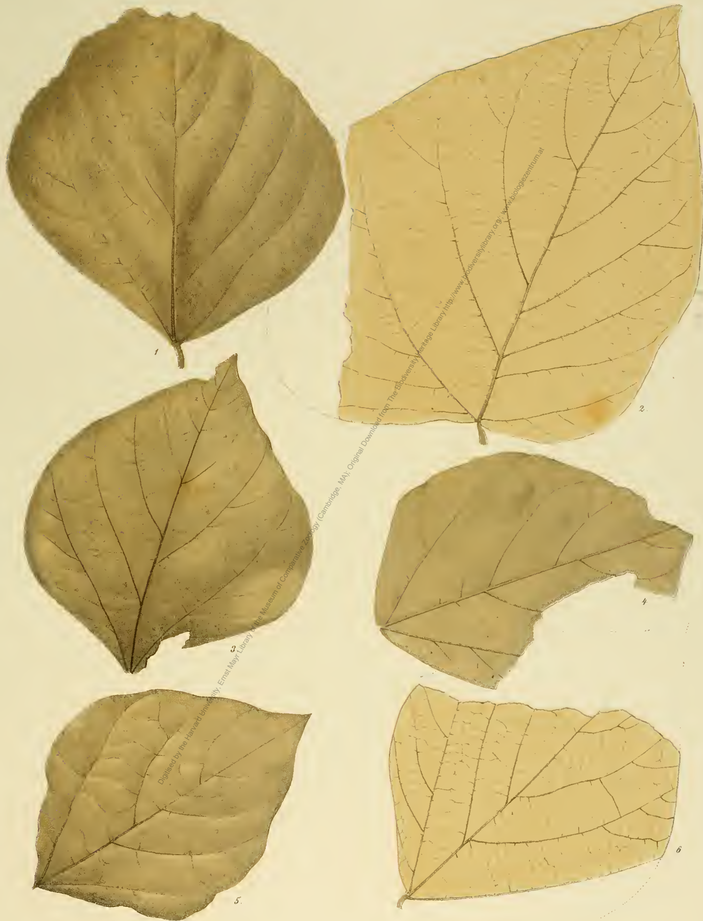
Fig. 1-6. Delichites maximus Ung.