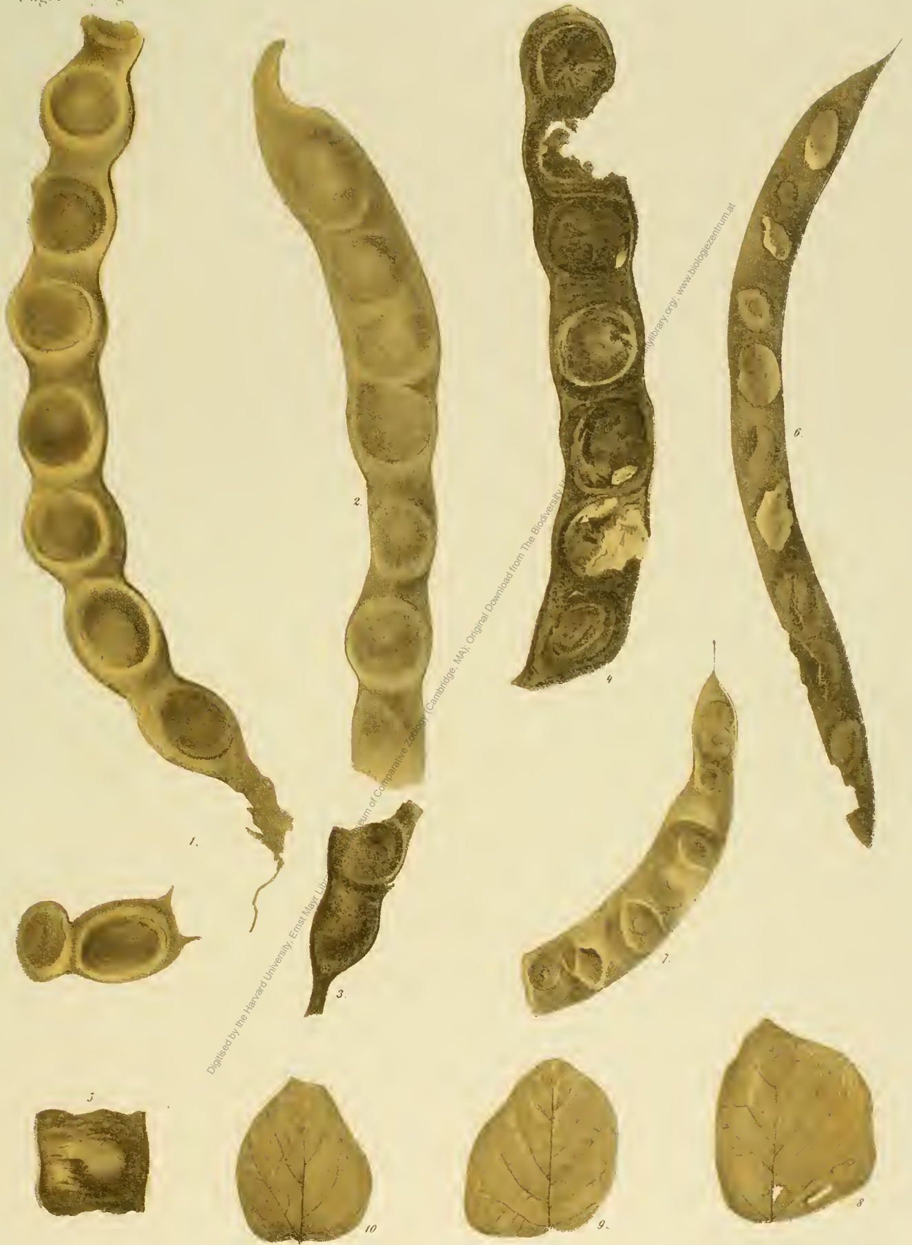
Fig. 1-5 Dolichites maximus Eng. Fig. 6-7 Dolichites europaeus Eng. Fig. 8-10 Phaseolites angustifolius Eng.