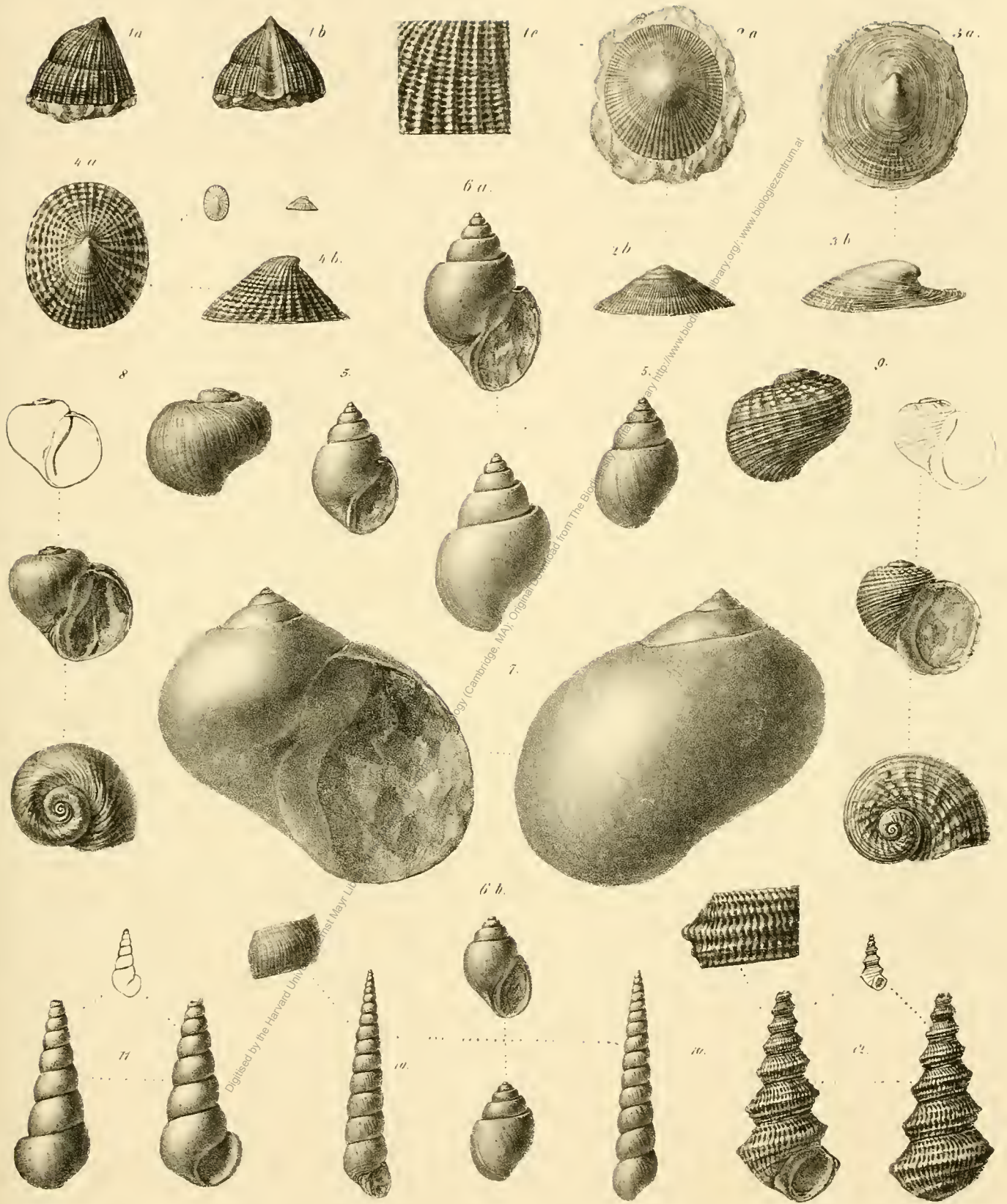
Fig. 1. Deslongchampsia loricata Lbe. Fig. 2. Patella aspidiata Lbe. Fig. 3. Helcion semirugosum Lbe. Fig. 4. Helcion Balinense Stolte. Fig. 5. Natica Bajocensis d'Orb. Fig. 6. Natica Cynthica d'Orb. Fig. 7. Natica pertusa Stol. Fig. 8. Natica Cornelia Lbe. Fig. 9. Veritopsis Bajocensis d'Orb. Fig. 10. Chemnitzia dilatata Lbe. Fig. 11. Fulima communis Morr & Lyc. Fig. 12. Mathilda enclypa Lbe.