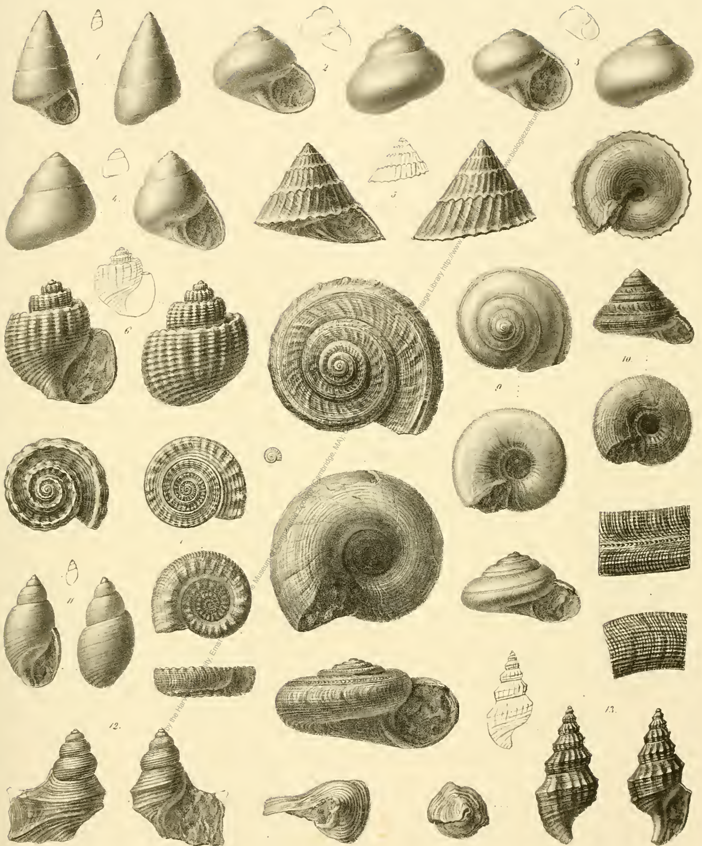
Fig 1 Trachas Abbelsoni Morr & Lyc Fig 2 Chrysostoma Lemoni d'Orb Fig 3 Chrysostoma ovulata Hbt & Dslgch Fig 4 Chrysostoma papillata Hbt & Dslgch Fig 5 Onustus Heberti Lbe Fig 6 Purpurina coronata Hbt & Dslgch Fig 7 Solarium Hörnesii Lbe Fig 8 Pleurotomaria semiornata Stol Fig 9 Pleurotomaria Chryseis L Fig 10 Pleurotomaria Agathis d'Orb Fig 11 Acteon Lorieri Hbt & Dslgch Fig 12 Alaria tumida Lbe Fig 13 Alaria ornatifissima Stol