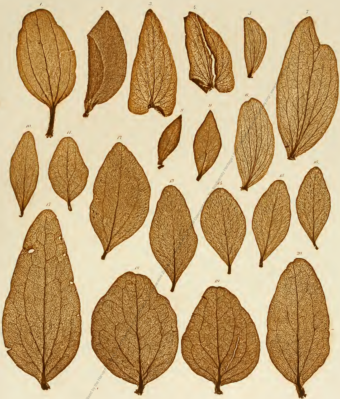
1. Loranthus sp. Nov. Holl. 2. Oryctanthus sp. Am. trop. 3, 4. Psittacanthus cordatus. 5—7. P. falcifrons. 8, 9. Loranthus Poeppigii. 10—20. Oryctanthus ruficaulis.