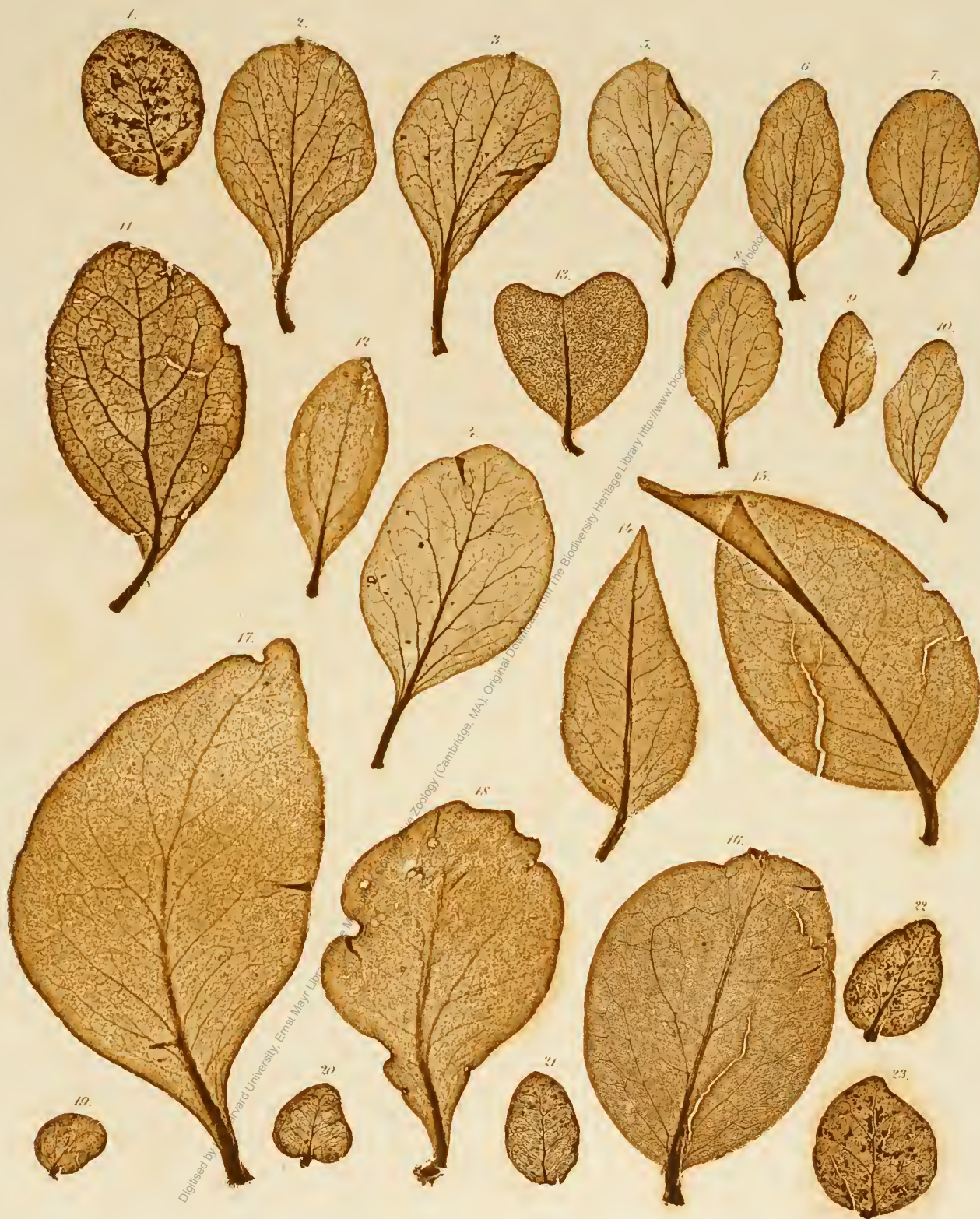
1, 19—23. Loranthus buxifolius . 2—5. L. mutabilis . 6—10. L. europaeus . 11, 12. L. memecifolius . 13. L. sp. Guatem. 14—16. Phthirusa Theobromae . 17, 18. Loranthus martinicensis .