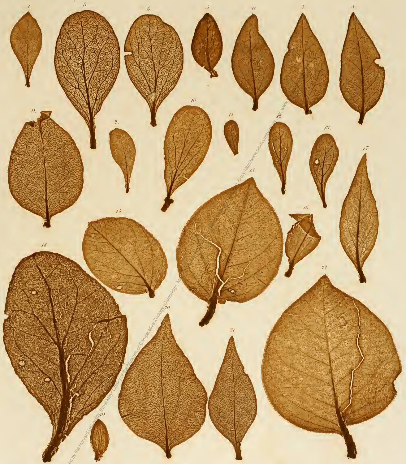
1, 2. Phrygilanthus verticillatus . 3, 4. Antidaphne viscoidea . 5—8. Plithirusa alternifolia . 9, 20, 21. Struthanthus pterygopus . 10. Dendrophthoe fasciculata . 11—13. D. cuneata . 14, 15, 22. Struthanthus marginatus . 16, 17. St. polyanthus . 18. Phoradendron pteroneuron . 19. Loranthus Sternbergianus .