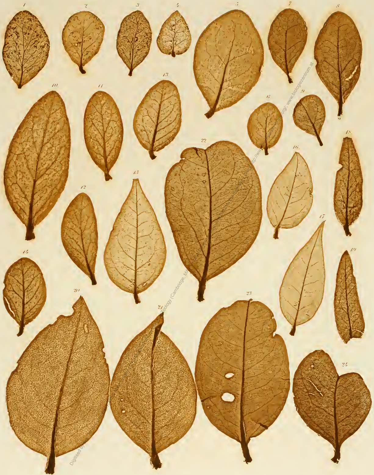
1—4. Phrygilanthus heterophyllus . 5, 6. Phoenicanthemum Wallichianum . 7—9. Dendrophthoe celastroides . 10—12. Loranthus sp. Nov. Holl. 13, 14. Struthanthus flexicaulis . 15—17. St. concinnus . 18, 19. Psittacanthus pycnanthus . 20, 21. Phthirusa ovata . 22—24. Ph. pyrifolia .