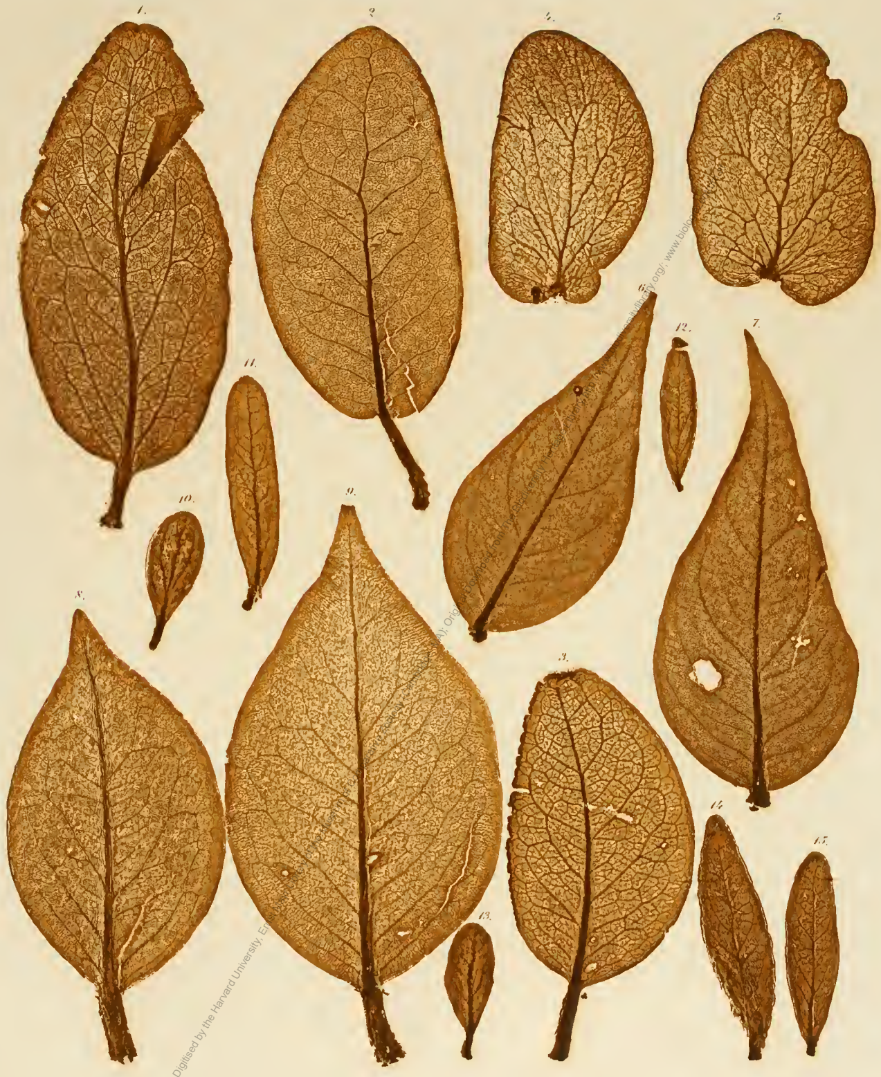
1—3. Loranthus rufescens . 4, 5. Psittacanthus bicalyculatus . 6, 7. P. peronopetalus . 8, 9. Struthanthus syringifolius . 10—15. Loranthus oleaeifolius .