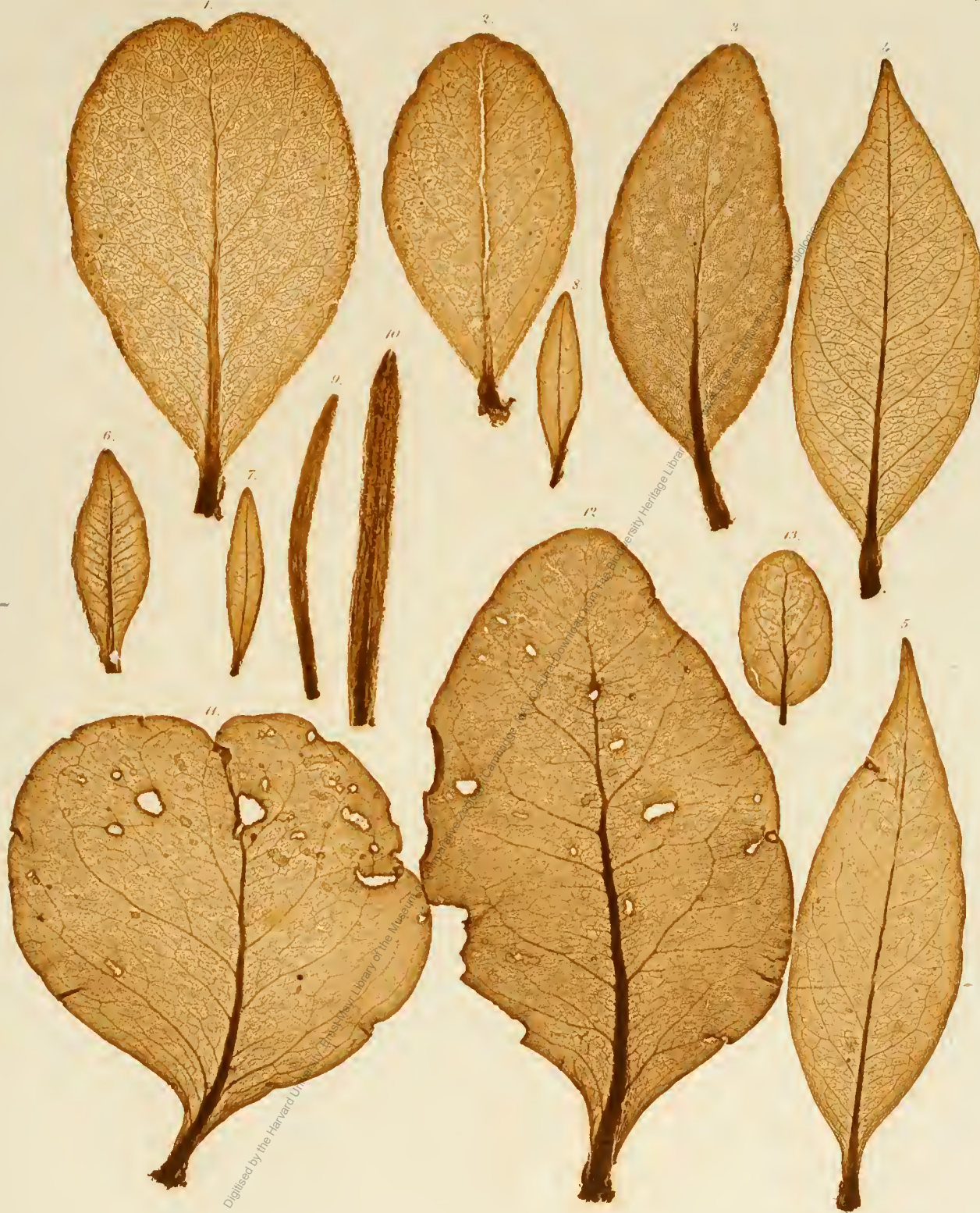
1, 2. Loranthus sp. Ind. or. 3. L. coriaceus . 4, 5. Macrosolen ampullaceus . 6—8. Nuytsia sp. Nov. Holl. 9, 10. N. floribunda . 11, 12. Psittacanthus Collum Cygni . 13. Loranthus glaucocarpus .