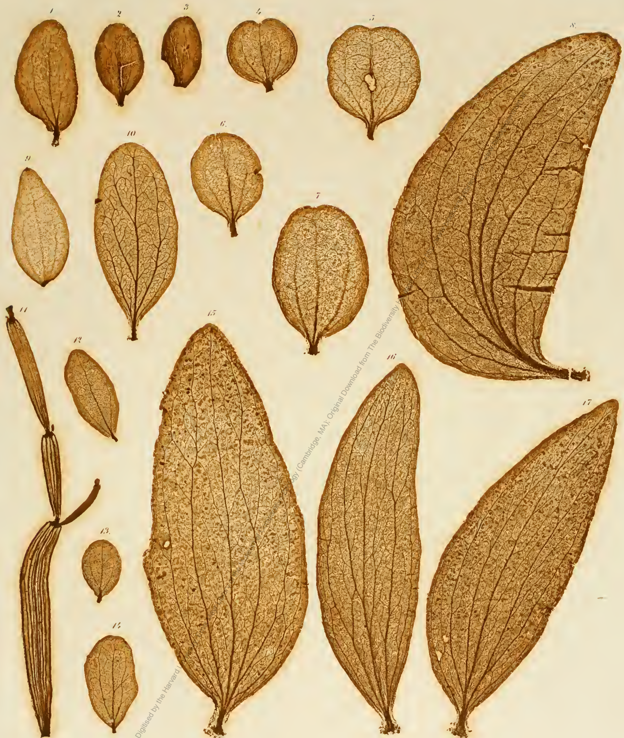
1—3. Loranthus Schimperii . 4—7. Phoradendron emarginatum , S. Ph. Perrottetii. 9. Viscum incanum , var. aureum . 10. Ixidium Schottii . 11. Phoradendron dichotomum . 12—14. Phthirusa clandestina . 15—17. Psittacanthus encellaris .