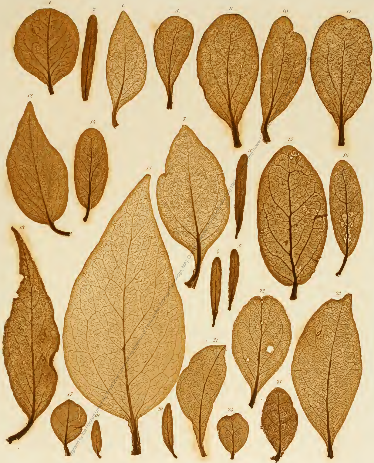
1. Loranthus sp. Guatem. 2—5. L. sp. Nov. Holl. 6, 7, 18. Tolypanthus loniceroides . 8—11. Loranthus sp. ins. St. Maurit. 12, 13. Struthanthus densiflorus . 14—16. Loranthus oblongifolius . 17. Struthanthus flexicaulis . 19, 20. Loranthus Schlechtendalium . 21—23. L. viridiflorus . 24, 25. Dendrophthoe tetrapetala .