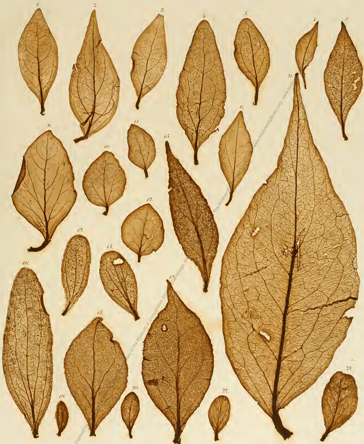
1—3. Loranthus ligustrinus . 4. 5. L. Krauseanus . 6—8. Struthanthus tenuiflorus . 9—12. Phrygilanthus tetrandrus . 13, 14, 16. Phoradendron rubrum . 15, 17, 18. Ph. latifolium . 19, 20. Dendrophthoe glauca . 21. Struthanthus acuminatus . 22, 23. Tupeia antarctica .