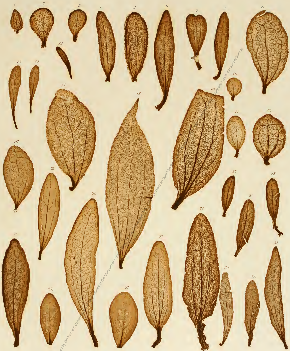
1. Viscum tricostatum , 2, 3. V. tuberculatum , 4, 5. V. ericiatum . 6—8. Loranthus sp. Nov. Holl. 9—12. Phoradendron flavescens . 13, 14. Loranthus Melaleucæ . 15. L. Gaudichaudi . 16, 17. Viscum orientale . 18. Phoradendron falcatum . 19—21. Dendrophthoe pruinosa . 22—24. D. congener . 25, 26. D. luzonensis . 27—29. Loranthus miraculosus . 30—32. Misodendron oblongifolium .