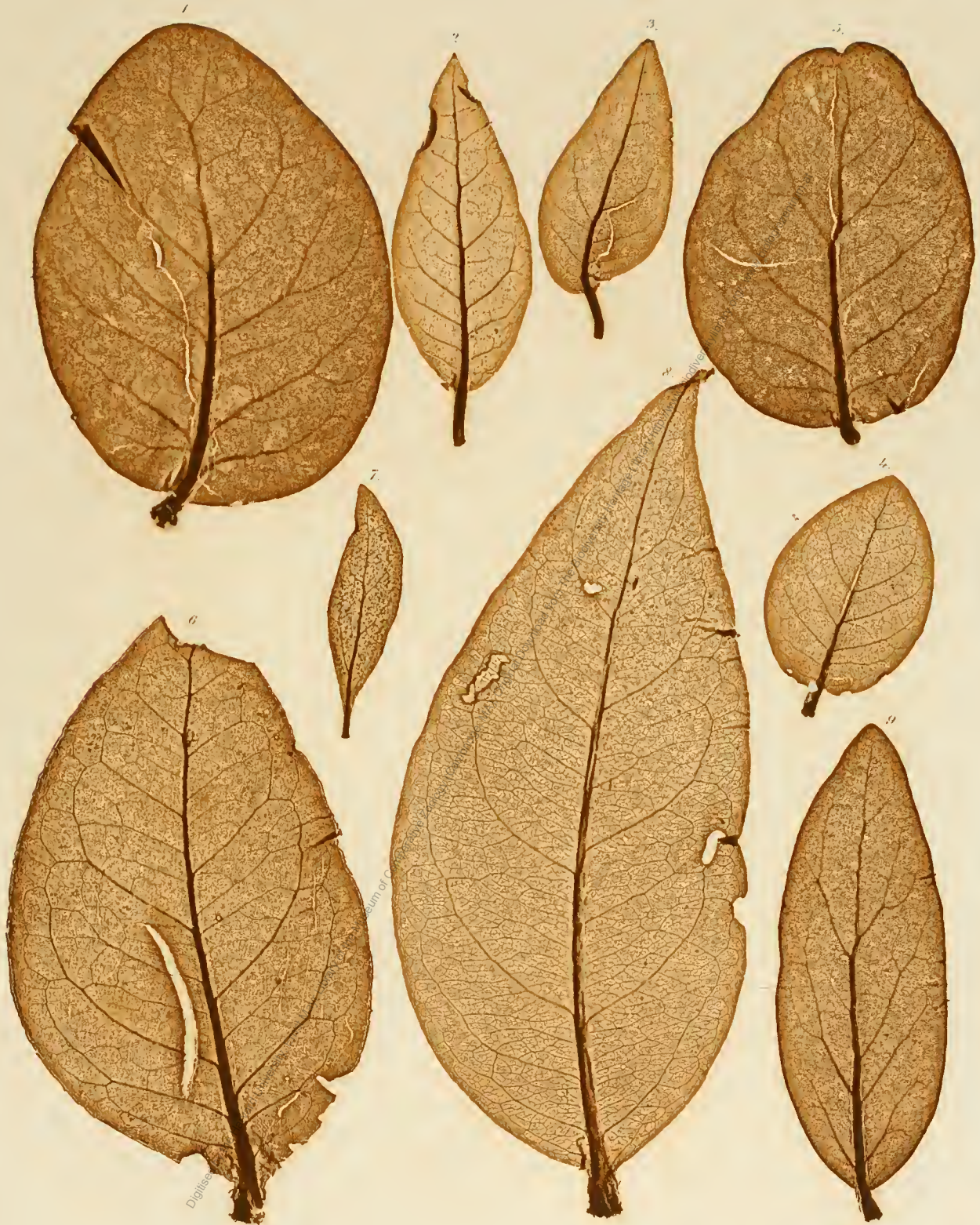
1, 5. Dendrophthoe longiflora . 2—4. D. vestita . 6. D. umbellifera . 7. Loranthus globiferus . 8. Macrosolen formosus . 9. Loranthus sp. Asiae trop.