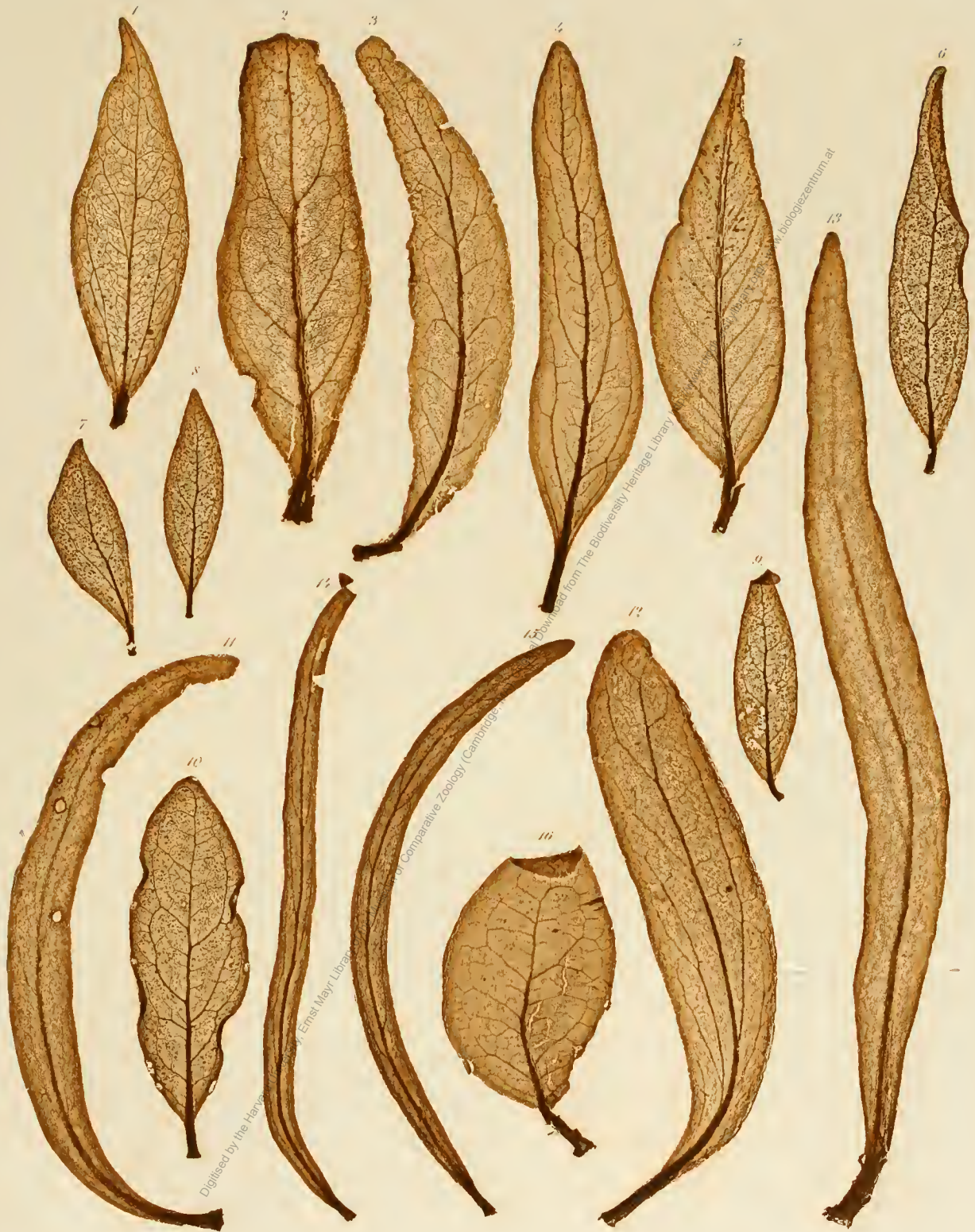
1. Loranthus sp. Ind. or. 2, 3. L. dodonaeaeifolius . 4. L. macrosolen . 5. L. sp. And. 6—10. L. globiferus . 11—13. Dendrophthoe eucalyptoides . 14, 15. D. falcata . 16. Loranthus pentagonus .