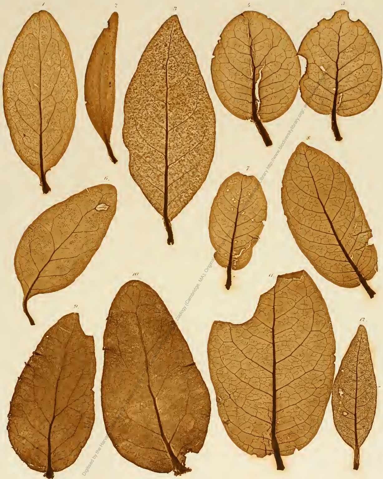
1. Loranthus sp. Ind. or. 2. Dendrophthoe eucalyptoides. 3, 12. Tolypanthus involueratus. 4, 5. Dendrophthoe sp. Ind. or. 6. Loranthus pruifolius. 7, 8, 11. Dendrophthoe Schultesii. 9, 10. D. longiflora.