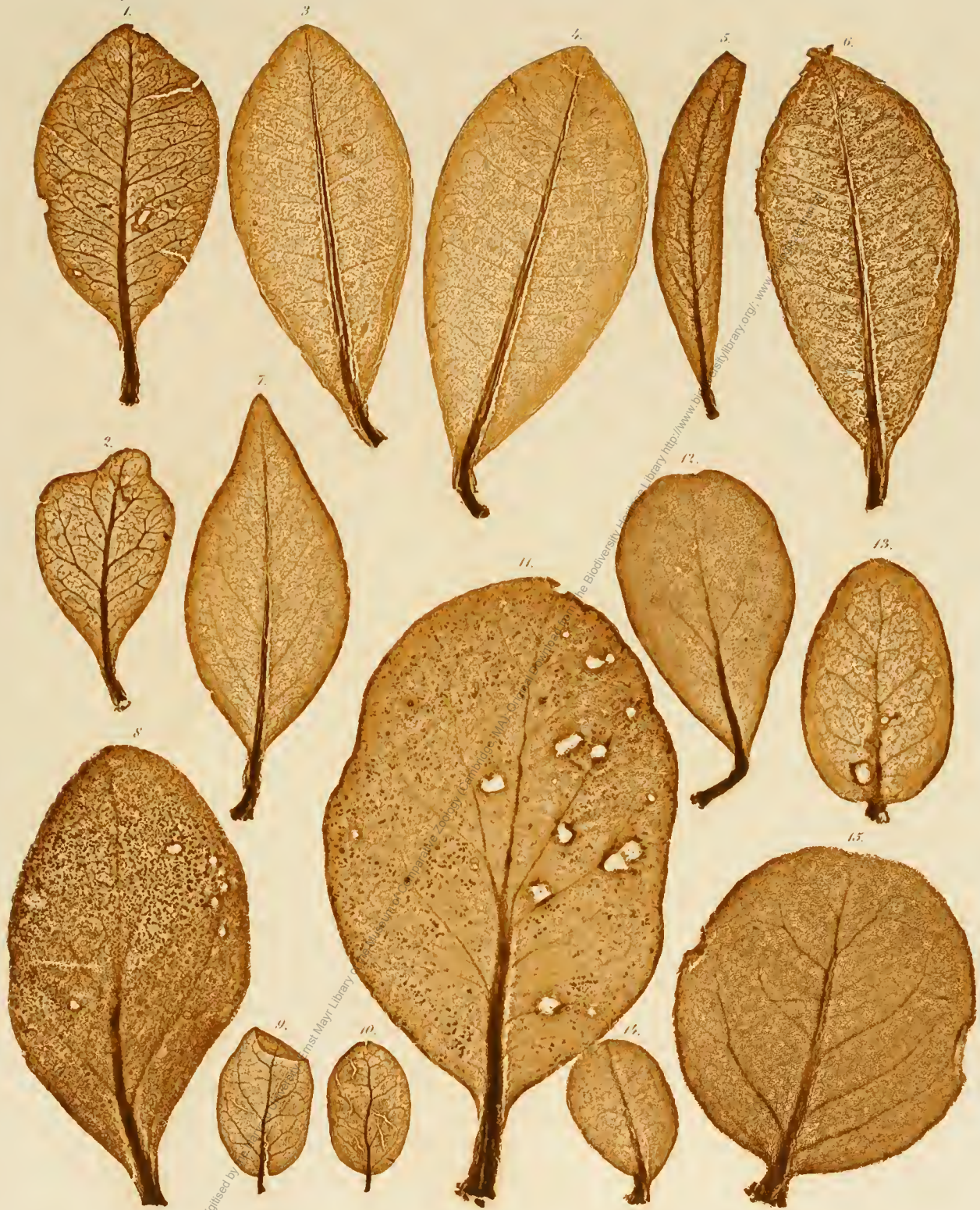
1, 2. Psittacanthus flavo-viridis . 3, 4, 6. Phrygilanthus Tagna . 5. Loranthus oleaeifolius . 7. Struthanthus syringifolius . 8. Psittacanthus robustus s. 9, 10. Loranthus glaucocarpus . 11, 12. Psittacanthus dichrous . 13—15. P. glaucocoma .