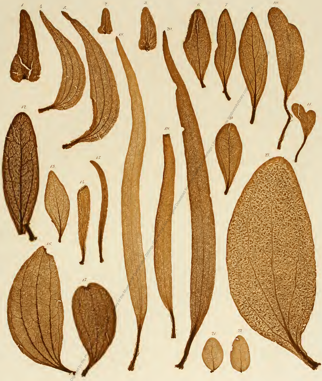
1—3. Loranthus undulatus . 4, 5. Phoradendron velutinum . 6—9. Loranthus natalitius . 10, 11. Dendrophthoe Miquelii . 12. Loranthus sp. Nov. Holl. 13. Oryctanthus ruficaulis . 14, 15. Loranthus Exocarpi . 16, 17. Phoradendron xanthophyllum . 18—20. Dendrophthoe pendula . 21, 22. Loranthus myrtifolius . 23. Phoradendron bathyoryctum .