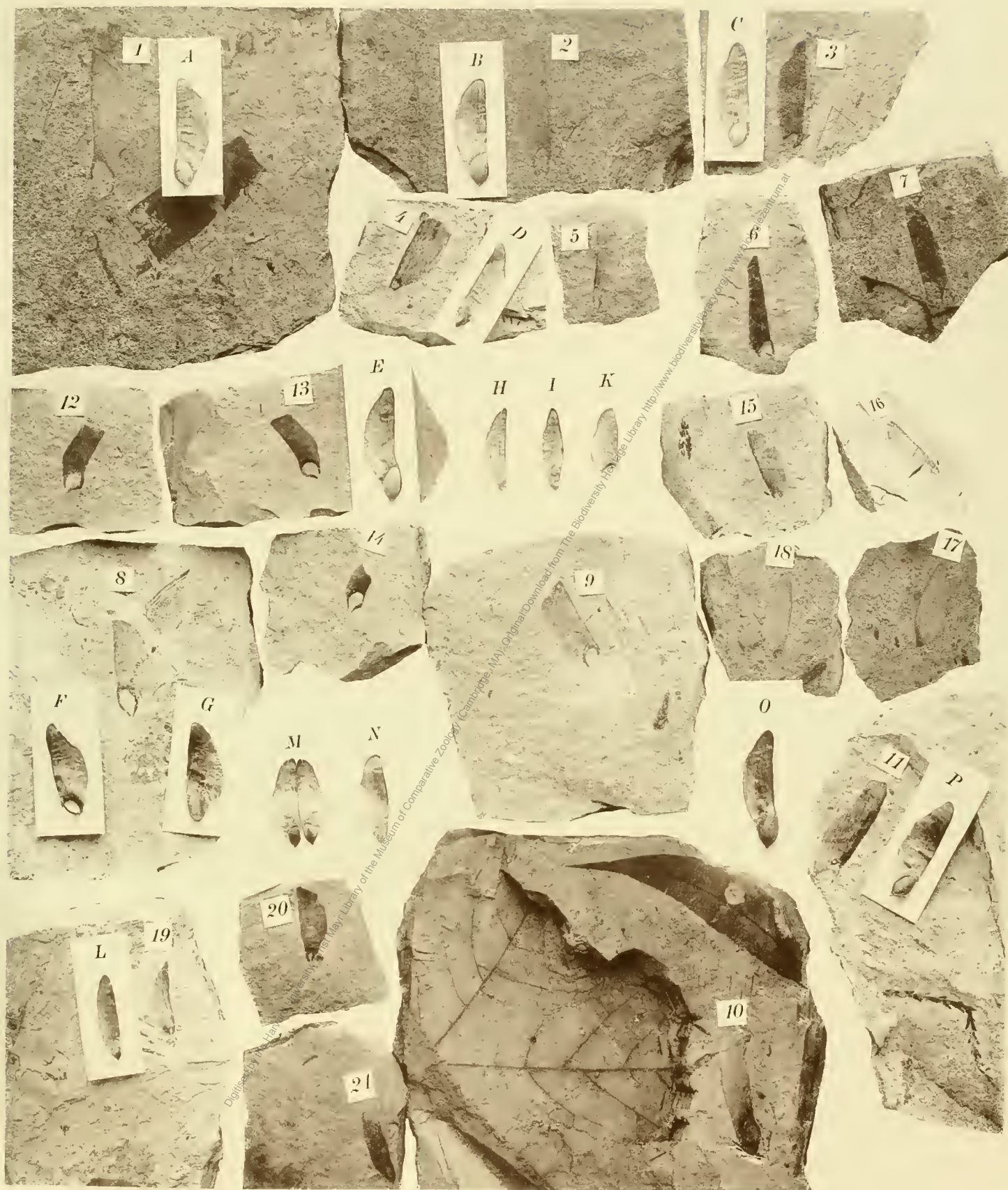
Fig. 1, 3-11. Pinus Laricio . Fig. 2. Übergangsglied zwischen P. Laricio und prae silvestris . Fig. 12-14. P. hepios . Fig. 15-21 P. prae-silvestris

Lichtdruck d. k. Hof- u. Staatsdruckerei