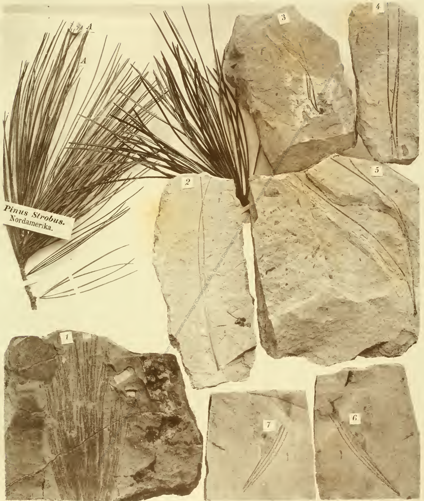
Fig. 1. Pinus Palaeo-Strobus . Fig. 2. P. Palaeo-Laricio . Fig. 3-5. P. praev-laeudaeformis . Fig. 6, 7. P. Palaeo-Cembra .