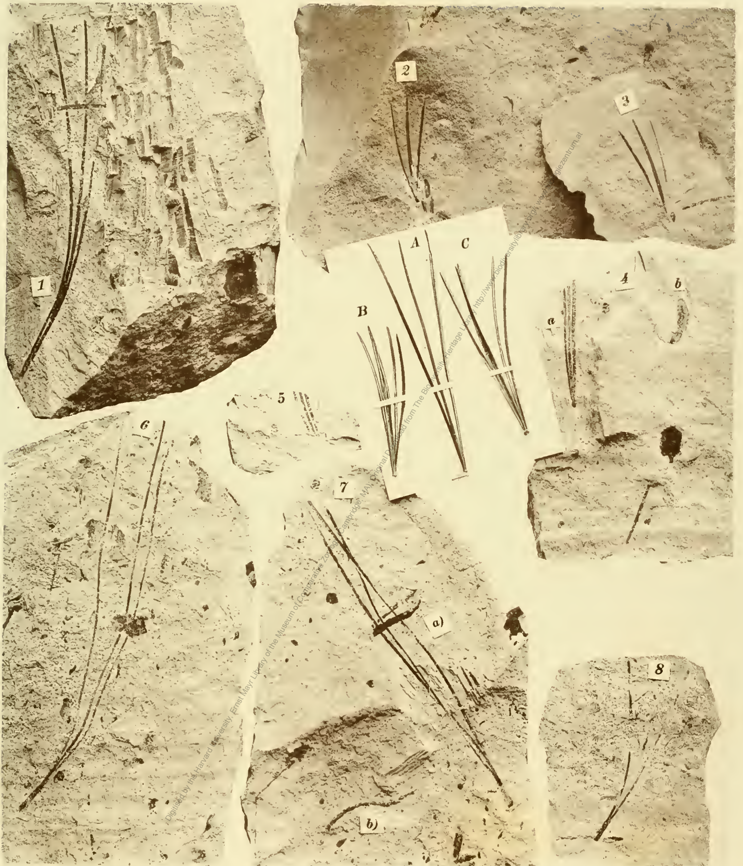
Fig. 1. Pinus taedaeförmis . Fig. 2, 3, A, 5. P. Prae-Cembra . Fig. 4, b. P. hepios . Fig. 6. Übergangsglied zwischen 1 und P. praetaedaeförmis . Fig. 7, 8. Übergangsglied zwischen P. praetaedaeförmis und P. Palaeo-Cembra .