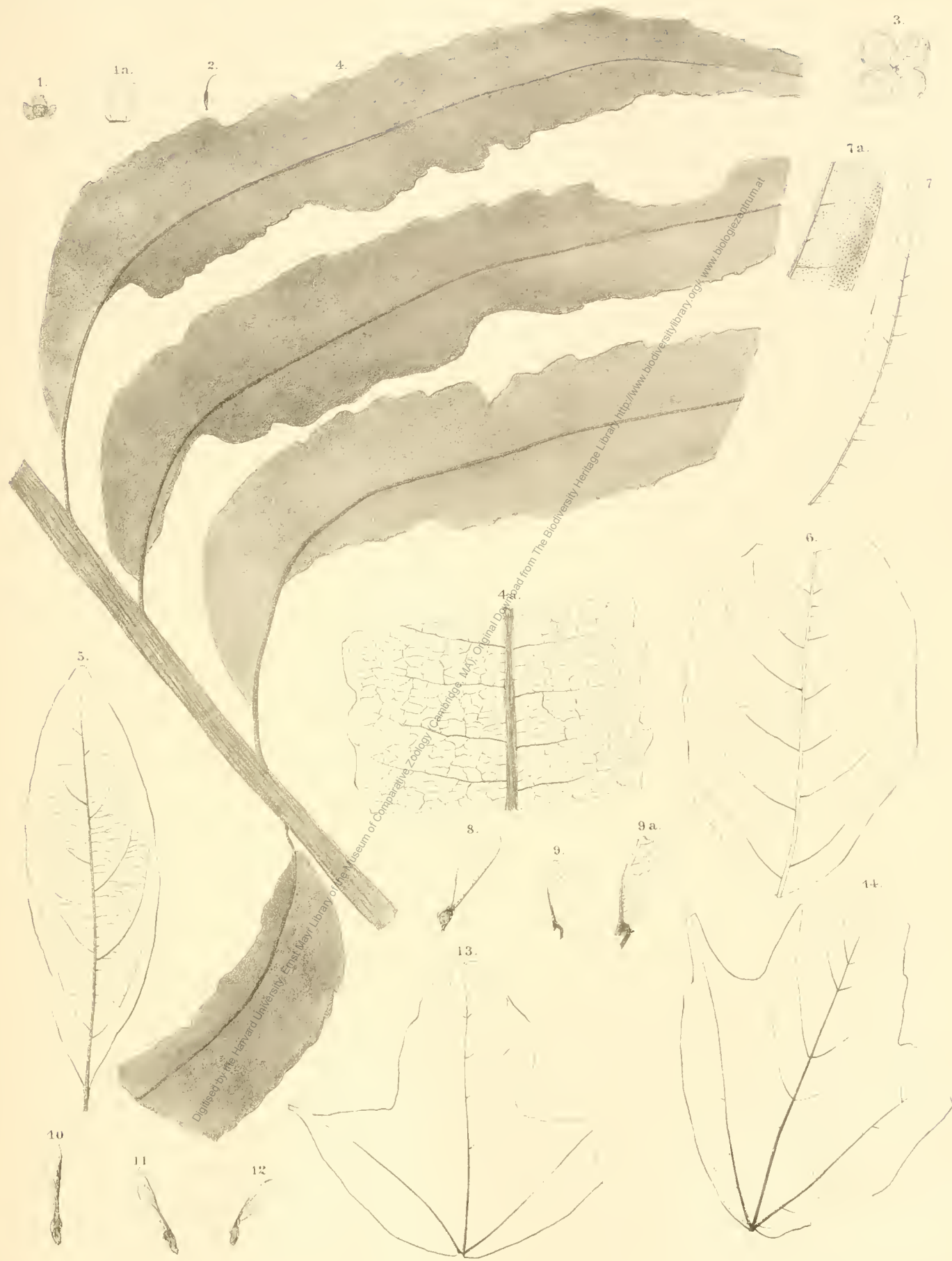
1. Tetrapteris minuta 2. Clematis sagoriana 3. Hydrangea sagoriana 4. Sapindophyllum paradoxum 6. Malpighiastrum rotundifolium 7. Sapindus asperifolius 8, 9. Acer Rumianicum 10, 12. A. stenocarpum 13, 14. A. integrilobum .