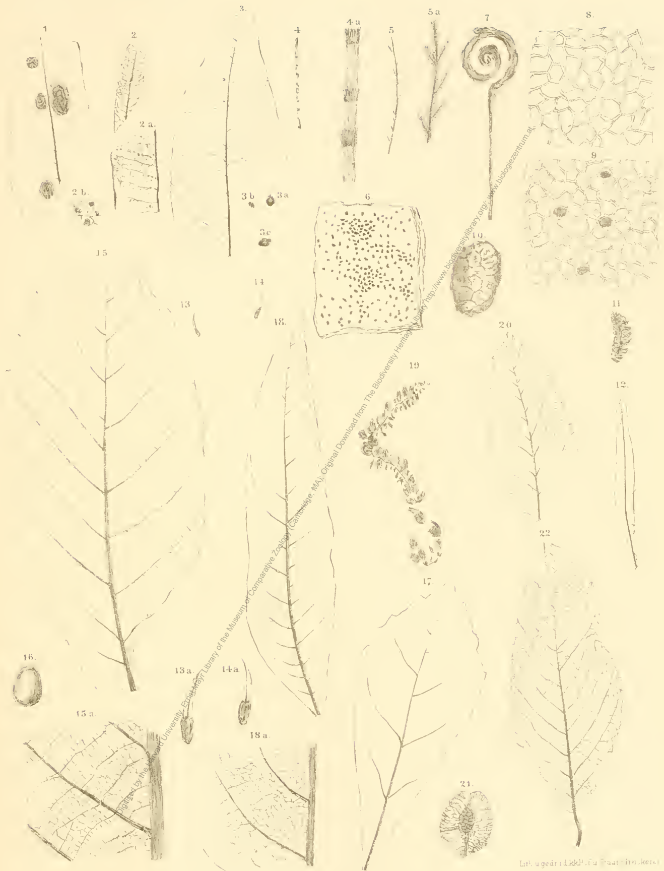
1 Rhytisma grande . 2 Sphaeria minutissima . 3, 5 Fici tenuinervis . 4 Equisetum repens . 5 Muscites sayinensis . 6 Chara Meriani . 7 Farnwedelknospe . 8 Smilax Haudingeri . 9 S. sp. 10 Sequoia Conitziac . 11 Pinus Palaeo Tarda . 12 Podocarpus cocconu . 13, 14 Pasuarina sp. 15 Quercus Nympharum . 16 Q. Lonchitis . 17 Q. tephroides . 18 Castanopsis sagoriana . 19, 20 Carpinus Heeri .